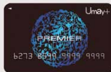
■ ■ Umay+ Premier Card ■ ■

Umay+ Card was launched in August 2006, which is a card used to obtain revolving loan. Umay+ card can be used for installment loan at its allied vendors under the credit-line of revolving loan. The qualification of applicants who can apply Umay+ card is those who have regular monthly income of at least 7,000 Baht (As at 31 December 2018).