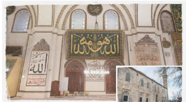
Grand Mosque ini berada di pusat kota Bursa, di kawasan bersejarah dekat bazar dan jalan utama kota tua. Dibangun oleh Sultan Yıldırım Bayezid I antara 1396-1399 M setelah kemenangan dalam Pertempuran Nicopolis.