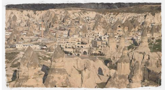
Göreme Valley terletak di wilayah Cappadocia, dekat kota Göreme. Lembah ini merupakan bagian dari Göreme National Park, salah satu situs Warisan Dunia UNESCO..