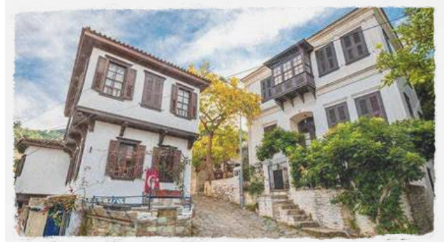
Sirince adalah desa kecil yang terletak di dekat kota Selçuk, Provinsi Izmir, Turki. Desa ini berada sekitar 8 km dari reruntuhan kuno Ephesus dan dikelilingi perbukitan hijau serta kebun anggur.