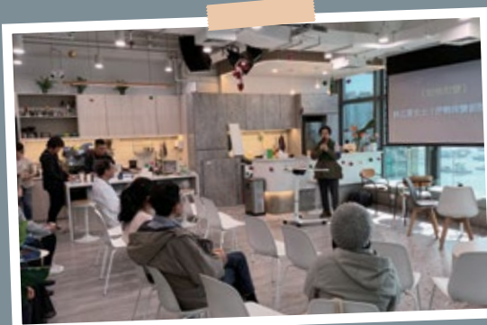
輕鬆Lunch Talk (11月26日)