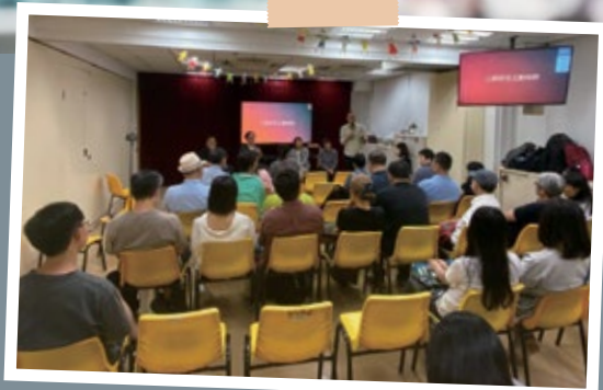
《誰能明白照顧者的困難和壓力？》講座 (10月10日)