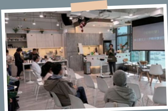
輕鬆Lunch Talk (11月26日)