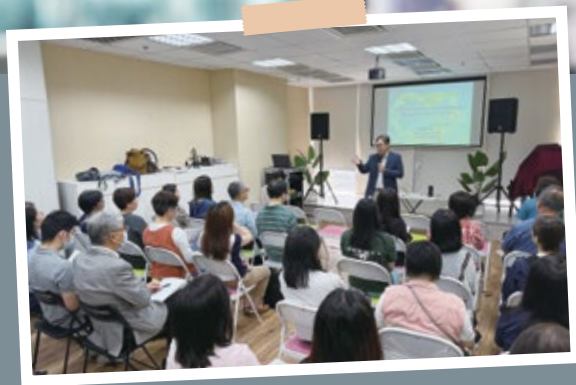
職場減壓我要ACT (4月18及25日)