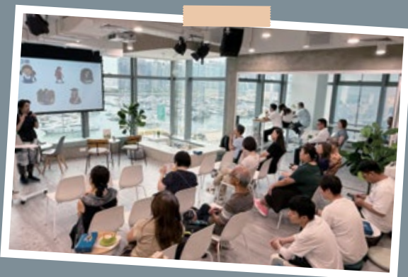
輕鬆Lunch Talk (5月27日)