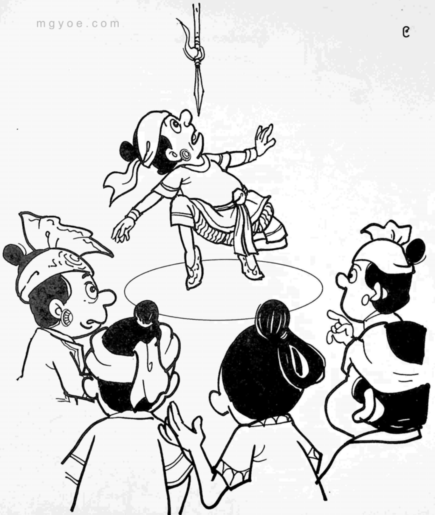
လူစည်ကားရာ နေရာများတွင် လုံအစွမ်းကို ပြသရာ လူအများမှာ အံ့ဩချီးမွမ်းကြ၊ ဆုချီးမြှင့်ကြလေသည်။