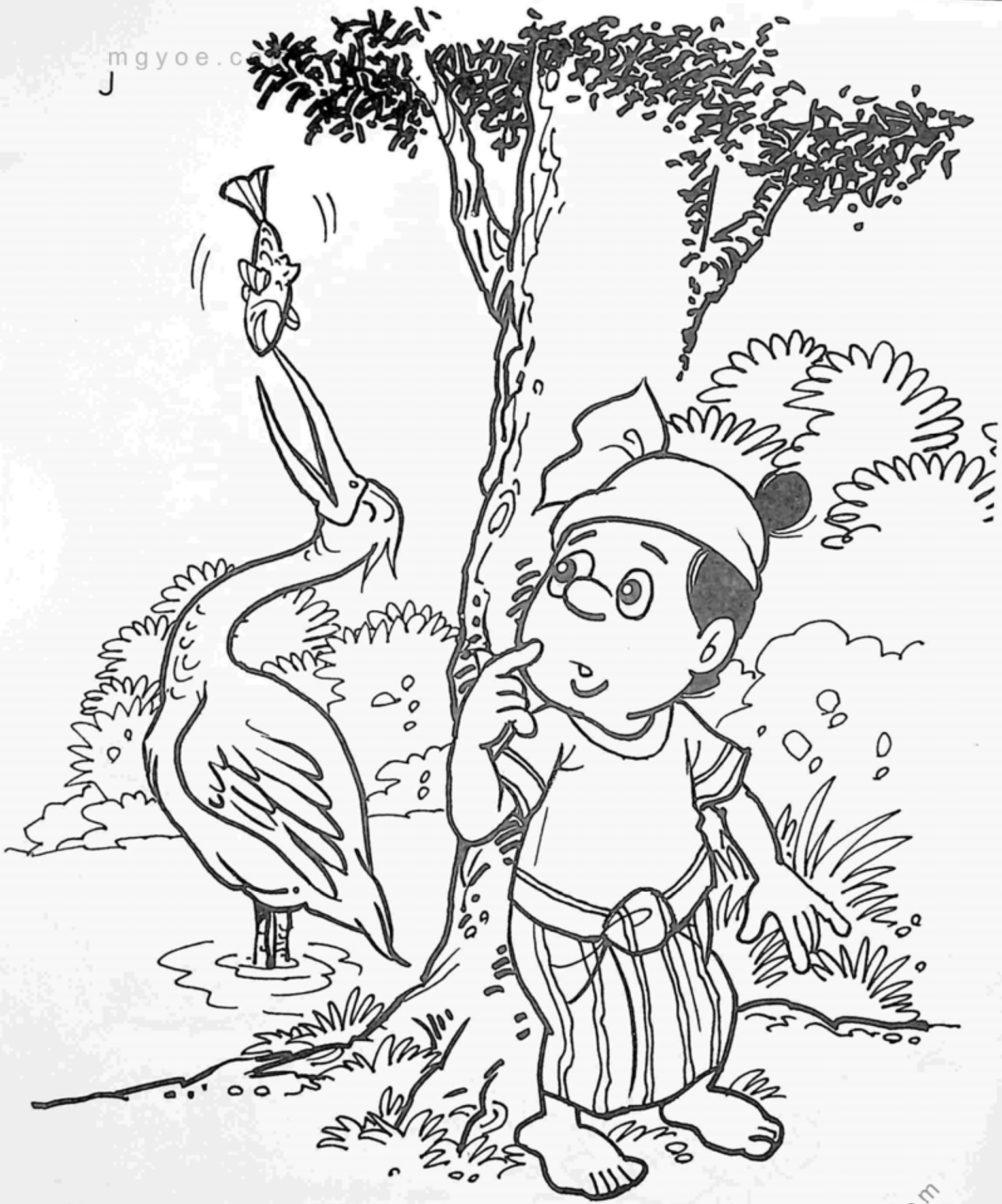
ထိုအချိန်ဝယ် ဗျိုင်းတစ်ကောင်သည် ရေထဲမှငါးကို ဖမ်းယူလိုက်ကာ