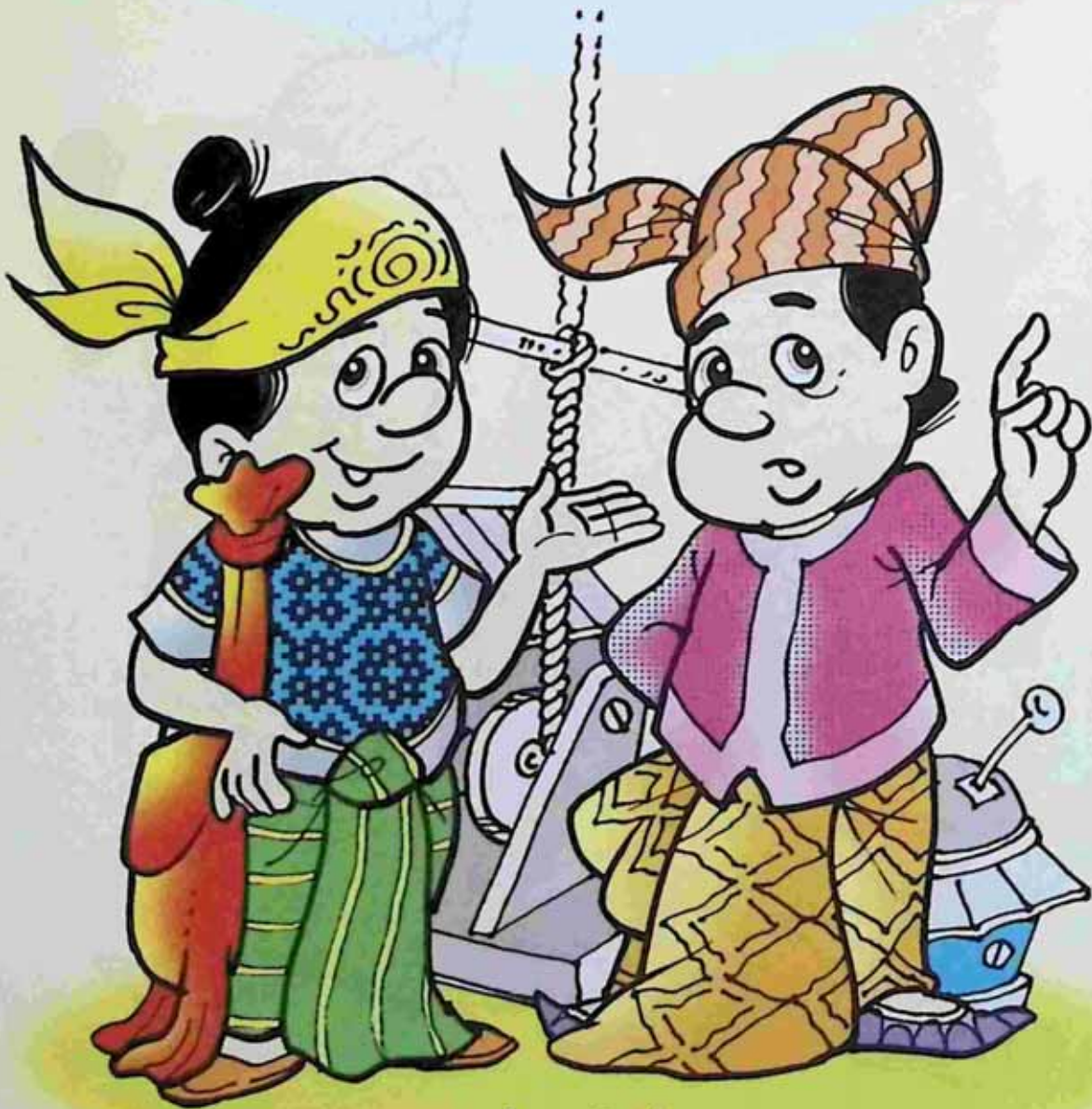
မဂ္ဂဇင်း (၈)