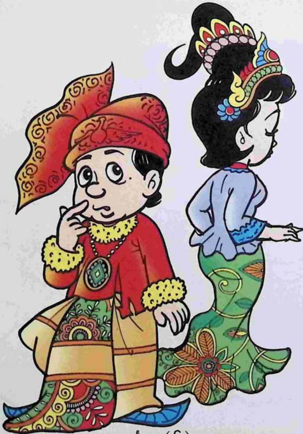
မင်္ဂလာ ( ၆ )

မိမိကိုယ်ကို ကောင်းအောင်ထိန်းလို့ မတိမ်းစေနဲ့ ဆောက်တည်လေ ဥစ္စာကိုပေး နေထိုင်ရေး မျှော်တွေး သုံးချက်ပေ အဲဒါမှ ဗုဒ္ဓဝါဒ ကမ္ဘာ့မင်္ဂလာတွေ ။