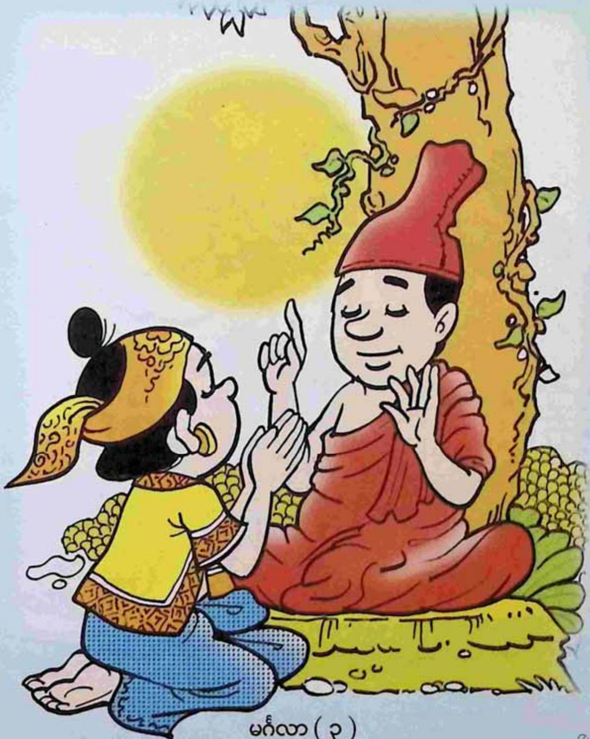
မင်္ဂလာ (၃)

သုံးပါးရတနာ မိဘများနှင့် ဆရာသမားကို ပူဇော်လေ ချမ်းသာကိုပေး ဆက်ဆံရေး မျှော်တွေး သုံးချက်ပေ အဲဒါမှ ဗုဒ္ဓဝါဒ ကမ္ဘာ့မင်္ဂလာတွေ ။