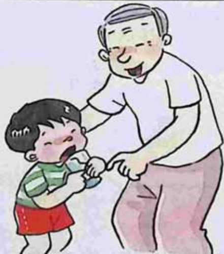
Take advice from grandpa အဘိုးပြောစကားကို နားထောင်သူ။