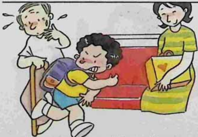
Compete with an old man for a seat အသက်ကြီးသူနှင့် ပြိုင်ပြီး နေရာလှသူ။