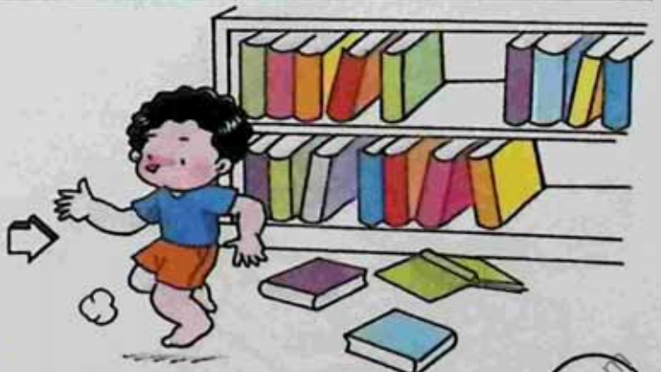
Leave the messy books on the floor စာအုပ်များကို ရုပ်ပွဲနေအောင် ကြမ်းပြင်ပေါ် ချထားခဲ့သူ။