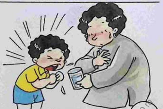
Yells at grandma အဘွားကို ပြန်အော်သူ။