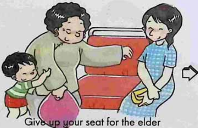
Give up your seat for the elder သက်ကြီးရွယ်အိုများကို နေရာဖယ်ပေးသူ။

Who is right? Tick ✓. ဘယ်သူမှန်ပါသလဲ ၊ အဖြေမှန်ကို အမှန်ခြစ်ပေးပါ။