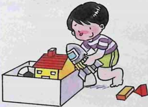
Keep the toys after use ကစားပြီး ကစားစရာများကိုသိမ်းသူ။

Who is right? Tick ✓. တယ်သူမှန်ပါသလဲ ၊ အဖြေမှန်ကိုအမှန်ခြစ်ပေးပါ။