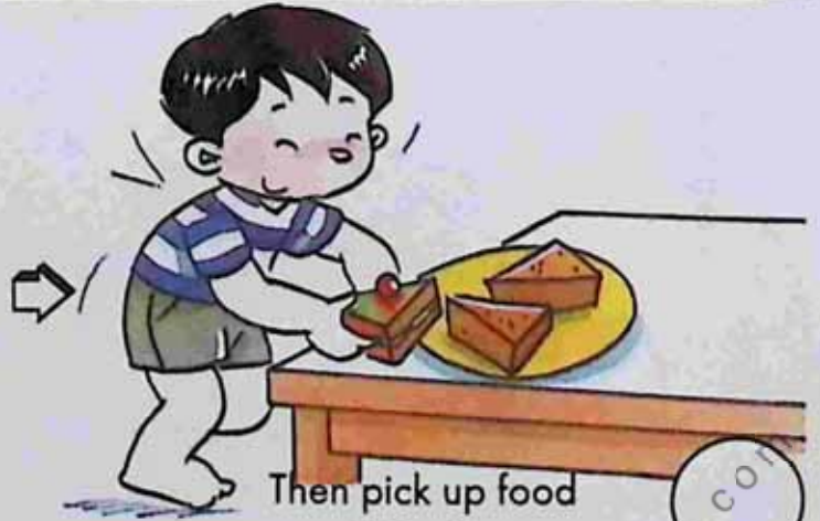
Then pick up food