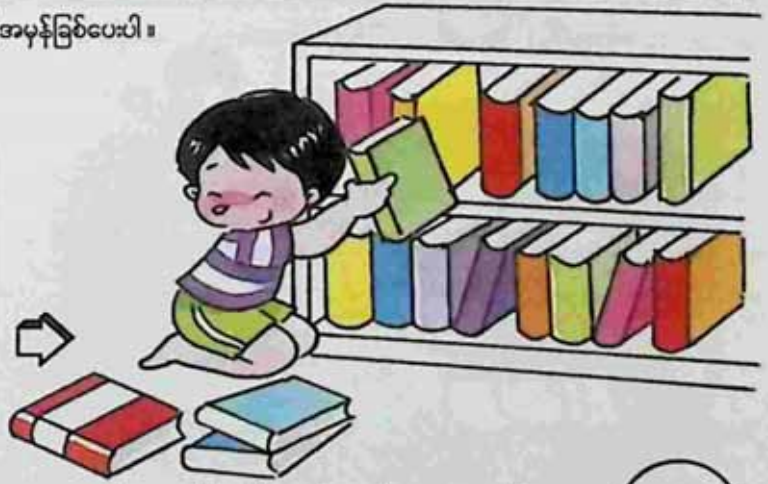
Keep the books after reading ဖတ်ပြီး စာအုပ်များကိုသိမ်းသူ။