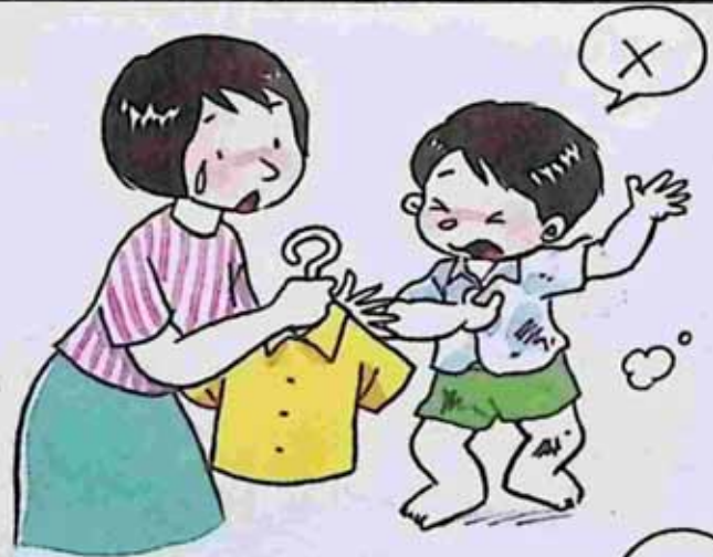
Dislike change into clean clothes သန့်ရှင်းသောအဝတ်အစားလဲရတာမကြိုက်သူ။