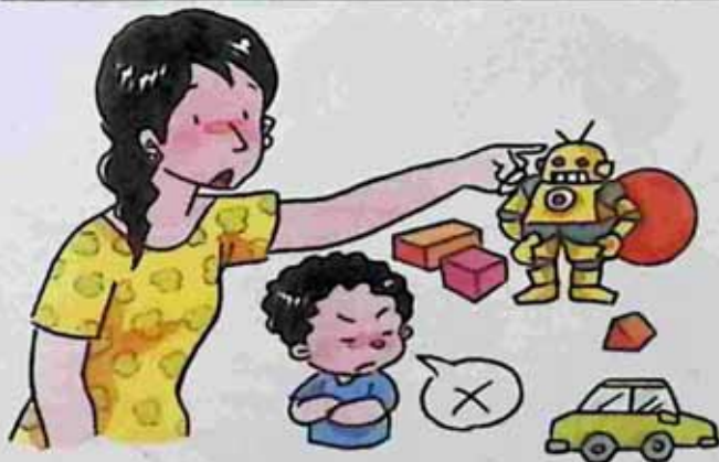
Leave the messy toys for others to keep ရုပ်ပွဲနေသော ကစားစရာများကို အခြားသူများသိမ်းရန် ချန်ထားသူ။