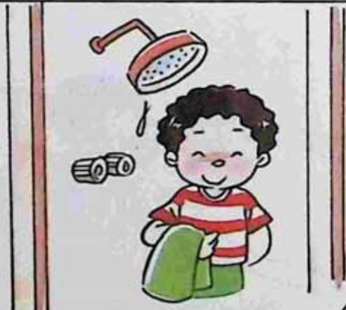
Change into clean clothes after ရေချိုးပြီးသန့်ရှင်းတဲ့ အဝတ်အစားလဲရတာကြိုက်သူ။