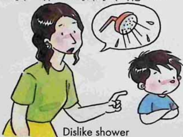
Dislike shower ရေမချိုးချင်သူ။

Who is doing right? Tick ✓ him/her. ဘယ်သူလုပ်တာမှန်ပါသလဲ ၊ သူ(သူ့)သူမကိုအမှန်ခြစ်ပေးပါ။