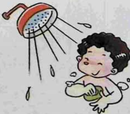
Like shower ရေချိုးရတာကြိုက်သူ။