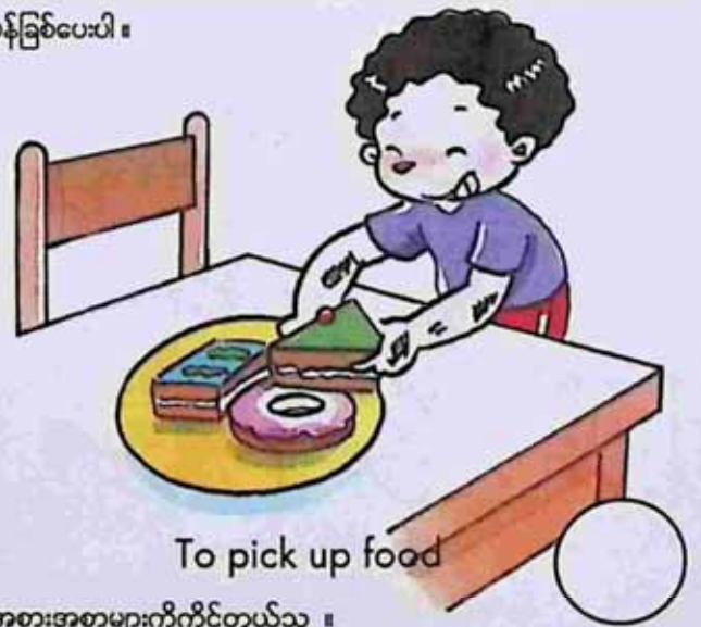
To pick up food