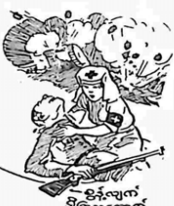
- ဝန်-လျက်-ဒါ-ဝါ-သောက

ဆီ-ဂွီး-မင်-ဒါ-ပေ-ပဲ-သိတ်-ဖြိုး-ဝမ်း-မ-ဒဲ-ဒဲ-ကျွန်-ကို-အင်-မ-တန်-ကြောက်-ကြောက်-တောင်-ခခုခု-လိ-ဖြိုး-ပွတ်-ဘူး-တီး-ကြား-တယ်-မ-ဖတ်-လား