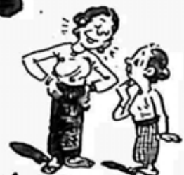
သုံး-ရက်-ရှိ-သော-ဒေါ်-စိန်-မိ-နား-က-ပဲ-ကို-ဆယ်-ရက်-ရှိ-သော-နား-က-ပဲ-ဖြင့်-ဒေါ်-ပွဲ-က-အနိုင်-ယူ-လိုက်-မယ်