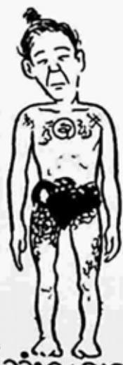
ကုန်သုံးခု၊ ချက်မပိုင်လျှင်