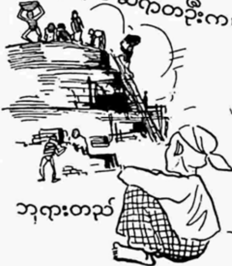
ဘုရားတည်