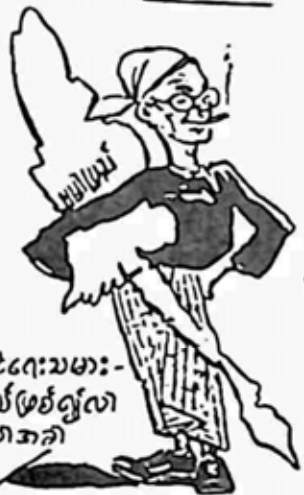
ဒိုင်-ခင်း-ပေး-သမား-လျှ-လယ်-ဖြစ်-လှ-လာ-သော-အခါ