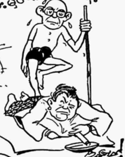
ခဲသည့်အမျိုး။