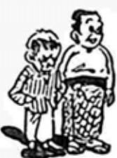
ကျွန်ုပ်-တို့-တလ-တထောင်-ကုန်-သွား-သော-ဒေါ်-ပဲ-အား-ကျွန်ုပ်-တို့-အပိုင်-ကုန်-သွား-ပု-ဒေါ်-ပဲ-က-အမြတ်-ပို-ကံ-မယ်