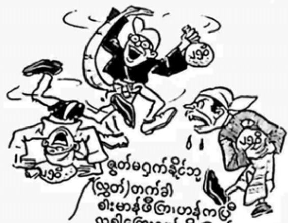
စွတ်-မဂ္ဂ-ကုန်-ခို-သော-လွတ်-တက်-ခါ-ခါး-မာန်-ဖိ-ကြား-ဟန်-က-ဖြင့်-လခါ-ကြေး-ဂုဏ်-လို့-ကြည်-အား-စွာ-အား-ယူ-ပေါ့

ဗမာ-ဒုက္ခ-အလို-အား-ဖြင့်-ပွား-ပို-ထွက်-ကို-သေ-ချာ-တို့-အား-အစ်-အတွေ့-တယ်-လယ်-သွား-တွေ့-ကို-သုံး-ပုဒ်-မ-ညှိုး-ဆဲ-နိုင်-အောင်-သေ-ချာ-ပြီး-တို-ဆေး-ထိုး-ပေး-ရမယ်