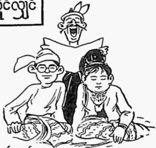
အိမ်ထောင်မဲ့