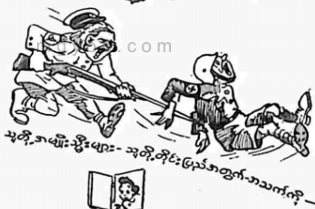
သုတို့-အမျိုး-မျိုးများ- သုတို့-တိုင်း-မြန်မာတွက်-အသက်ကို