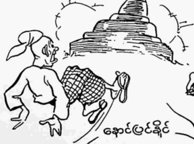
နောင်မြင်နိုင်