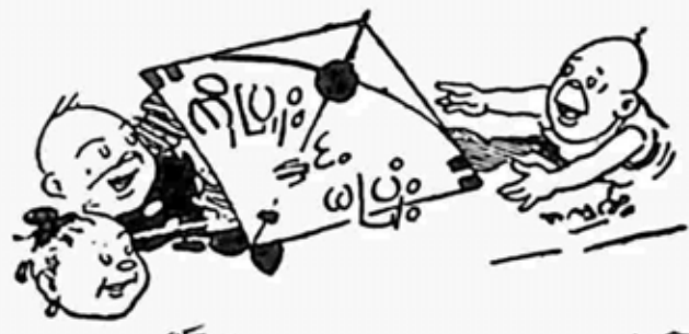
ကျွန်ုပ်-တိုင်း-မြန်မာ-ခါး-ခေါင်း-တင်-နိုင်-မယ်