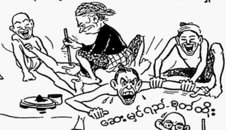
ဆေးမရှင်ရည်-ဓိတ်ထိုး