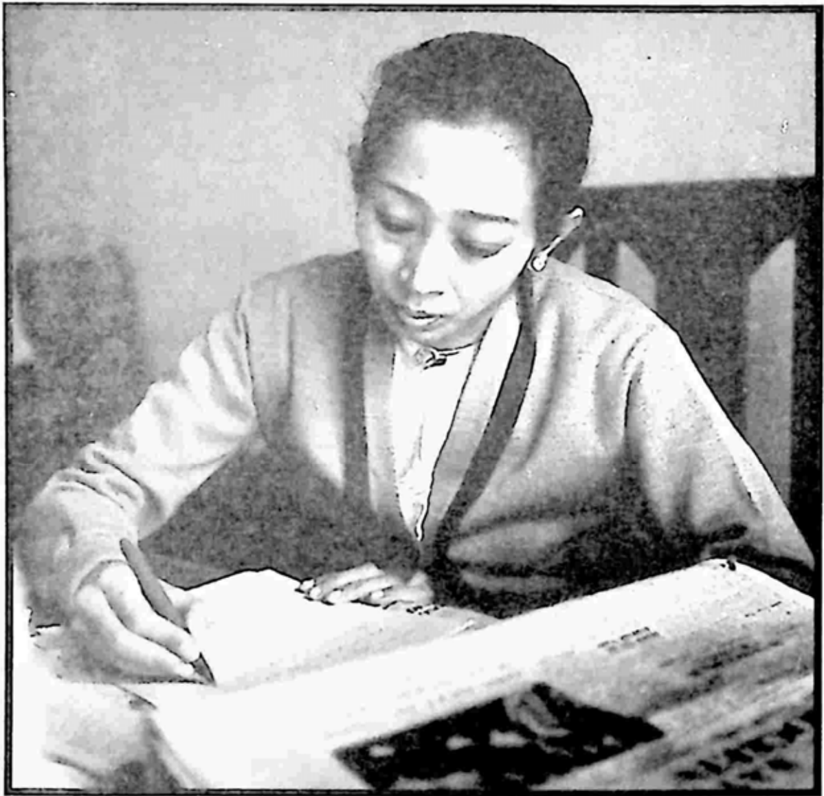
စာရေးဆရာမကြီး လူထုဒေါ်အမာ