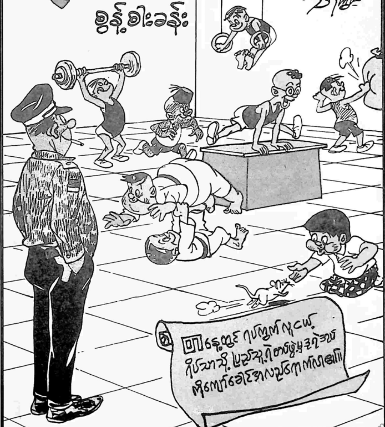
(မူလသတ်ပုံများအတိုင်းသာ ထားရှိပါသည်)