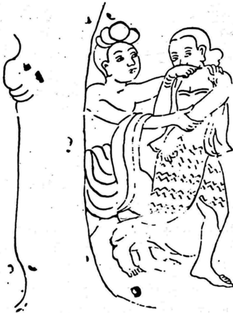
သစ်ပင်အောက်မှ စုံတွဲ (တောင်သမန်ကျောက်တော်ကြီးဘုရား တောင်ဘက်မှန်ရံပန်းချီမှ)