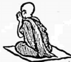
ရှင်ရာဟုလာ