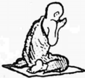
ရှင်သာရိပုတ္တရာ