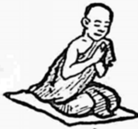
ရှင်ဥပါလီ