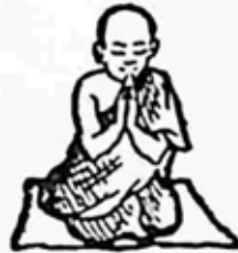
ရှင်အာနန္ဒာ