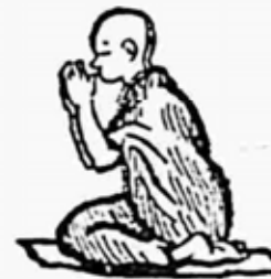
ရှင်မောဂ္ဂလာန်