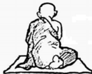
ရှင်ကောဏ္ဍည