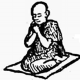
ရှင်ဂဝံပတိ