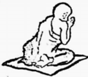
ရှင်ရေဝတ