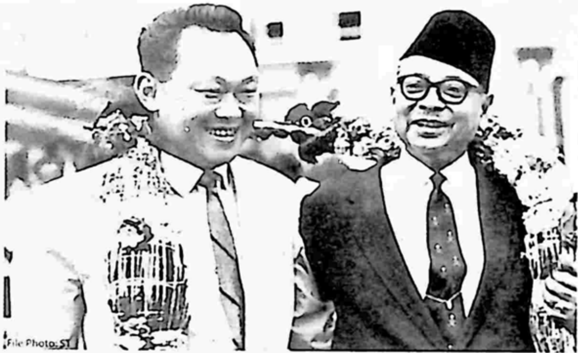
မလေးရှား ဝန်ကြီးချုပ် တန်ကူအက်ဘဒယ်ရာမန် (ယာ) နှင့် လီကွမ်ယုတို့ ၁၉၆၂၊ ကွာလာလမ်ပူ၌ တွေ့ဆုံစဉ်

ခဲ့ပြီးနောက် လီကွမ်ယုသည် အဖွဲ့ချုပ်ကို ဖွဲ့စည်းရန် စည်းရုံးရေး စတင် ခဲ့ပြီး၊ ကိုလိုနီအုပ်စိုးမှု ပျောက်သွားရန် ကြိုးစားလေသည်။