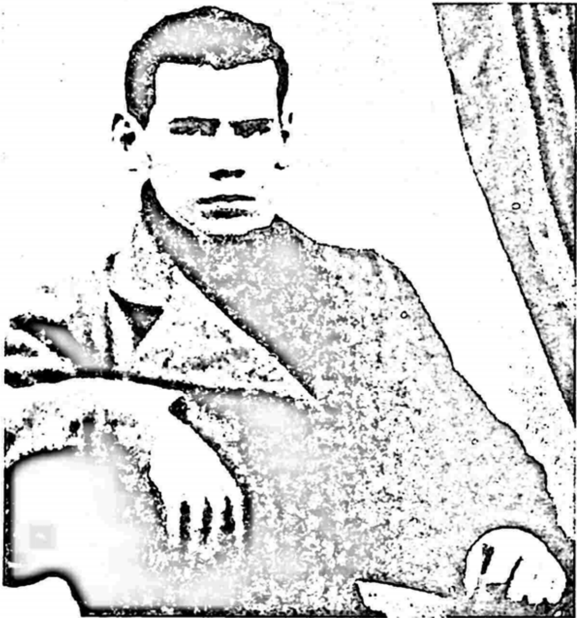
အသက် ၂၀ အရွယ် တော်လှန်တိုင်း (၁၈၄၈)

ဘဝကို အကြီးအကျယ်လွှမ်းမိုးခဲ့သည်။ လူငယ်ဘဝတွင် တော်လှန်တိုင်းသည် တိုင်းနက်ထံသို့ ထိမိလှသည့် စာများရေးခဲ့သည်။ မရဏဘေးနှင့် အဆက်မပြတ် ရင်ဆိုင်ခဲ့ရလင့်ကစား တော်လှန်တိုင်းသည် သူ၏ ကလေးဘဝကို စိတ်ချမ်းမြေ့ဖွယ် ကောင်းသည်ဟု ဖော်ပြလေ့