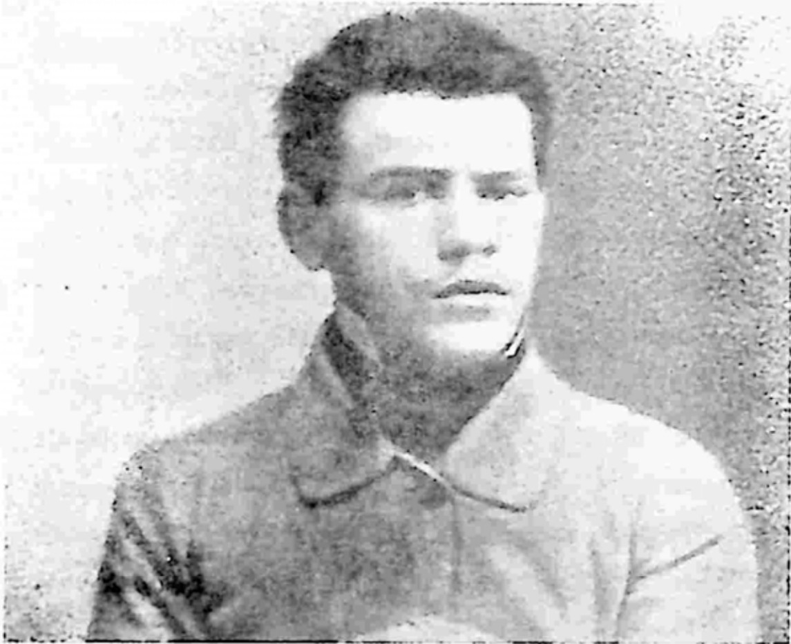
တော်လှန်ရေး ငယ်ဘဝ

ထံ သွားရောက် လည်ပတ်သူများသည် သူတို့ ထုတ်မပြောသော အတွေးများကို တော်လှန်ရေး နားလည်နေပုံရခြင်းကြောင့် အကြီးအကျယ် ကသိကအောက်ဖြစ်ရသည်ဟု ဆိုကြသည်။ ဘုရားသခင်လိုမျိုး သူ၏ စွမ်းအားများ၊ လူသားတို့၏ ကန့်သတ်ချက်များကို လွန်မြောက်ရန် သူ၏ ကြိုးပမ်းမှုများမှာ နေရာတကာတွင် ပြောစရာဖြစ်နေသည်။ တချို့က တော်လှန်ရေးကို သဘာဝနှင့် သန့်ရှင်းသော အသက်ဝင်မှုတို့၏ ပြယုဂ်ဟုလည်းကောင်း၊ အခြားသူများကမူ သူ့ကို လောက၏ အသိတရား သို့မဟုတ် လိပ်ပြာ ပြန်ဝင်စားခြင်းဟုလည်းကောင်း ပြောဆိုကြသော်လည်း သူ့အကြောင်း သိသူ အားလုံးလောက်