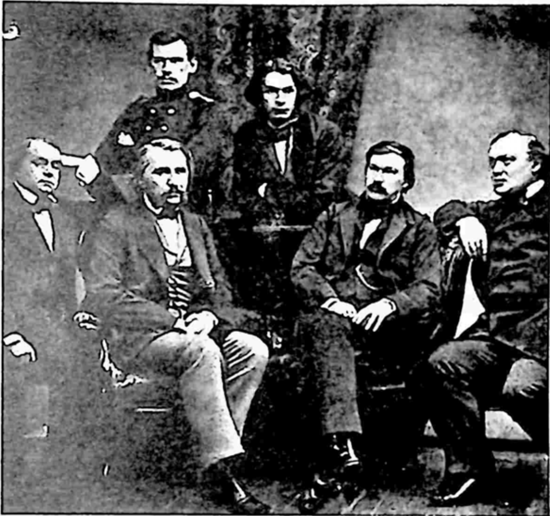
၁၈၅၆ ခုနှစ်တွင် စာရေးဆရာများနဲ့အတူ တော်လီစတိုင်း (မတ်တတ်ရပ်လျက် ဘယ်အစွန်) အား တွေ့မြင်ရပုံ

ထို့ကြောင့် သူသည် နေ့စဉ်မှတ်တမ်းမှ စာများကို ပြန်လည်ချရေးခဲ့ သော စာရေးဆရာတစ်ဦးဖြစ်သည်။