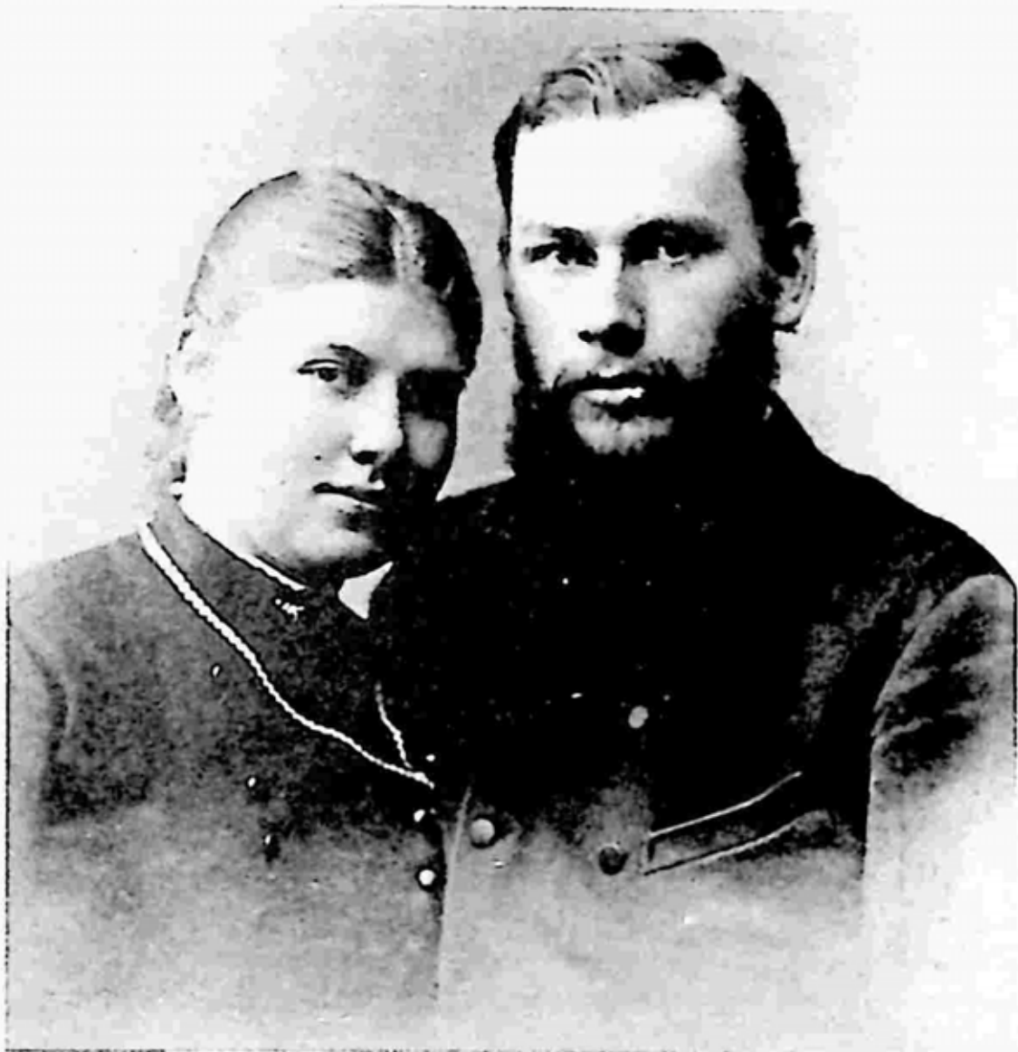
ဇနီး ဆိုဖီယာအန်ဒရီဗဲ. တော်လ်စတိုင်း

၁၈၆၃ တွင် ရေးသားခဲ့ပြီး ၁၈၈၆ တွင် ပြန်လည်တည်းဖြတ် ထုတ်ဝေခဲ့သော ခိုလ်စတိုမာ (မြင်းတစ်ကောင်၏ ဇာတ်လမ်း) သည် လူကြိုက်များလှသော တော်လ်စတိုင်း၏လှည့်ကွက်ကြောင့် နာမည်ကြီးလာခဲ့သည်။ တော်လ်စတိုင်း၏လှည့်ကွက် ဆိုသည်မှာ လူတို့နှင့်