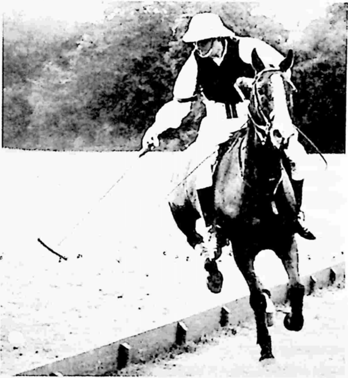
ဝင်စတန်ချာချီ၏ ပိုလိုကစားဟန်

မကြာခင်ချာချီသည် သူ့အားငယ်ငယ်ကတည်းက ပြုစု စောင့်ရှောက်ခဲ့သော အထိန်းတော်ကြီး မစွမ်းအဲဗားရက်သည် သေလု မြောပါးဖြစ်နေပြီဆိုသော သတင်းကိုကြားရလေသည်။ ထို့ကြောင့် ချာချီ သည် အင်္ဂလန်ပြန်လာခဲ့သည်။ ချာချီသည် အဲဗားရက်နှင့် သီတင်း