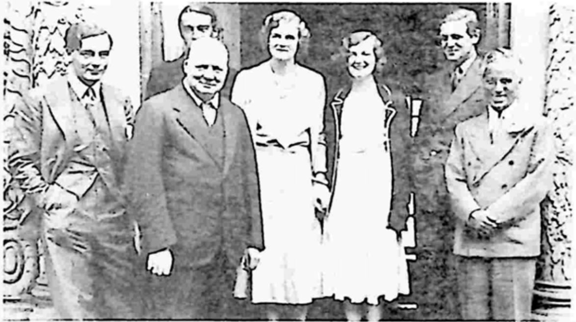
ဝင်စတန်ချာချီနှင့် သူ၏မိသားစု

၁၉၀၈ စက်တင်ဘာလ ၁၂ ရက်နေ့တွင် သူသည် ကလီမန်တိုင်းကို ဝက်မင်စတာရှိ စိန့်မာဂရက်ဘုရားကျောင်းတွင် လက်ထပ်ခဲ့သည်။ မင်္ဂလာပွဲကျင်းပရာခန်းမထဲတွင် လူများပြည့်ကျပ်နေခဲ့သည်။ သင်းအုပ်ဆရာတော် စိန့်အေဆပ်က သူတို့ကို လက်ဆက်ပေးခဲ့သည်။ ပူပူနွေးနွေး ဇနီးမောင်နှံမှာ အိမ်ကုတ်ရှိ ဟိုင်းဂရိစ်အိမ်တော်ကို ပျားရည်ဆမ်းခရီးထွက်ခဲ့သည်။ ၁၉၀၉ ခုနှစ် မတ်လထဲတွင် သူတို့ဇနီးမောင်နှံသည် အယ်ကော်စတွန်စက္ကွယားရှိအိမ်ကို ပြောင်းခဲ့ကြသည်။