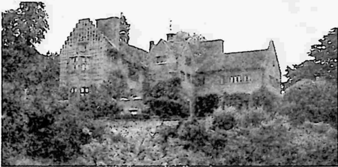
ချာချီတို့ပိသားစု နေထိုင်ခဲ့သည့် ချက်ဖဲလ်နေအိမ်

ပထမကမ္ဘာစစ်တပ်ပြီးဆုံးသွားပြီးနောက် ၄ ရက်တင်းတင်းပြည့် သောနေ့တွင် ကလီမန်တိုင်းသည် စတုတ္ထမြောက်ကလေးကို မွေးသည်။ စတုတ္ထမြောက်ကလေး မာရီဂိုးလ်ဖရန်ဆစ်ချာချီကို ၁၉၁၈ ခုနှစ် နိုဝင်ဘာ ၁၅ ရက်နေ့တွင် မွေးခဲ့ခြင်းဖြစ်သည်။ ၁၉၂၁ ခုနှစ် သြဂုတ်လ၏ လဆန်း ရက်များတွင် ချာချီ၏ သားသမီးအားလုံးကို ကန့်မြို့ရှိပြင်သစ်နေ့ကလေး ထိန်းကျောင်းတွင်ထားခဲ့သည်။ ၁၉၂၂ ခုနှစ် စက်တင်ဘာလ ၁၅ ရက်နေ့တွင် ချာချီ၏ နောက်ဆုံးကလေးဖြစ်သော မယ်ရီကိုမွေးသည်။ ထိုလကုန်ပိုင်းတွင် ချာချီသည် ချက်ဖဲလ်အိမ်ကို ဝယ်သည်။ ချာချီ ကွယ်လွန်သည့် ၁၉၆၅ ခုနှစ်အထိ ချက်ဖဲလ်အိမ်တွင် သူတို့နေထိုင်ခဲ့ ကြသည်။