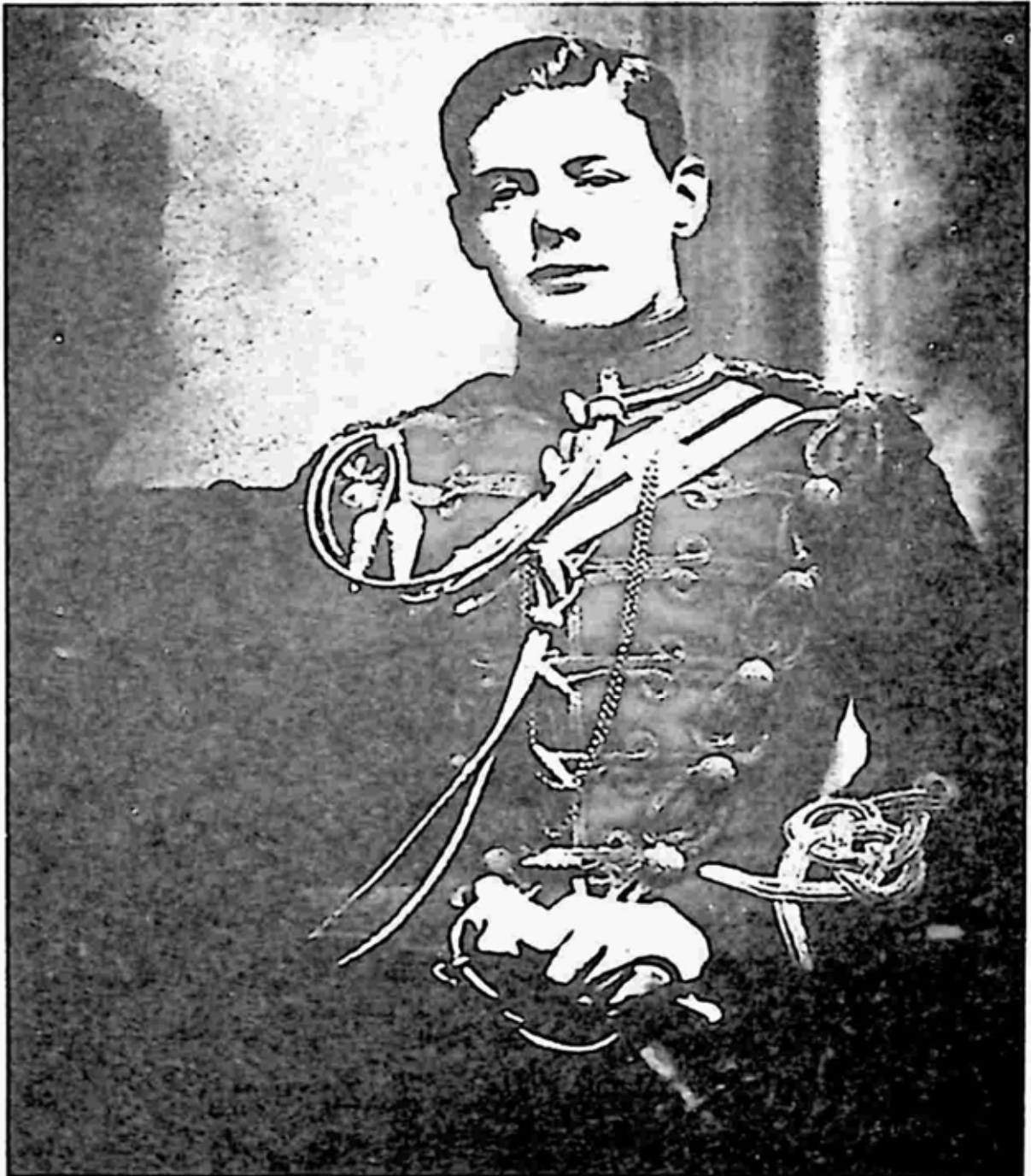
စစ်ဝတ်စုံနှင့်အတူတွေ့ရသည့် ချာချီ (၁၈၉၅)

ချာချီအတွက် အမြဲလောက်ငှသည်ဟူ၍ မရှိခဲ့ပေ။ ထို့ကြောင့် သူ့အတ္ထုပ္ပတ္တိကို ရေးသူ ရိုင်းဂျင်ကင်းက ချာချီသည် စစ်သတင်းထောက်အလုပ်ကို စိတ်ဝင်စားခဲ့ခြင်းဖြစ်သည်ဟု ဆိုသည်။ သူသည် စစ်ထဲတွင်