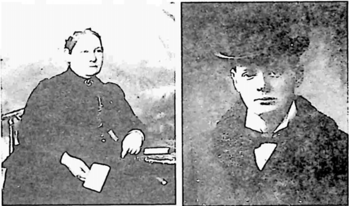
အထိန်းတော် အဲလီဇဘတ်အန်းအဲဗားရက်နှင့် ချာချီ

အကွရာများကို အသံထွက်ရခက်ခဲသည့် Lateral Lisp သမားဖြစ်ကြောင်း အသံ သွင်းယူထားသည်များကို ပြန်လည်နားထောင်ကြည့်နိုင်သည်ဟု ချာချီ ဌာနနှင့် ပြတိုက်ဌာနက ဆိုသည်။ ထို့ကြောင့် ဝင်စတန်ချာချီသည် စကားထစ်သူဆိုသည်မှာ ဒဏ္ဍာရီတစ်ပုဒ်ဖြစ်သွားသည်။