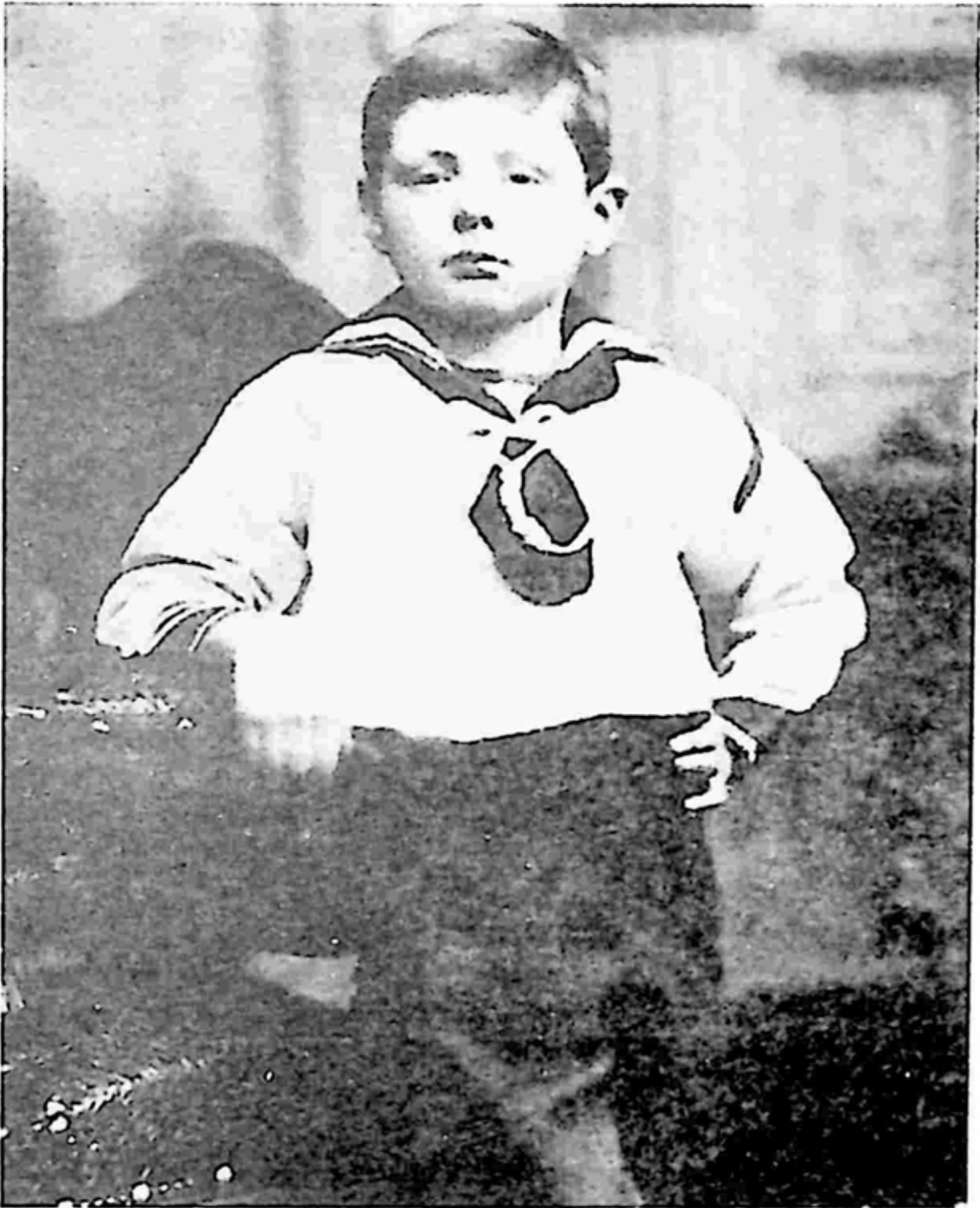
အသက် ၇ နှစ်အရွယ် ချာချီ (၁၈၈၁)

သောကြောင့် ဝင်စတန်ချာချီသည် အထက်တန်းကျောင်းကို မတက်ခဲ့ ဖူးသော်လည်း သူသည် အင်္ဂလိပ်ဘာသာစကားကို မြတ်နိုးသူဖြစ်နေပြီ