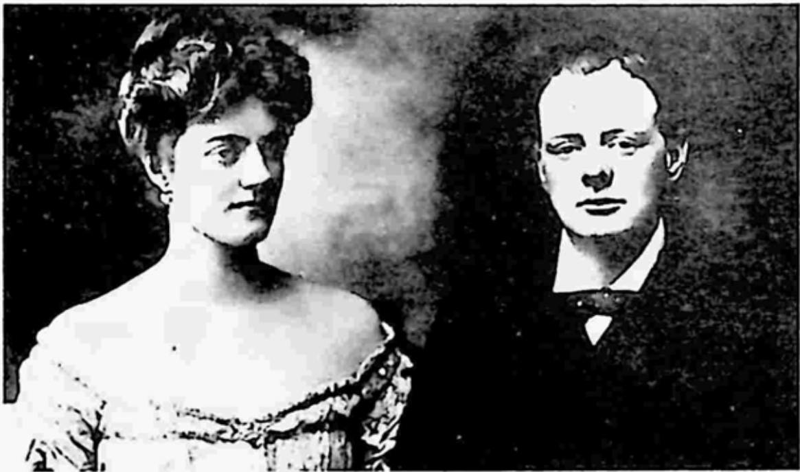
ဇနီး ကလီမန်တိုင်းနှင့် ဝင်စတန်ချာချီ

ချာချီသည် ၁၉၀၄ ခုနှစ်တွင် ဇနီးလောင်း ကလီမန်တိုင်းဟိုဇီယာ ကို ခရူးမျူးမတ်၏ အိမ်တော်ဖြစ်သော ခရူးအိမ်တွင် တွေ့ခဲ့ခြင်း ဖြစ်သည်။ ၁၉၀၈ တွင် သူတို့သည် လန်ဒန်မြို့တော်ကောင်စီဝင်၏ ကတော် စိန်ဟယ်လီယာတည်ခင်းသော ညစာစားပွဲတွင် ထပ်မံတွေ့ဆုံခဲ့ကြ သည်။ ၎င်းပါတီပွဲတွင် ချာချီသည် ကလီမန်တိုင်းနှင့် ဘေးချင်းကပ် ထိုင်ခဲ့၏။ မကြာခင် သူတို့သည် တစ်ဘဝလုံးစာ ချစ်ကြိုသွယ်မိခဲ့ကြ တော့သည်။ ၁၉၀၈ ခုနှစ် ဩဂုတ် ၁၀ ရက်နေ့တွင် ချာချီသည် ကလီမန် တိုင်းကို လက်ထပ်ခွင့်တောင်းသည်။