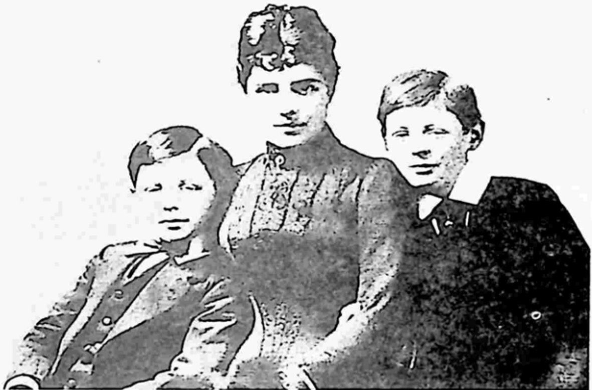
ငယ်ဘဝ ဝင်စတန်ချာချီ (ဝဲ) အား မိခင် လေဒီရန်ဒေါ့ချာချီနှင့် အတူတွေ့ရစဉ်

ချာချီ၏မိခင် လေဒီရန်ဒေါ့ချာချီသည် အမေရိကန် ဘီလျံနာ လီယုနတ်ဂျရမ်း၏သမီးဖြစ်သည်။ သူတို့သည် ဘလန်ဟိန်း နန်းတော်ရှိ အိပ်ဆောင်တွင် ချာချီအား နှစ်လစော၍ မွေးခဲ့သည်ဟု ဆိုသည်။