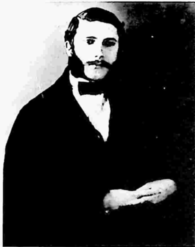
ပရဟိတသမား ဟင်နရီဒူးနန်. ငယ်ဘဝ (၁၈၅၅)

သားဦးဖြစ်သည်။ သူ၏မိသားစုမှာ ကယ်ဗင်ဝါဒီများဖြစ်သည်။ ဂျန် ကယ်ဗင်နှင့် အခြားသော ပြုပြင်ပြောင်းလဲရေးခေတ်က ဘာသာဗေဒ ပညာရှင်များ၏ ခရစ်ယာန်ကိုးကွယ်မှု ပုံစံတစ်မျိုးဖြစ်၍ ၎င်းဝါဒမှာ ပရိတ်တက်စတင့် အဓိကဂိုဏ်းခွဲတစ်ခုဖြစ်သည်။ ခရစ်ယာန်ဘာသာ ကိုးကွယ်ရာတွင် ပြုပြင်ပြောင်းလဲထားသော ကိုးကွယ်မှုပုံစံကို ဖန်တီးခဲ့သည့် ဂျန်ကယ်ဗင်၏ အယူဝါဒကို လိုက်နာသူများအား ကယ်ဗင်ဝါဒီများဟု ခေါ်သည်။ ထို့ကြောင့် ဒူးနန်၏မိသားစုဝင်များသည် ကယ်ဗင်ဝါဒကို သက်ဝင်ယုံကြည်သော ကယ်ဗင်ဝါဒီများဖြစ်လေသည်။