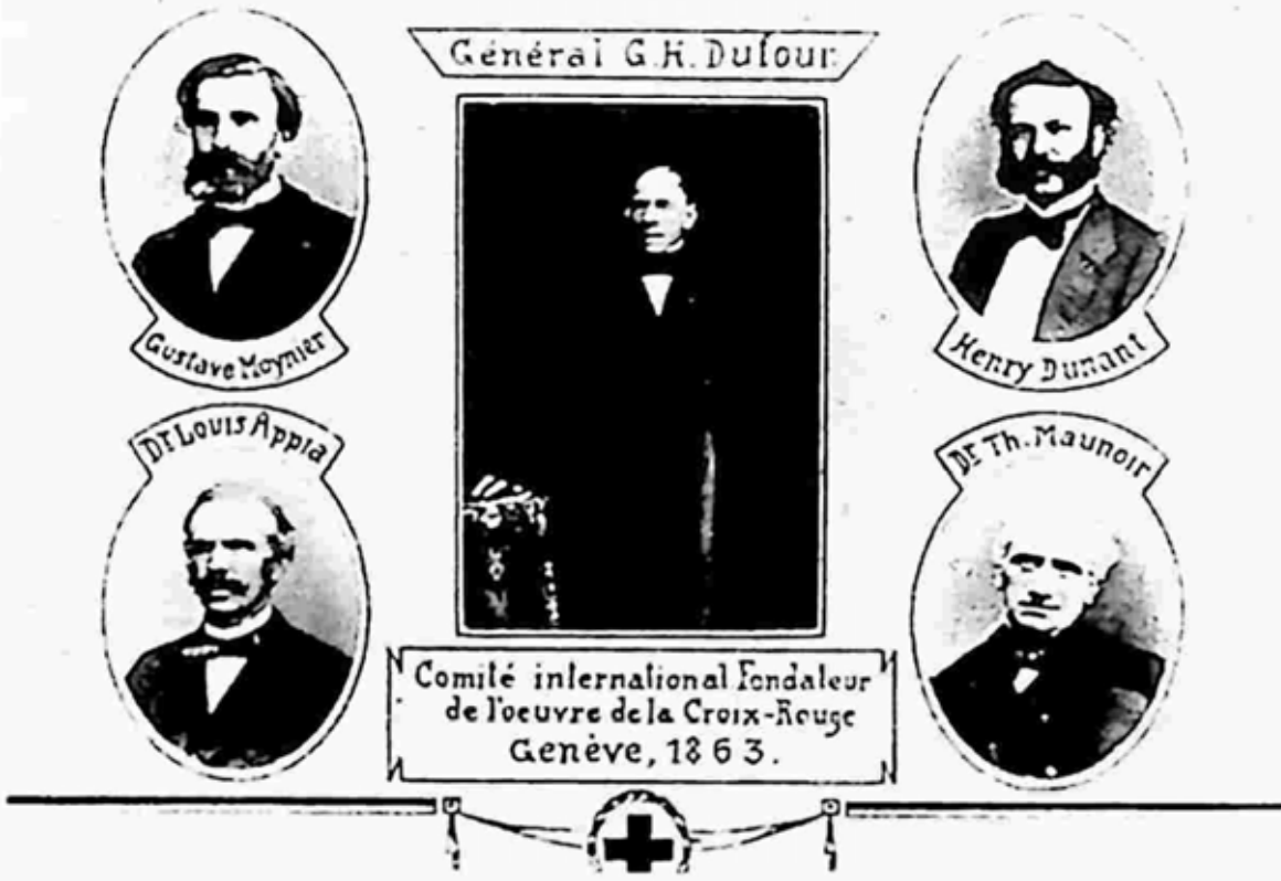
ဟင်နရီဒူးနန်းပါဝင်သည့် မိုင်ခံတကာကြက်ခြေနီ ငါးဦးကော်မတီ

ဤသို့သော အခင်းအကျင်းတွင် ဒဏ်ရာရထားသော စစ်သားများကို ပြုစုဆောင်ရွက်မှုတိုးတက်ကောင်းမွန်စေရန် ၅ ဦးကော်မတီက