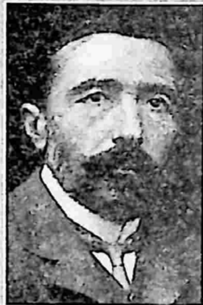
ကွန်းရတ် [ Conrad ]