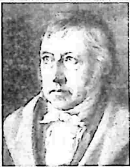
အိမ့်နူယံကန့်