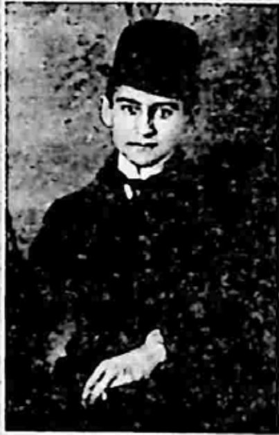
ကပ်ဗကာ [ Kafka ]

ဒါ နာမည်လောက် စာရင်းတို့ကြည့်တာပါ။ ဘယ်လောက်များသလဲ။ ရှုပ်ထွေးသလဲဆိုတာ သိသာ ပါတယ်။