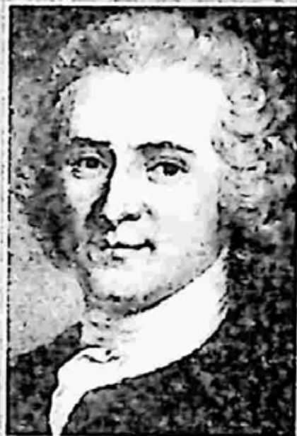
ဗော့ဗဲယား