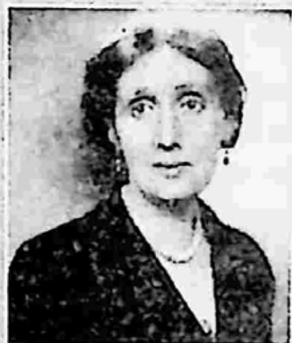
ဝုင် [ Woolf ]

[ ဖော်ဒန်အနုပညာလောကတွင် ထင်ရှားခဲ့သော ဝတ္ထုရေးဆရာများ ]