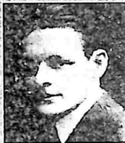
အက်ဇရာပေါင်း [Pound]