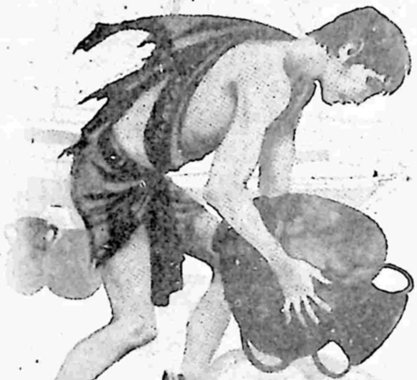
ကံကောင်းသူ ကုန်သည်လေး (ဘာမိုး)