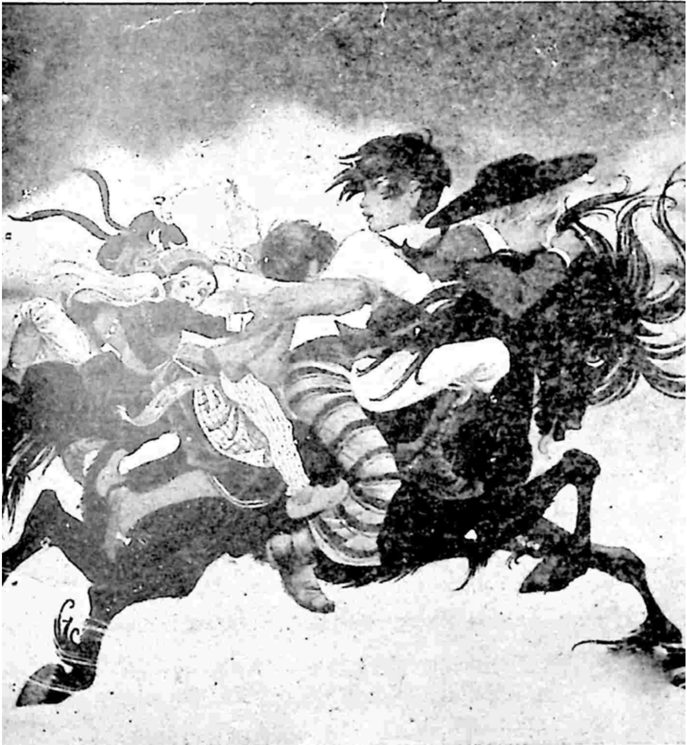
နတ်မြင်းပျံ (ပြင်သစ်)