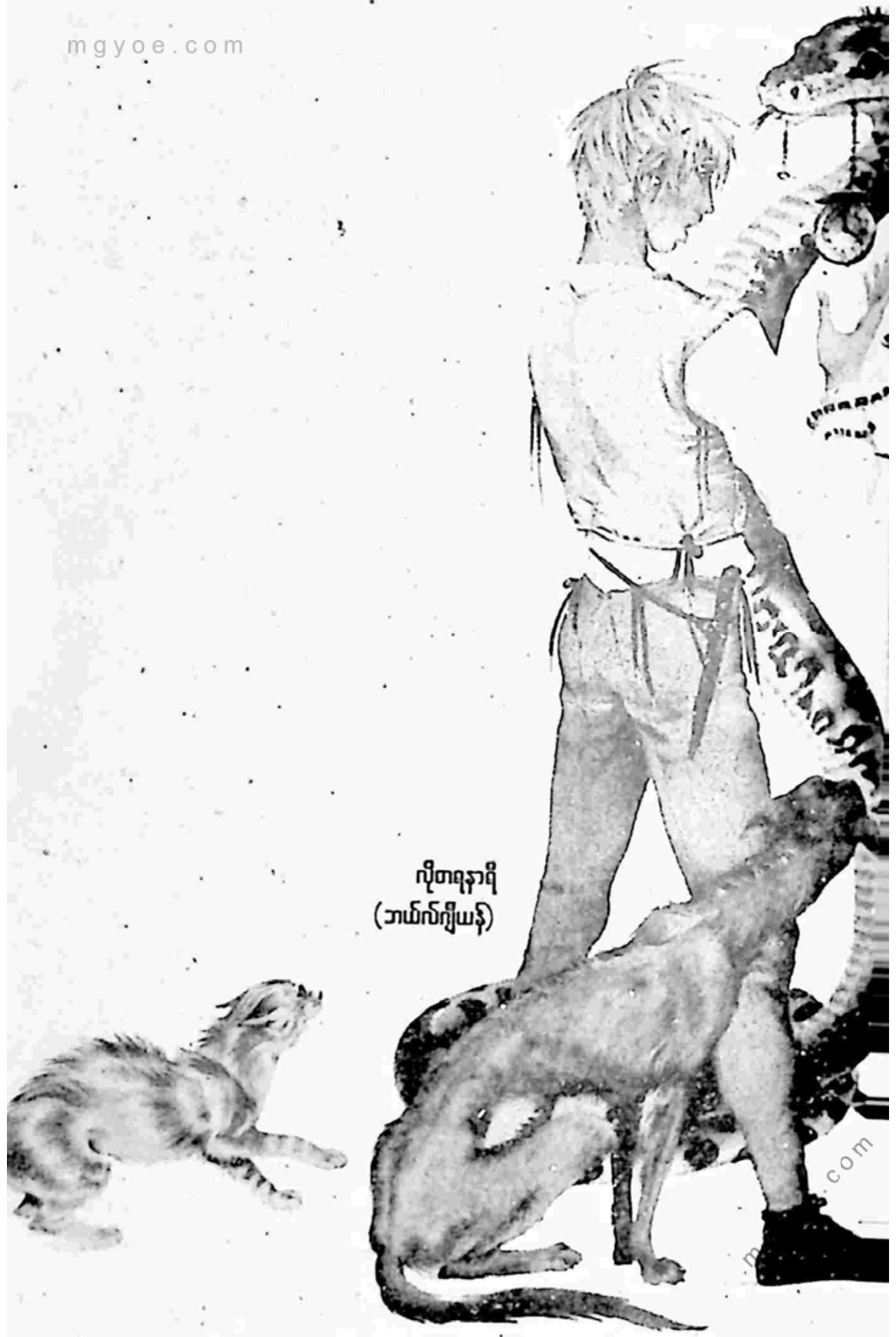
လှိုင်စာရနာဂီ (ဘယ်လ်ကျီယနီ)