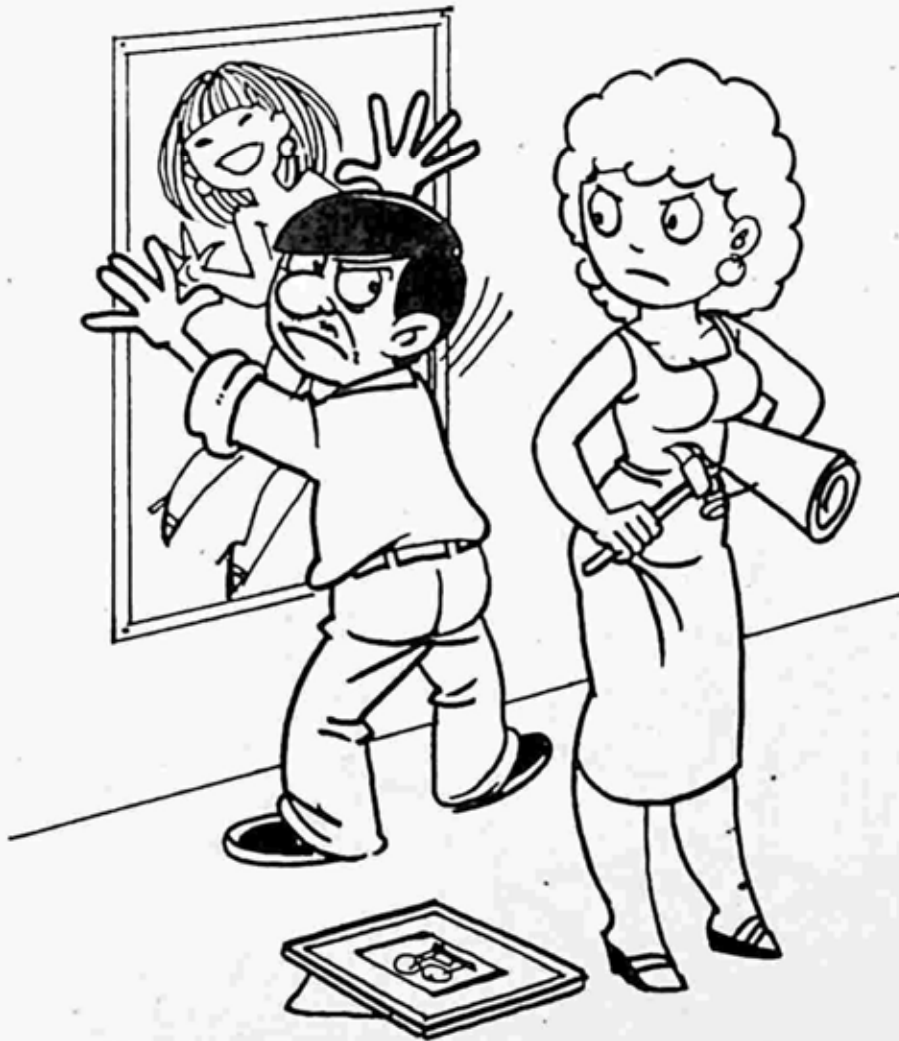
စိတ်ကူးချိုချို

၃၁။ အိပ်ခန်းထဲက မိန်းကလေး မော်ဒယ်တစ်ယောက်ရဲ့ ပိုစတာကိုတော့ မဖြုတ်ပါရစေနဲ့လို့ သူမကို ပြောပါ။