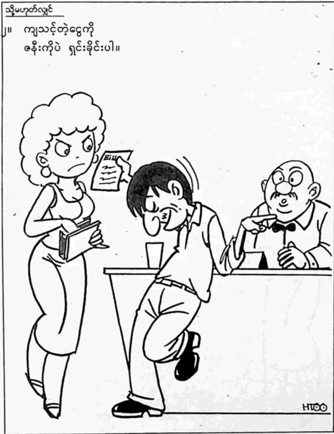
စိတ်ကူးချီချီ

၁။ သင့်ဇနီးကို စိတ်ကူးယဉ်စရာကောင်းတဲ့ ဖယောင်းတိုင်တွေ ထွန်းထားတဲ့ ညစာ စားပွဲတစ်ခုကို ခေါ်သွားပါ။