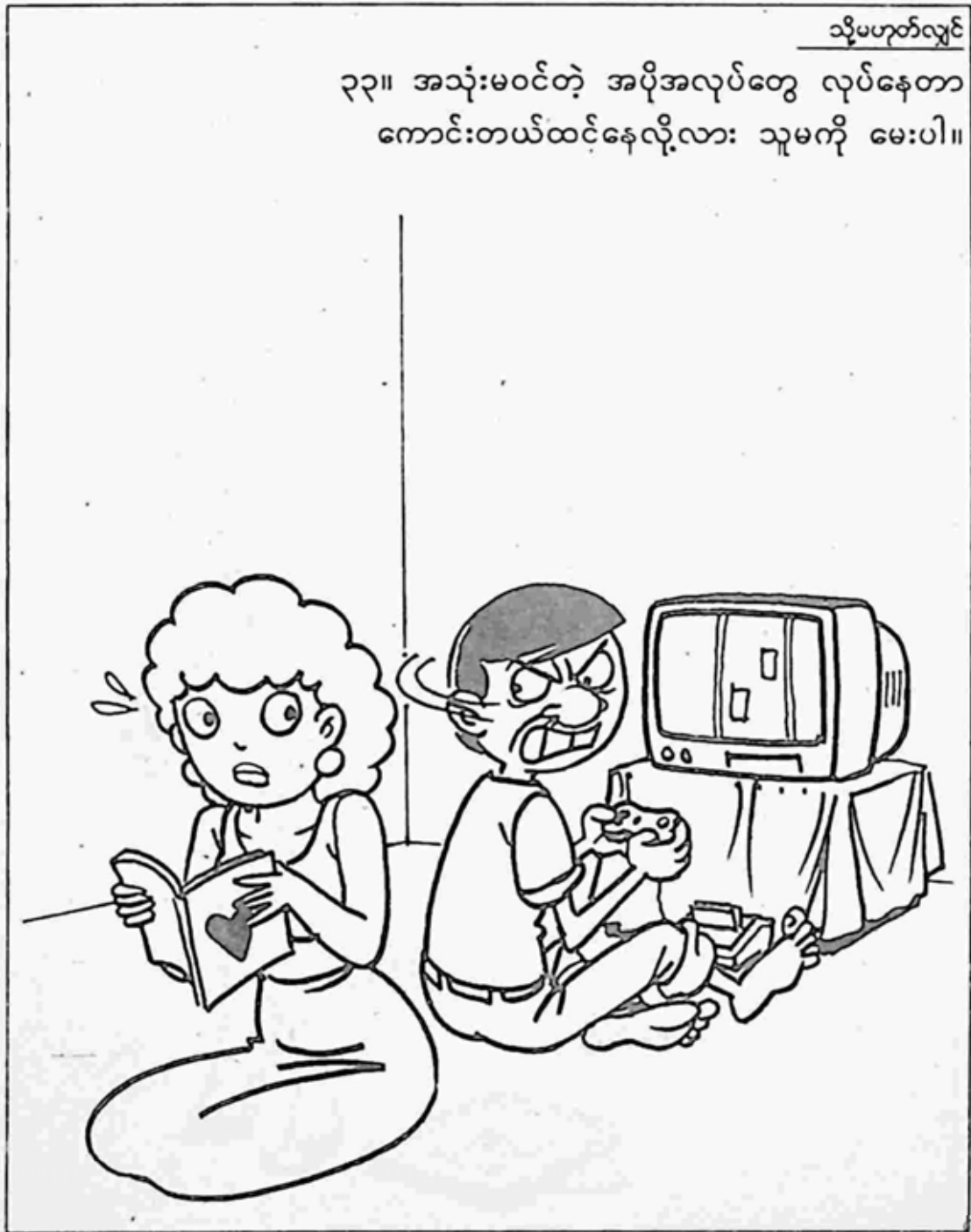
စိတ်ကူးချီချီ

၃၃။ အသုံးမဝင်တဲ့ အပိုအလုပ်တွေ လုပ်နေတာ ကောင်းတယ်ထင်နေလို့လား သူမကို မေးပါ။