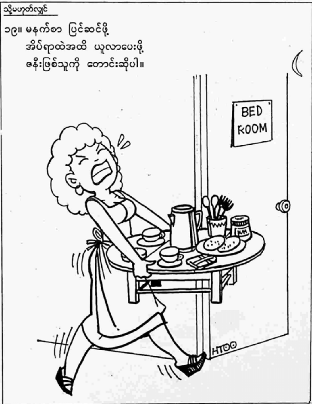
ဝိတ်ကူးချီချီ

၁၉။ မနက်စာ ပြင်ဆင်ဖို့ အိပ်ရာထဲအထိ ယူလာပေးဖို့ ဇနီးဖြစ်သူကို တောင်းဆိုပါ။