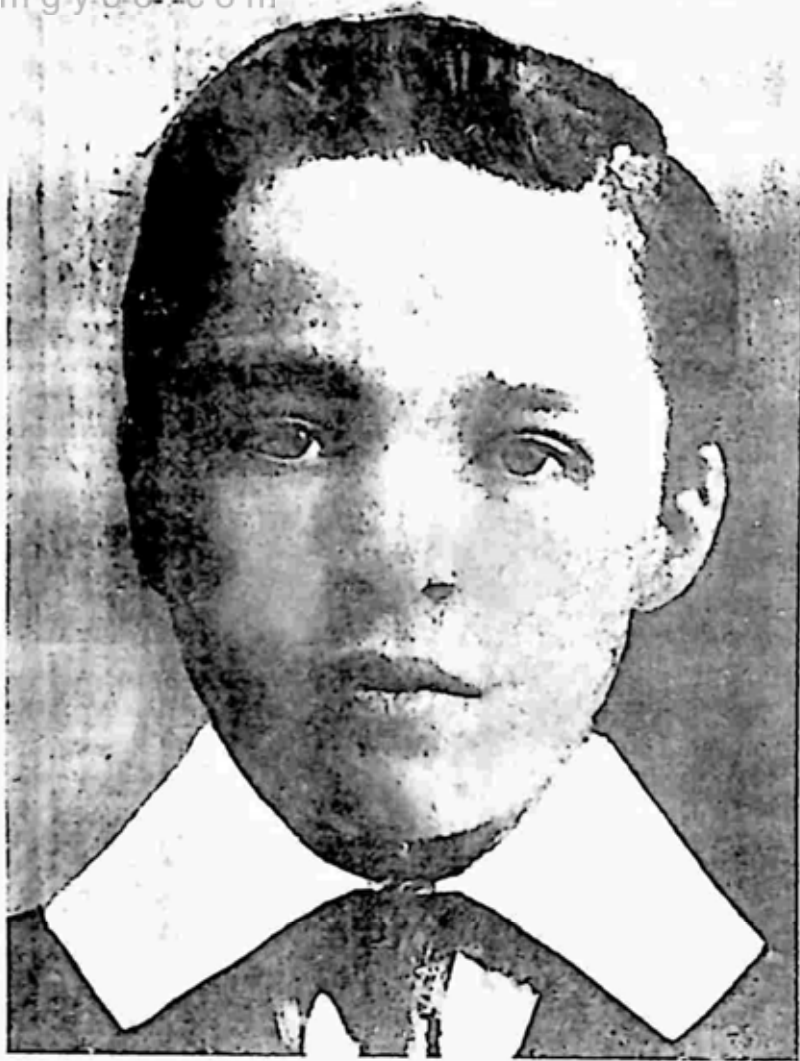
၁၂ နှစ်သား ချက်ပလင်ပုံ ဖြစ်သည်။ ၁၉၀၁ ခုနှစ် က စိုက်ကူးထားခြင်း ဖြစ်ပြီး ထိုနှစ်၌ပင် သူ့ ဖခင်ချာလီ ချက်ပလင် (အကြီး)ကွယ်လွန်သွား လေသည်။

ချားလ်စပင်ဆာချက်ပလင်မှာ သူ့ဖခင်နာမည်မှ ဆင်းသက်လာခဲ့ခြင်း ဖြစ်သည်။ ဖခင်ကား ချားလ်ချက်ပလင်စီနီယာ ဖြစ်သည်။ သူ့အဖေ၏ အဖေ၊ သူ့အဘိုးမှာလည်း ချက်ပ လင်ပင် ဖြစ်သည်။ ထိုချက်ပလင်မျိုးဆက် ချားလ်ချက်ပလင်ကို ၁၈၈၉ ခုနှစ်၊ ဧပြီလ ၁၆ ရက် အင်္ဂါနေ့တွင် ဖွားသန့်စင်ခဲ့ပေသည်။ သူ့အဖေမှာ ဂီတပွဲတွင် ဖျော်ဖြေသူတစ်ဦး ဖြစ်သည်။ သူ၏တစ်နှစ်သား နှစ်နှစ်သား မွေးကင်းပြီး ကလေးဘဝများမှာ ထူးထူးခြားခြား ပြော စရာမရှိလှပေ။ သူ့ပတ်ဝန်းကျင်မှာလည်း အလုပ်သမား လူတန်းစားပတ်ဝန်းကျင်ဖြစ်သည်။ ထိုပတ်ဝန်းကျင်သည် အိပ်မက်ဆိုးထဲ ရှင်သန်နေရသောဘဝမျိုးဖြစ်၏။ လုံခြုံမှုကင်းမဲ့ခြင်း၊ ဆင်းရဲချို့တဲ့ခြင်း၊ ပင်ပန်းကြီးစွာ ရုန်းကန်ခြင်းတို့ဖြင့် ဝိုင်းရံနေသည်။ ထိုကဲ့သို့ ဝန်းကျင်မျိုးမှ နေ ဖျော်ဖြေရေးကမ္ဘာလောကထဲသို့ ချားလ်ချက်ပလင်ဆိုသူတစ်ယောက်က ရှင်သန်ထိုးထွက် လာခဲ့သည်။