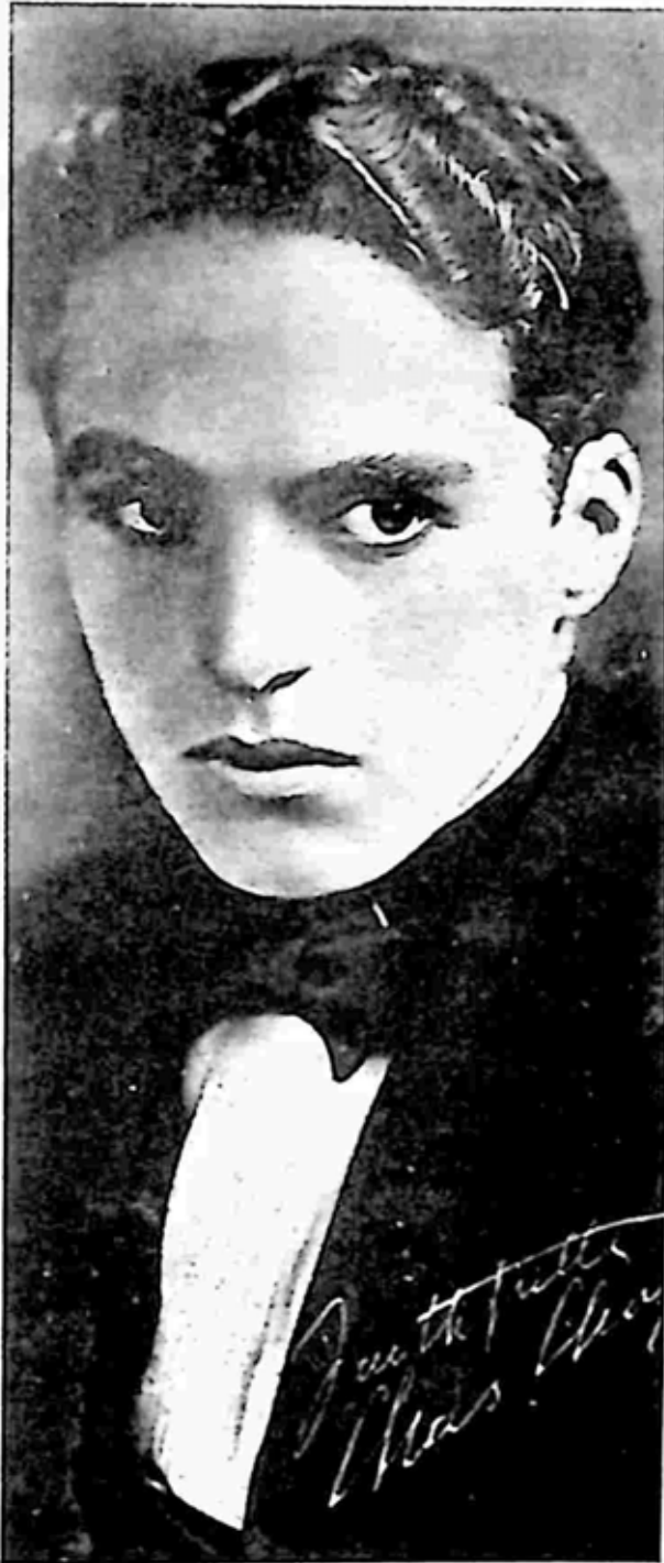
ဟောလီးဝုဒ်တွင် အစောပိုင်း နေထိုင်စဉ်က ခပ်ရိုးရိုး ချက်ပလင်ကိုတွေ့ရသည်။ ပြဇာတ်တွင် ဒေါက်တာဘိုအဖြစ် ချာလီ သရုပ်ဆောင်ခဲ့စဉ်