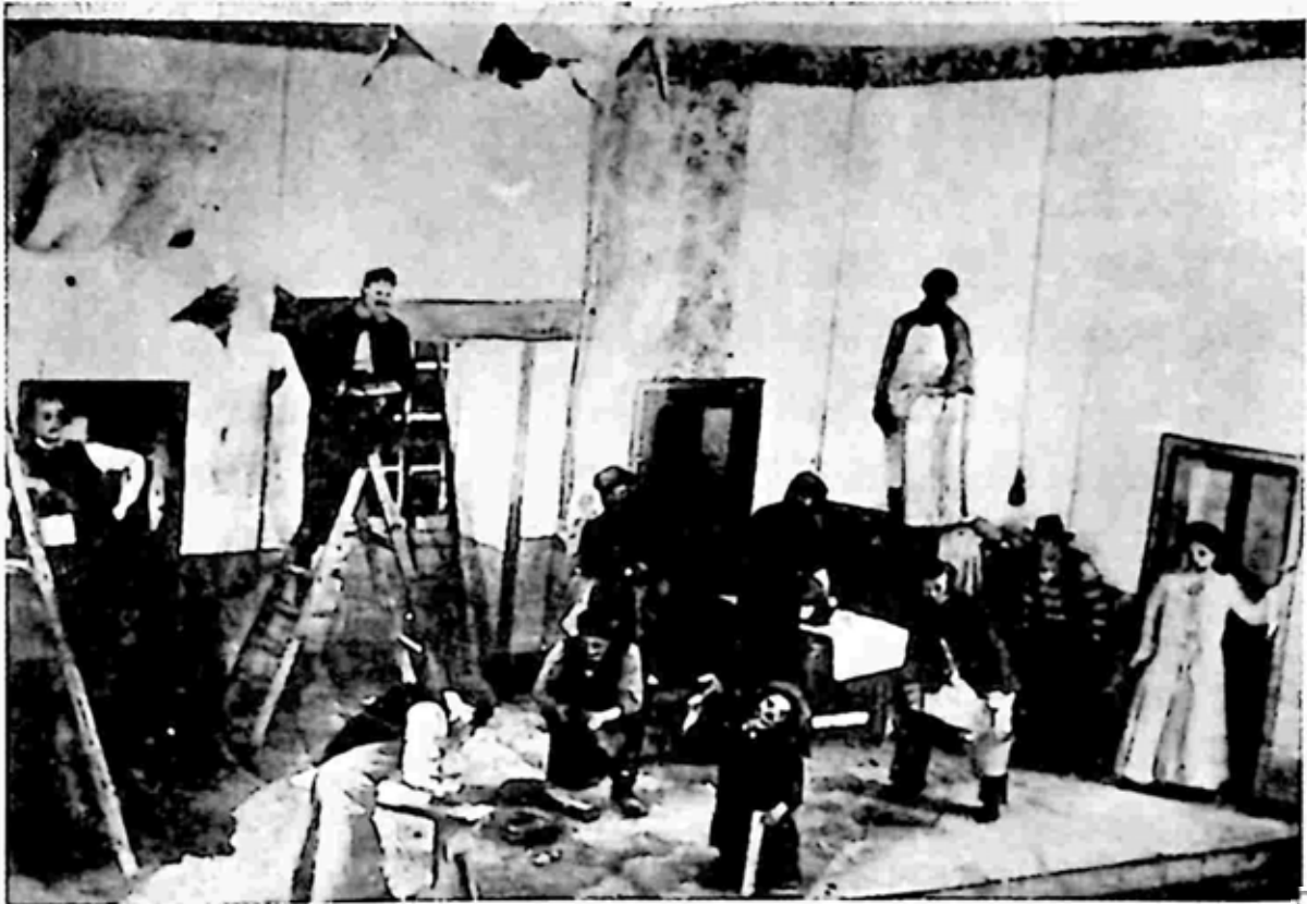
၁၉၁၅ ခုနှစ်က ပြင်ဆင်သူများ Repairs ရုပ်ရှင်ကား ၏ ရှားပါးဓာတ်ပုံဖြစ်သည်။

ထိုအချိန်တွင် ဆစ်ဒနီမှာ သူ့ညီလောက် အောင်မြင်မှုမရရှာပေ။ အချိန်ကြာမြင့်စွာ ကတည်းက သူဖြစ်ချင်ခဲ့သော ရုပ်ရှင်မင်းသားမျှော်မှန်းချက်မှာလည်း မဖြစ်ထွန်းခဲ့ချေ။ အရက်ဆိုင်တစ်ဆိုင်၏ ဘားကောင်တာတွင် အရက်ငှဲ့ပေးသူအဖြစ် အလုပ်လုပ်သည်။ ရှား လော့ဟုမ်းပြဇာတ်တွင် နိုင်ငံခြားမြို့စားကြီးဗန်စတာလ်ဘာ့ဂ်အဖြစ်၊ ၁၉၀၃ ခုနှစ်အကုန်က သရုပ်ဆောင်ခဲ့သည်။ ချာလီအောင်မြင်လာသည့်အခါ ဆစ်ဒနီကို မန်နေဂျာအဖြစ်ဆောင် ရွက်ရန် ငှားရမ်းခဲ့သဖြင့် ညီအစ်ကိုနှစ်ယောက် ပြန်လည်ပေါင်းစည်းနိုင်ခဲ့သည်။ နယ်လှည့်