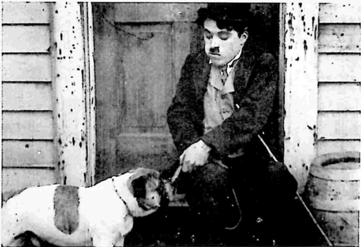
Essanay ရုပ်ရှင်မှ ၁၉၁၅ ခုနှစ်တွင် ပြသသော The Champion ရုပ်ရှင်ကားတွင် ချာလီ သရုပ်ဆောင်ပုံ။ ဝက်အူချောင်းကို ခွေးနှင့်မျှတားနေပုံဖြစ်သည်။

ငယ်ရွယ်သော ချက်ပလင်လေးသည် ကိုနင်ဒိုင်း၏ ထင်ရှားသော ဂန္ထဝင်ဇာတ်လမ်း ကို ၃ နှစ်ကျော်ကျော် အကောင်းဆုံးသရုပ်ဆောင်ခဲ့သည်။ နောက်ဆုံး ထိုဇာတ်လမ်းကို သူနားလိုက်သည်။ ထိုအချိန်မှစ၍ အသက် ၁၄ နှစ်သား လူလေလူလွင့်ကလေးတစ်ယောက် ဘဝက အသက် ၁၇ နှစ်သားတွင် ကမ္ဘာသိလူငယ်တစ်ယောက်အဖြစ် ထင်ရှားလာသည်။ ငွေကြေးကြွယ်ဝမှုမှာလည်း မယုံနိုင်လောက်အောင် ပေါကြွယ်လာသည်။ ငွေကြေးနှင့်အခွင့် အလမ်းတို့ကို အချိန်မရွေး ဖန်တီး၍ ရလာသည်။ ရုပ်ရှင်ပိတ်ကားပေါ်ရောက်လာသော ချက်