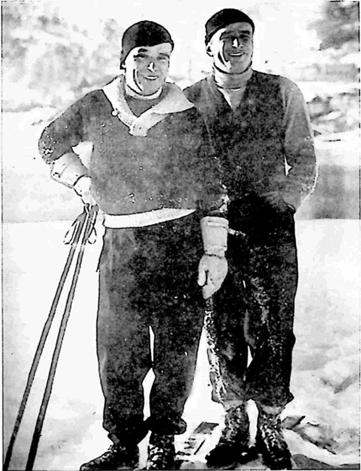
၁၉၃၁ ခုနှစ် ဆရပ်ပတ် က စိန့်မော်ရစ်တွင် ချက်ပလင်ကို ဒေါက်ဂ လပ်စ်ဗဲယားဘင် နှင့် အတူတွေ့ရပုံ