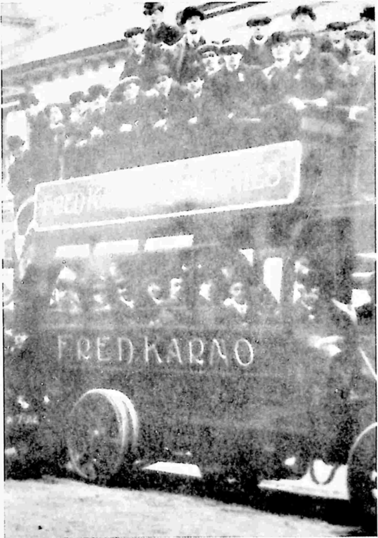
ကန်စ် အဖွဲ့များထံမှ တစ်စုံဖြစ်သည်။ ကန်သည် ရာစုနှစ်က ခန်းမကို ပြောင်းလဲခဲ့သော အဓိကအင်အားဖြစ်သည်။ သူသည် ပါရမီရှင်သောလူများကို စည်းရုံးခဲ့လေသည်။