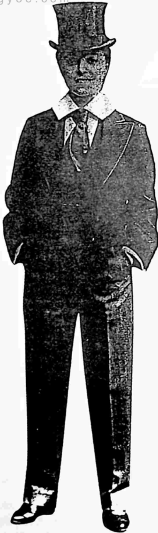
ရုပ်ရှင်လောကရောက်စ အစောပိုင်းက ကာနိုကုမ္ပဏီတွင် လုပ်ကိုင်စဉ်က သရုပ်ဆောင်ခဲ့ပုံ။

လူဆင်းရဲတို့ကို ကယ်တင်နိုင်မည် မဟုတ်။ လူဆင်းရဲတို့၏ဘဝသည် ရေရှည်ကာလ၌ ဆင်းရဲခြင်းမှ ခိုကိုးရာမဲ့ခြင်းသို့ ပြောင်းလဲသွားသည့်အခါ အဆိုးရွားဆုံးအခြေအနေသို့ ရောက်ရှိသွားပေလိမ့်မည်။