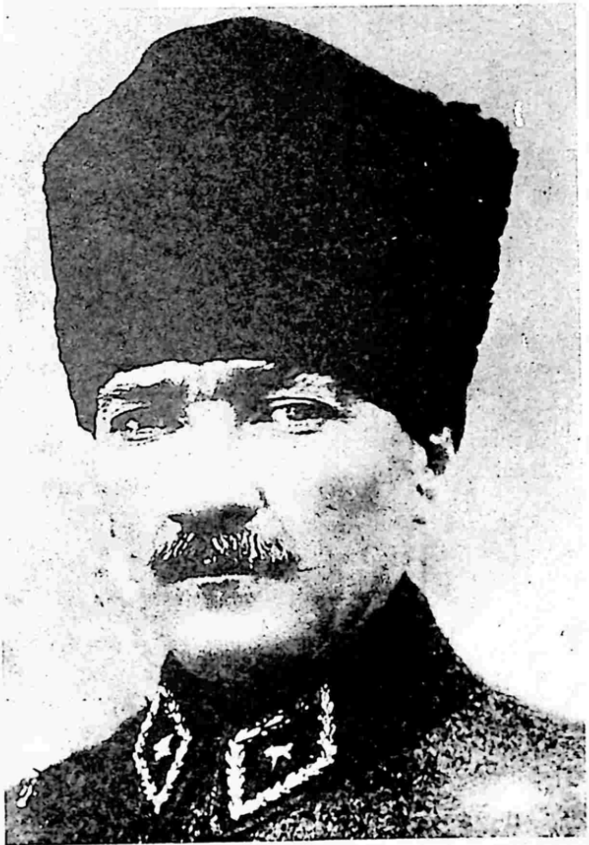
တူရကီအာဏာရှင်