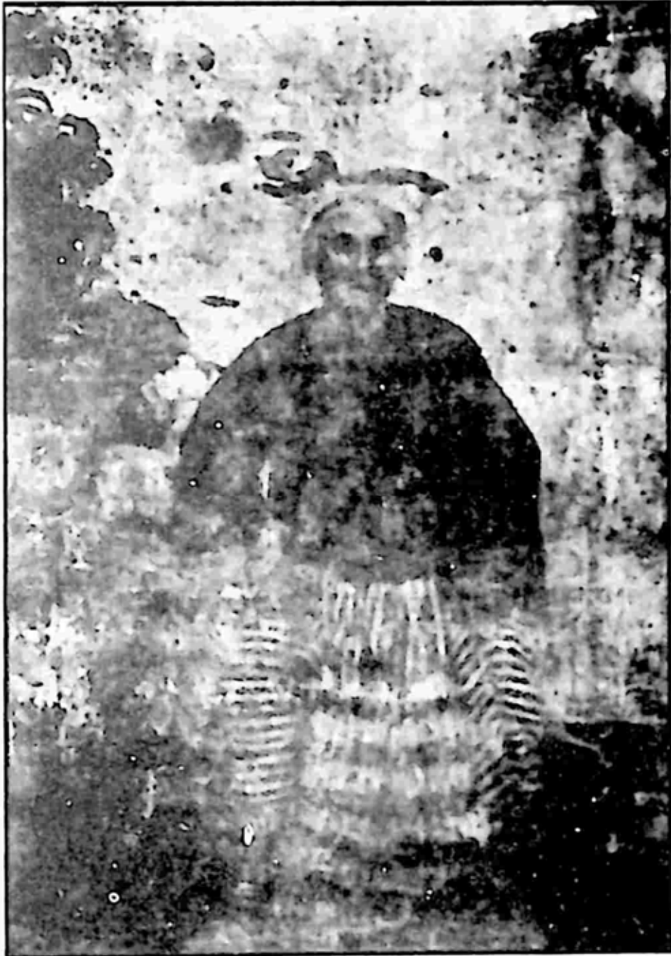
မွန်သူဌေးကြီး ဦးနာအောက်