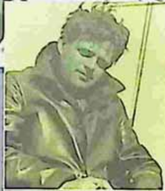
Jack London The Cruise Of The Dazler