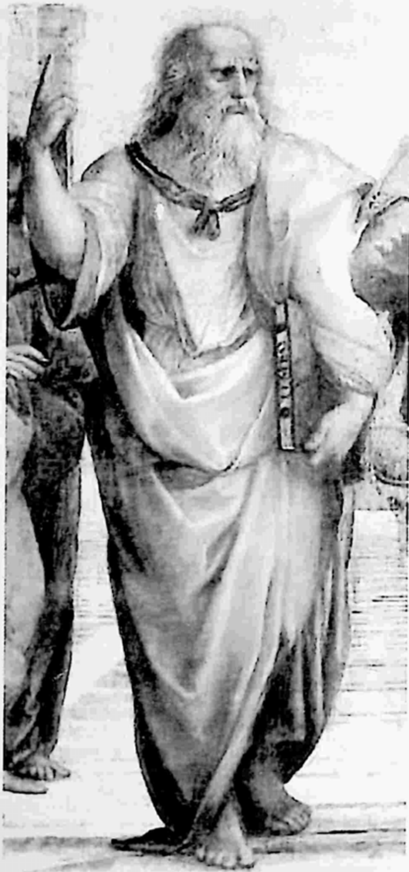
ပလေတို (၄၂၇-၃၄၇ ဘီစီ)