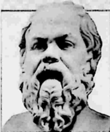
Socrates 469–399 B.C.

Socrates was one of the most powerful thinkers in history. He encouraged his students to examine their beliefs. Socrates asked them a series of leading questions to show that people hold many contradictory opinions. This method of teaching by a question-and-answer approach is known as the Socratic method . He devoted his life to gaining self-knowledge and once wrote, "There is only one good, knowledge; and one evil, ignorance."