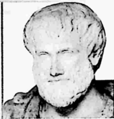
Aristotle 384–322 B.C.

Born into a wealthy Athenian family, Plato had careers as a wrestler and a poet before he became a philosopher. He studied with Socrates. After his teacher died in 399 B.C., Plato left Greece and traveled to North Africa and Italy. He later returned to Athens and founded a school called The Academy in 387 B.C. The school lasted for approximately 900 years. It was Plato who once stated, "Philosophy begins in wonder."