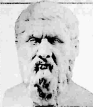
Plato 427–347 B.C.

Socrates was one of the most powerful thinkers in history. He encouraged his students to examine their beliefs. Socrates asked them a series of leading questions to show that people hold many contradictory opinions. This method of teaching by a question-and-answer approach is known as the Socratic method . He devoted his life to gaining self-knowledge and once wrote, "There is only one good, knowledge; and one evil, ignorance."