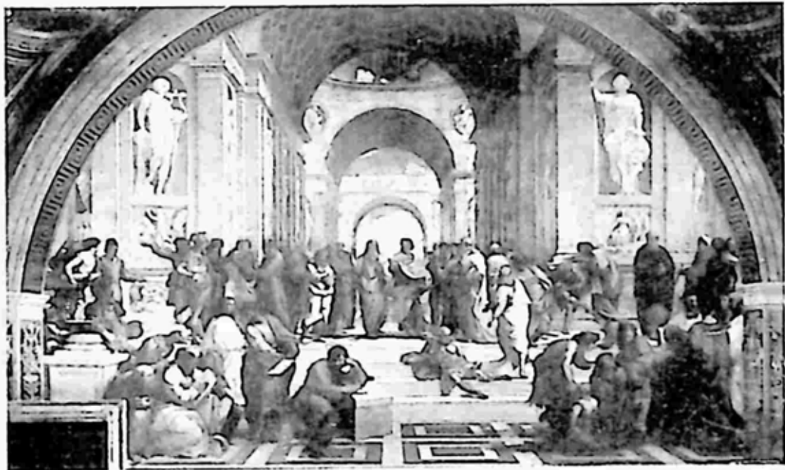
ပလေတို၏ အကယ်ဒမီ

ပလေတိုသည် ဒီယိုနိုဆိယပ်အား ဒဿနပညာ သင်ကြားမှု၏ အခက်အခဲများကို ပြောပြသည်။ ဒီယွန်အပေါ်တွင် ပြုမူခဲ့သော မတရားမှုကိုလည်း ဖယ်ရှားပစ်ရန် ပြောပြသည်။ ထို့ကြောင့် ပလေတိုနှင့် ဒီယိုနိုဆိယပ်တို့ အဆင်မပြေ ဖြစ်ကြပြန်ရာ ပလေတိုသည် ချက်ချင်းပင် မိမိကိုယ်ကို အကျဉ်းသား ဖြစ်နေသလားဟူ၍ စဉ်းစားရသည့် အခြေအနေသို့ ရောက်ရှိသွားခဲ့သည်။ မိတ်ဆွေဖြစ်သူ တာရင်တန်ဘုရင်၏