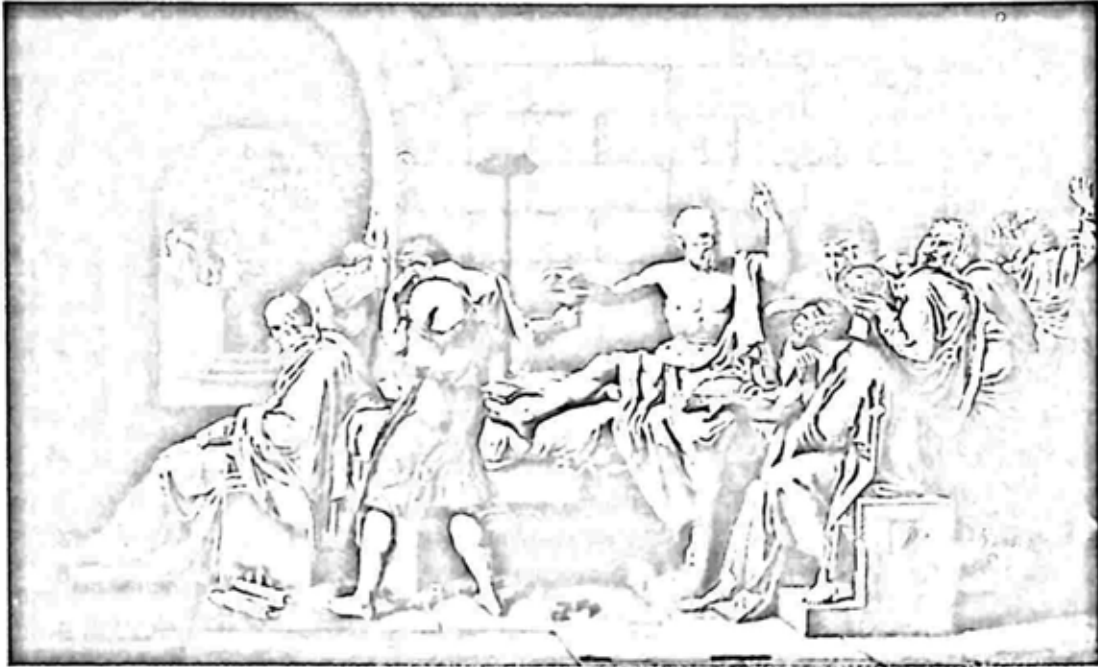
အဆိပ်ခွက်ကို လှမ်းယူနေသော ဆိုကရတီ

ထို့ကြောင့် ဆိုကရတီသည် သူ့ကို အိုလံပစ် အောင်ပွဲရသူများကဲ့သို့ တစ်သက်ပတ်လုံး အစိုးရစရိတ်ဖြင့် ပရိုတေနိယံ၌ နေဖို့ အစီအစဉ်