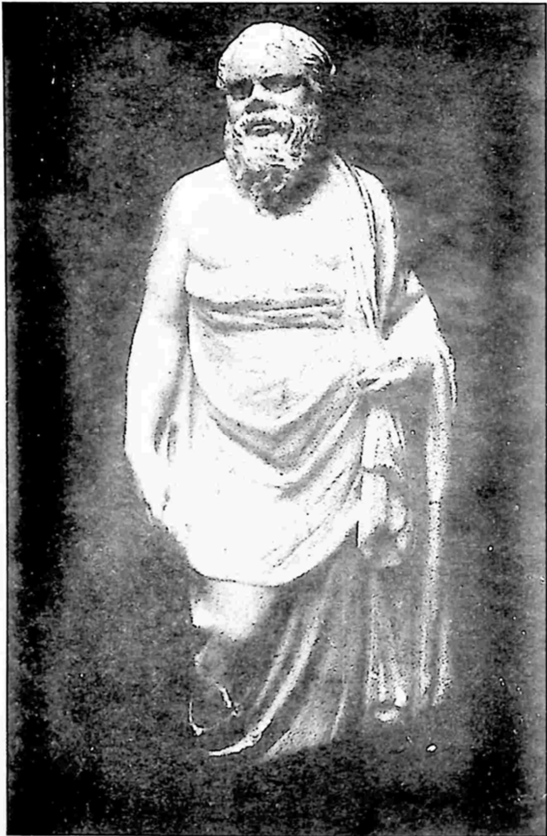
ဆိုကရေတီ (၄၇၀-၃၉၉ ဘီစီ)