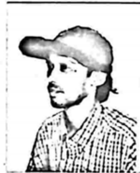
ပိုင် (အေဒီ ၁၉၆၅ - ) PYE (AD 1965 - )