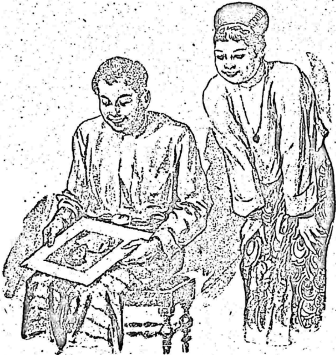
၆၆ ဝါတ်ပုံကိုကြည့်နေသည်ကိုမြင်ရသောအခါ၊ ပြုံးရိုက်၍လာလေ၏။

အရိုင်းနေလျှင် သတင်းစာ၌ပါသော တောင်သူမကလေးမျိုးလို နေမှာပဲဟု မောင်ဟန်တွေးမိလေ၏။ သို့တွေးရဦး ရုပ်ပုံနှစ်ခု တစ်လှည့်စီယှဉ်၍ ကြည့်လေ၏။