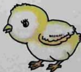
chick ကြက်ကလေး