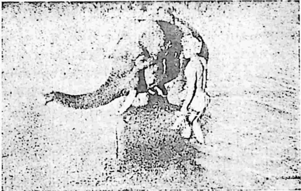
ဆင် ရေချိုးဆင်းချိန်

ဆင်မများသည် အသက် ၁၇ နှစ်က ၂၀ နှစ် အကြားတွင် ပထမဦးဆုံး မိတ်လိုက်လေ့ရှိ၏။ ပဋိသန္ဓေ ၁၀ လရပြီးသော ဆင်မသည် မိတ်မလိုက်တော့ပေ။ ဆင်ထီးသည် အသက် ၁၈ နှစ်နှင့် ၂၀ နှစ်အကြားတွင် ဦးဆုံးမိတ်လိုက်တတ်ကြသည်။ ဆင်ယဉ်များ၏ မိတ်လိုက်ရာသီမှာ အလုပ်ရပ်နားထားသော မတ်လနှင့် ဧပြီလတို့တွင် ဖြစ်သည်။ အစိုးရသစ်ထုတ်လုပ်ရေးတွင် ပဋိသန္ဓေရှိလာသော ဆင်မများကို မမွေးဖွားမီ သုံးလနှင့် မွေးဖွားပြီး သုံးလ၊ ပေါင်းခြောက်လထိ အနားပေးထားရသည်။ ထိုခြောက်လအတွင်း ဘာမျှမလုပ်ခိုင်းရချေ။ အကြောင်းအမျိုးမျိုးကြောင့် လ နုသောဆင်မများ ပဋိသန္ဓေပျက်ကျပါက တစ်လနားခွင့်