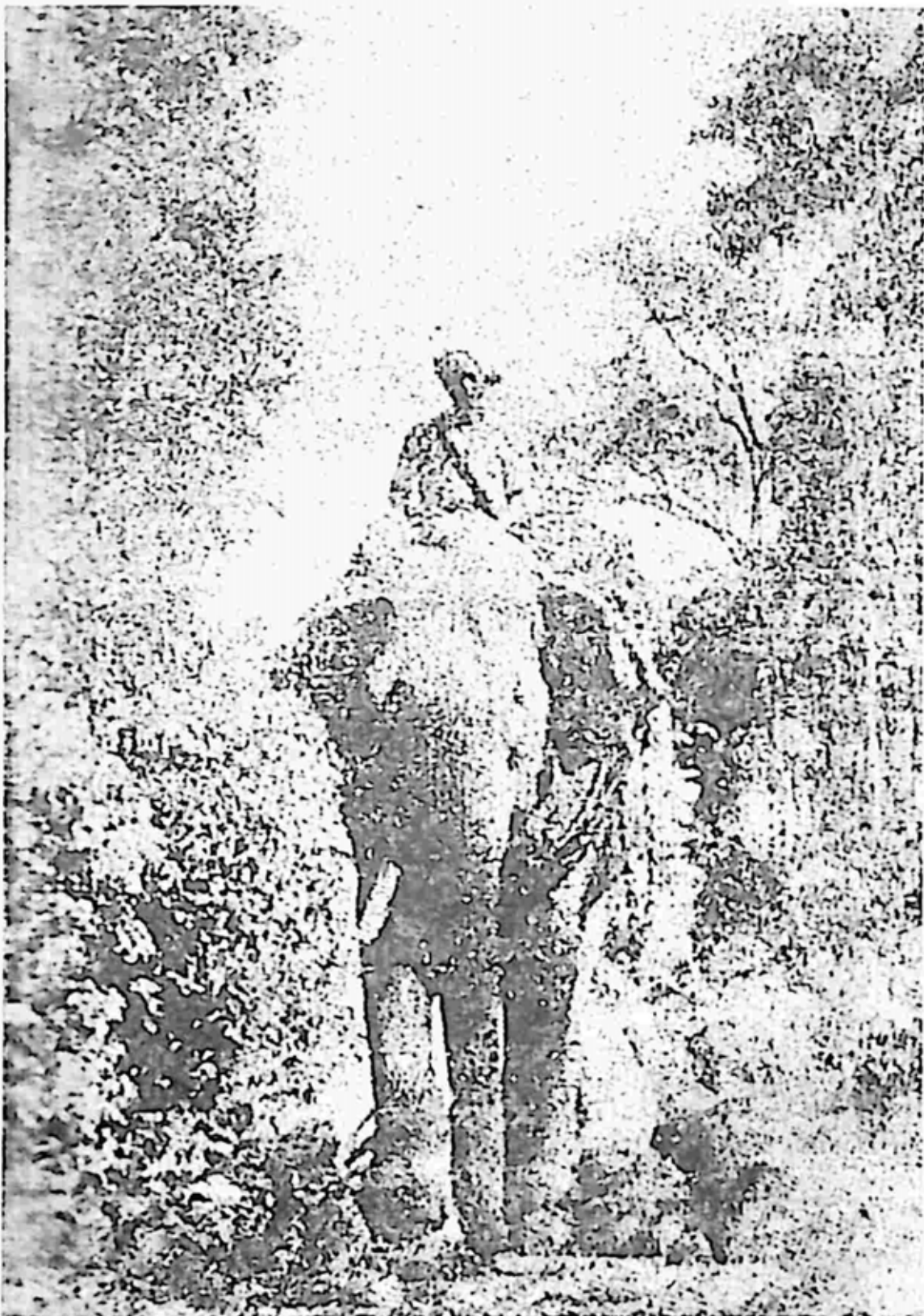
တစ်နေ့တာအလုပ်လုပ်ပြီးနောက် စခန်းသို့ ပြန်လာစဉ်