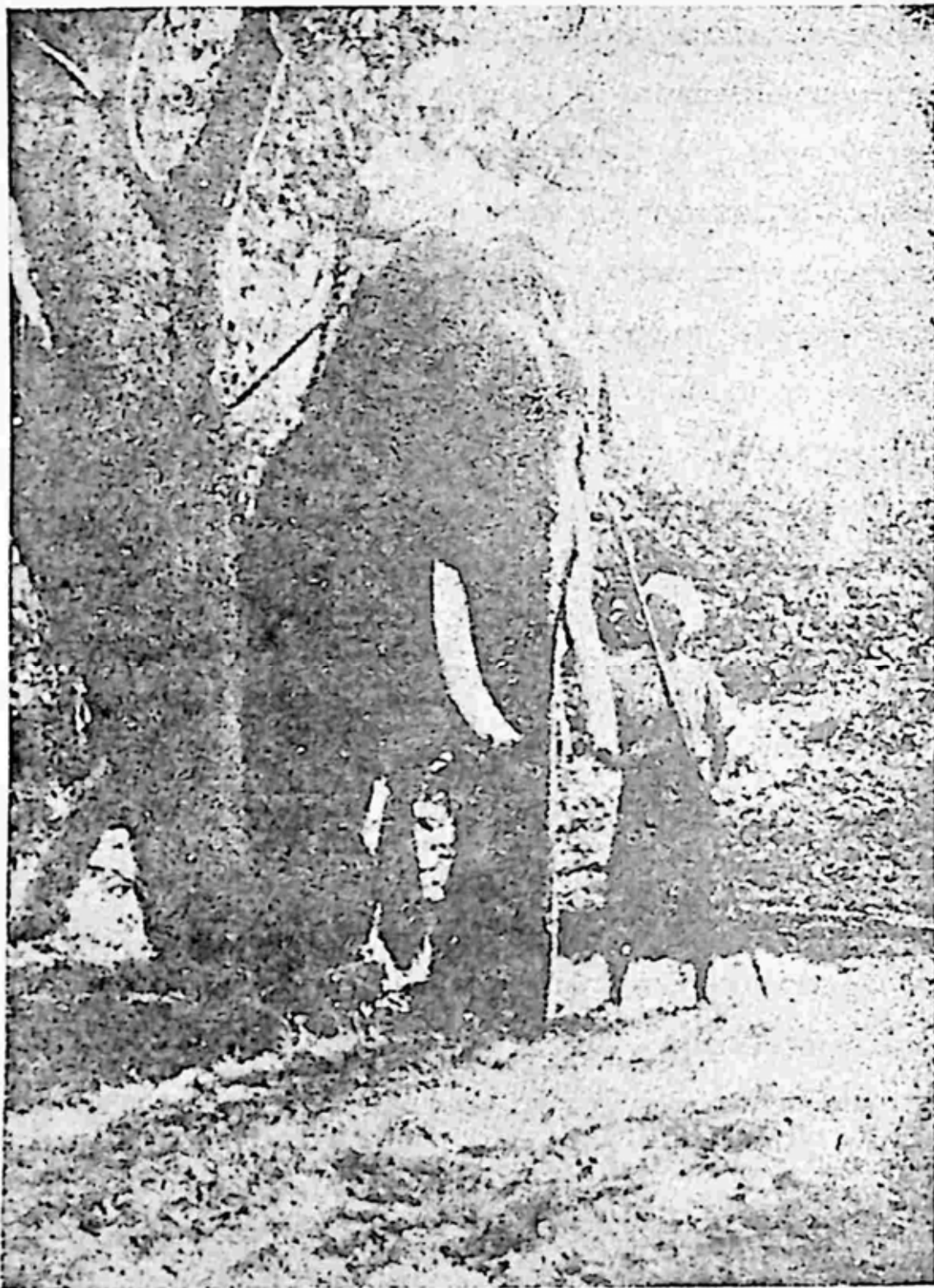
ဆင်ဦးစီးအတော်များများကိုသတ်ခဲ့သော စွယ်စုံဆင်ကြီး။ ဦးစီးနှင့် သူ့လက်ထောက် နှစ်ဦးစလုံး လက်နက်စွဲကိုင်ထားရသည်။