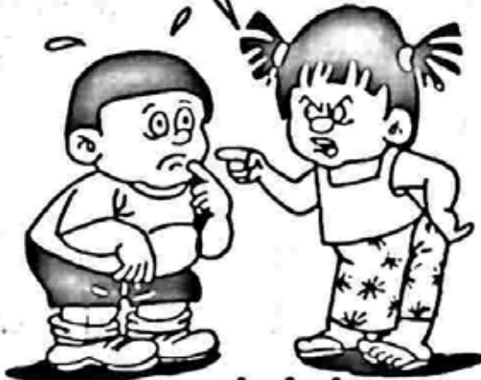
ဇမင်ဇမင်ညွတ်

စကားကြီး စကားကျယ် စကားပေး ပာမပြောနဲ့... ကလေးဆိုတာ ကလေးနဲ့ တန်တို စကားပဲ ပြောရတယ်ဟဲ့