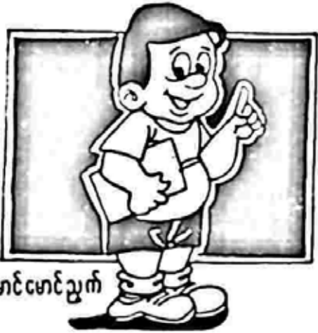
မောင်မောင်ညွှက်

ကတိကို ဂွယ်ဂွယ် မပေးရဘူး...ကတိပေးပြီး ရင်လည်း ကိုယ့်ကတိကို တည်အောင် ဂွယ်ပြရမယ်