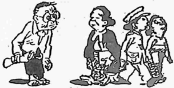
မိမိအဖတ်၊ မိမိဝတ်လုံ၊ မိမိ အရာရှိ