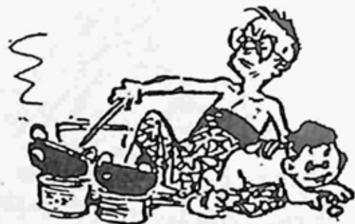
ခလေးထိန်းရင်း၊ အာပုံလုပ်ကာ ရောင်းလေတော့သတည်း၊