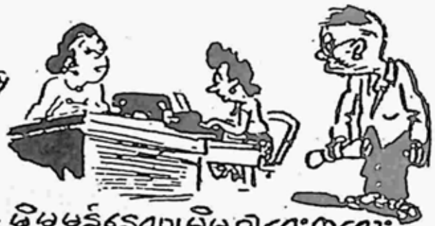
မိမိမန်နေဂျာ၊ မိမိခါရေးကလေး စသဖြင့် အများအပြားတွေ့ရလေရာ