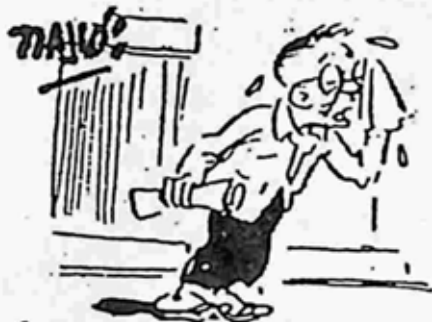
ရှေးသရောအခါအလုပ်လက်မဲ့လှငယ် တစ္ဆီးသုန်း၊ ပင်ပန်းစွာ အလုပ်အကိုင် လျက်၍ ရှာရာတွင်