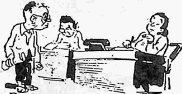
မိမိရုံးအုပ်၊ မိမိခါရေးကြီး