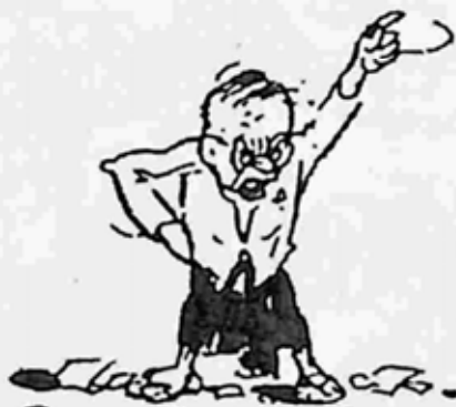
ငါတို့ယောက်ျားများ၏အလုပ်ကိုဝင်၍ လုပ်ကိုင်လေပြီ၊ သင့်တို့အလုပ်ကို ငါဝင်၍လုပ်တော့အံ့ဟု ကြုံးစား၏