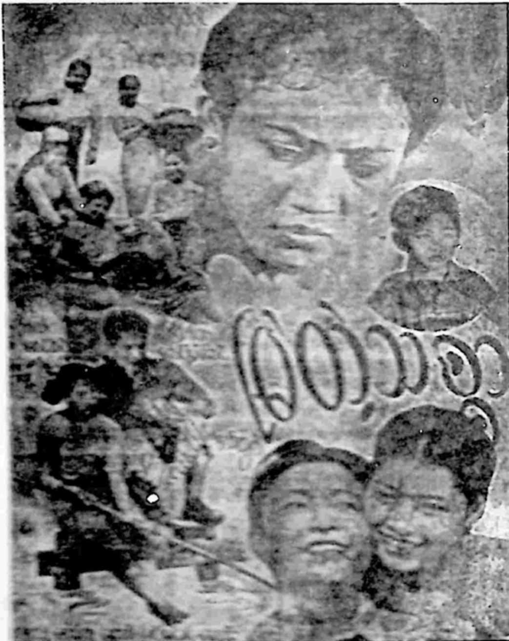
ဇေယျ ပါဝင်သော မြဲတဲ့သစ္စာ ဖတ်ကားကြော်ငြာ (၁၉၅၂)