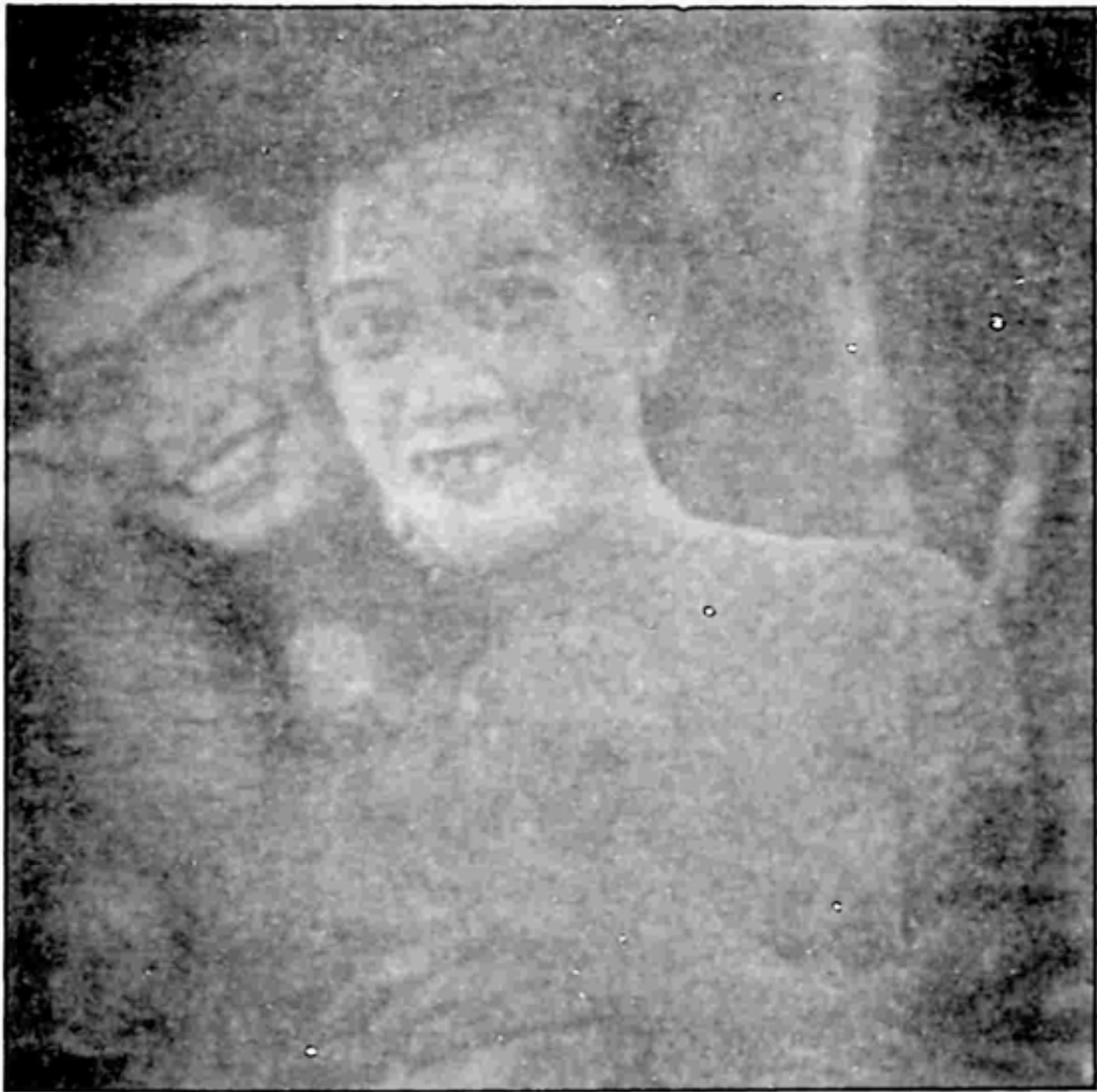
ဇေယျ ပါဝင်သော မြဲတဲ့သစ္စာ ဇာတ်ကားကြော်ငြာ (၁၉၅၂)

လို့ ခေါ်လိုက်တာ ဗြိတိသျှဘားမား အဖွဲ့သားအားလုံးကလည်း အစ်ကိုကြီး လို့ပဲ ခေါ်ခဲ့ကြတယ်။ အားလုံးကလည်း အစ်ကိုကြီးလို့ပဲ ခေါ်ခဲ့ကြတယ်။ ကျုပ်ထက် အသက်ကြီးတဲ့ ဒါရိုက်တာဦးချန်ထွန်းကတောင် ကျုပ်ကို ချစ်ချစ် ခင်ခင် လေးလေးစားစားနဲ့ အစ်ကိုကြီးလို့ပဲ ခေါ်ခဲ့ပါတယ်” ဟူ၍ နောင်အခါ ဇေယျက ပြန်လည်ပြောပြခဲ့သည်။