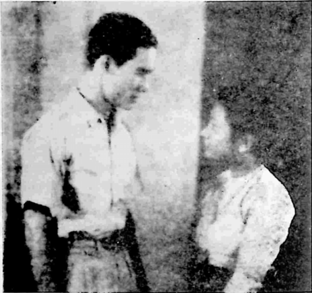
လင်နဲ့အပျို ဇာတ်ကားမှ ဇေယျနှင့် တင်တင်မူ