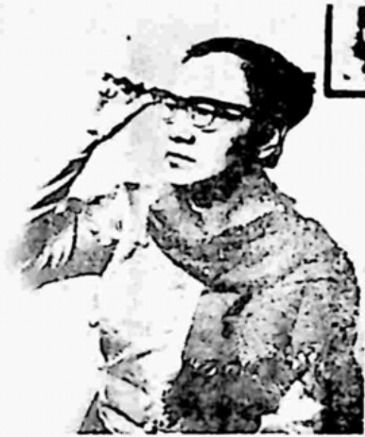
သမီးပျောက်ရှာနေသူ ဒေါ်ခင်ကြီး