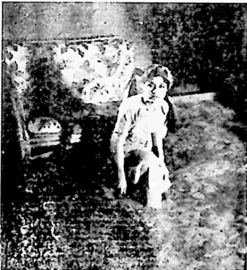
အကြောင်းကံ မလှသဖြင့် သူတစ်ပါးအိမ်တွင် အစေအပါးဘဝ ဖြစ်လာရသူ မသူလ