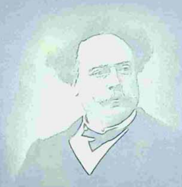
Alexandre Dumas the Younger French writer, 1824-1895