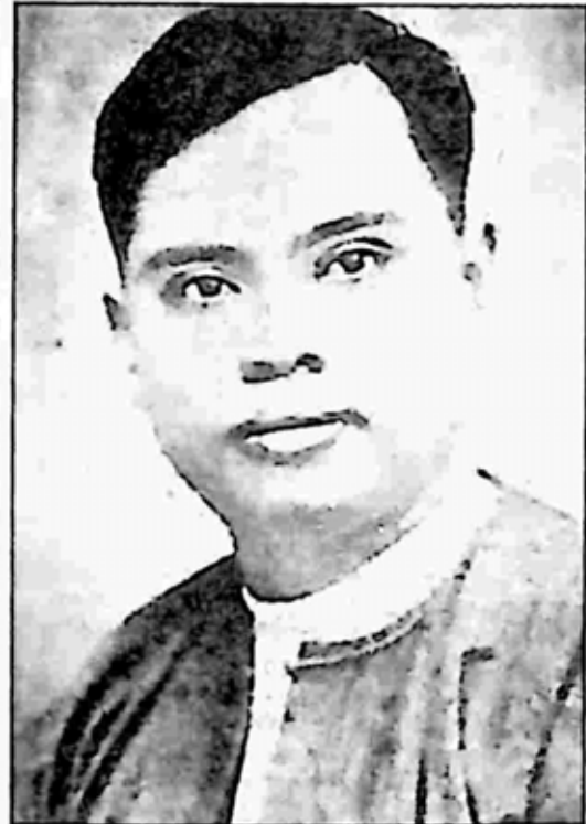
အမျိုးသားပညာဝန် ဆရာကြီးဦးဖိုးကျား