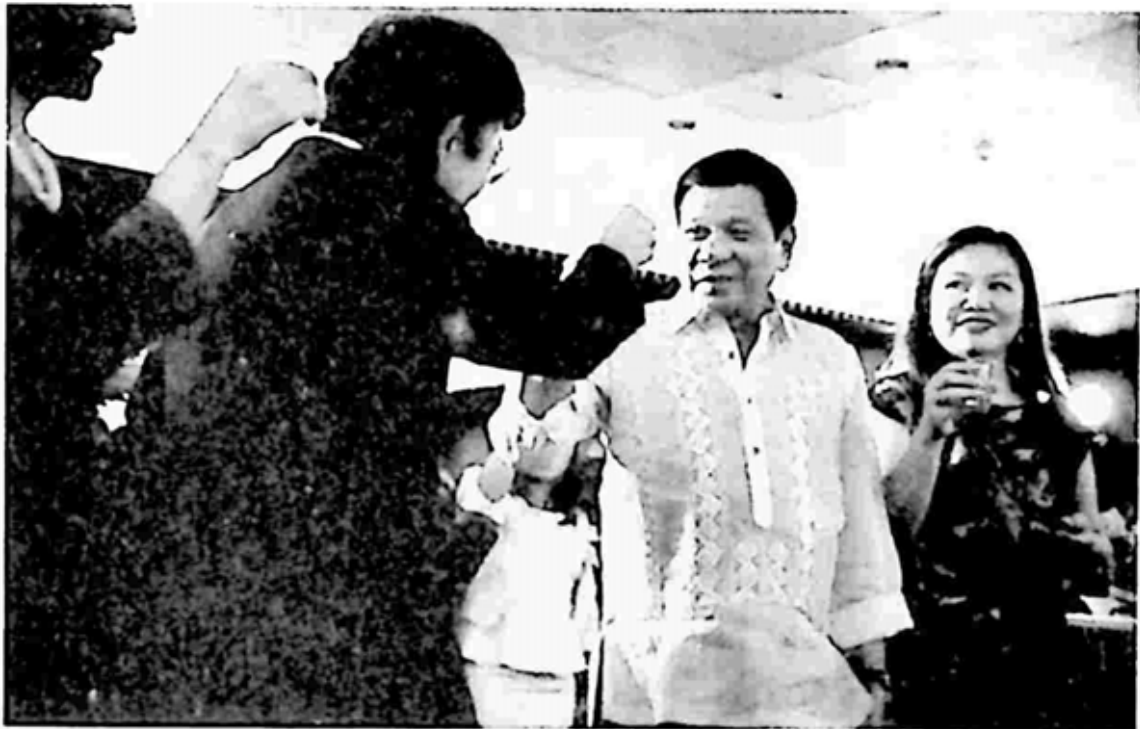
သမ္မတ ဒုတိယတေး နှင့် ဒုတိယဇနီး Cielito အား ပါတီပွဲတစ်ခုတွင် တွေ့ရစဉ်

“ကျွန်တော်ဟာ ဘုန်းတော်ကြီးရဲ့ စကားကိုဖြစ်စေ၊ ပညတ်တော်ဆယ်ပါးကိုဖြစ်စေ နားထောင်လိုက်မယ်ဆိုရင် ဘာမှလုပ်လို့ရမှာ မဟုတ်တော့ဘူး” လို့ သူပြောခဲ့ပါတယ်။ “ကျွန်တော်ဟာ ခရစ်ယာန် တစ်ယောက်ဖြစ်ပေမဲ့ အလ္လာအရှင်မြတ်ကိုလည်း ယုံကြည်ပါတယ်” လို့ ၂၀၁၆ ခုနှစ် ဇွန်လ ၂၆ ရက်နေ့က သူပြောခဲ့ပါတယ်။