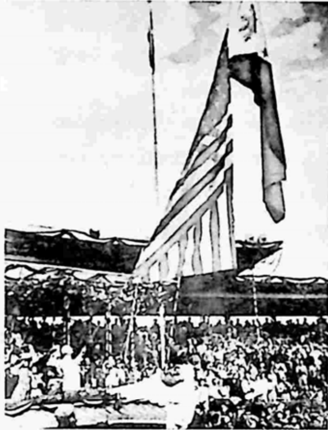
၁၉၄၆ ဇူလိုင်လ ၄ ရက် လွတ်လပ်ရေး အလံတင် အခမ်းအနား

ကြီးဖြစ်လာတာကြောင့် ဖိလစ်ပိုင်နိုင်ငံဟာ ကမ္ဘာ့အရှေ့ဖျားဒေသမှာ စစ်ဒဏ်အခံရဆုံးသောနိုင်ငံ၊ အပျက်အစီးအများဆုံးသောနိုင်ငံ ဖြစ်ခဲ့ရပါတယ်။