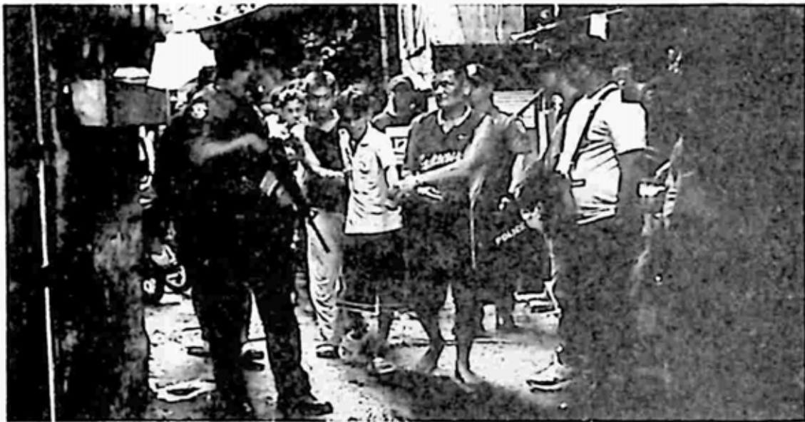
ဒုတိယတေးလက်ထက် မူးယစ်သားကောင်များကို ဖမ်းဆီးလာနေပုံ

တို့နှင့် နှိုင်းယှဉ်လိုက်မည် ဆိုလျှင် မပြောပလောက်သည့် အရေအတွက် ဖြစ်သည်။ အာရှရှိထိုင်း၊ ကမ္ဘောဒီးယားတို့နှင့်ယှဉ်လျှင်ပင် မဆိုစလောက် အရေအတွက် ဖြစ်သွားသည်။