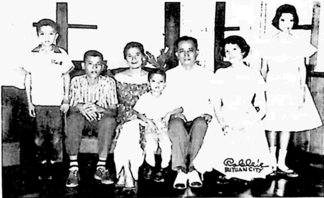
ပိသားစုနှင့်အတူ ငယ်ဘဝ ဒုတိယတေး (ဝဲ-ဒုတိယ) အား တွေ့ရစဉ်

ဒုတိယတေး မြို့တော်ဝန်အဖြစ်ဆောင်ရွက်ခဲ့တဲ့ Davao မြို့ဟာ ရဲဉှာနရဲ့ထုတ်ပြန်ချက်အရ လူသတ်မှုနဲ့မုဒိမ်းမှု အများဆုံးလို့ သိရပါတယ်။ ပြီးတော့ အရွယ်မရောက်သေးတဲ့ ပြည့်တန်ဆာတွေနဲ့ မူးယစ်