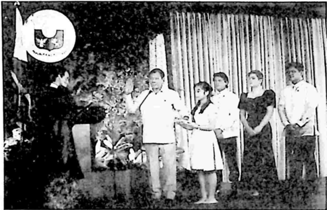
၂၀၁၆ ဇွန် ၃၀ ရက်နေ့ သမ္မတသစ် အဖြစ် ဗမာ့တာ ဒုတိယအကြိမ် ကျမ်းသစ္စာပြုစဉ်