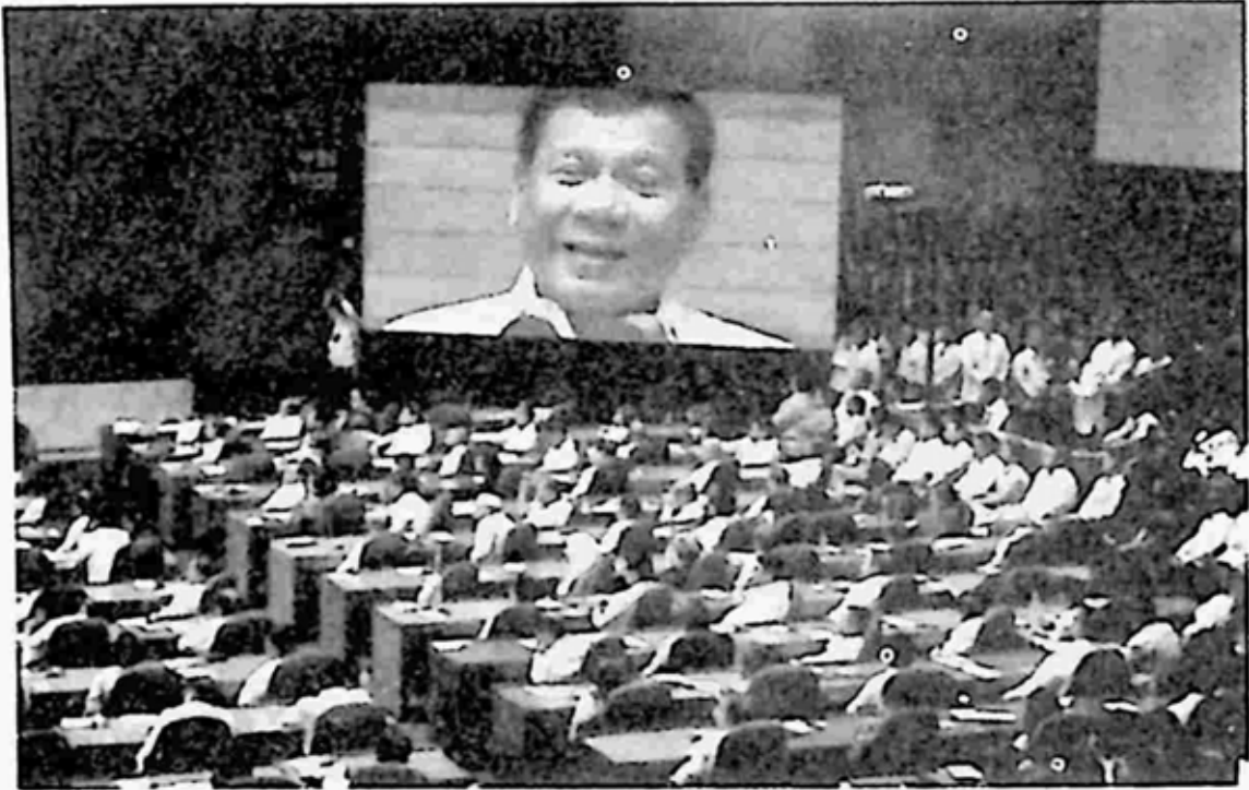
ဖိလစ်ပိုင် လွှတ်တော်အတွင်းမှ သမ္မတ ဒူတာတေး၏ ပုံရိပ်လွှာ

၁၉၉၃ တုန်းက သူတို့နဲ့ လမ်းမှာရင်ဆိုင်ပစ်ခတ်ခဲ့တဲ့ တရားရေး ဌာနဝန်ထမ်းကို ဒူတာတေးက အသေသတ်ခဲ့တယ်လို့ မာတိုဘာတိုက ပြောပါတယ်။ ဒူတာတေးက ဒီလူကို အူဇီကျည်ကတ် ၂ ကတ်သုံးပြီး ပစ်သတ်တာလို့ ဆိုပါတယ်။ လူတွေကို ကလီစာတွေဖောက်ထုတ်ပြီး ရေထဲချပစ်တာ၊ မိကျောင်းစာ ကျွေးတာမျိုးလို ရက်ရက်စက်စက်တွေ လုပ်ခဲ့တယ်လို့လည်း ဆိုပါတယ်။ သူဟာ ဒူတာတေး သမ္မတ ဖြစ်လာ ချိန်မှာ သူ့အသက်အန္တရာယ်ကို စိုးရိမ်လို့ ပုန်းနေရတယ်လို့ ဆီးနိတ် လွှတ်တော် ကော်မတီရှေ့မှာ ထွက်ဆိုခဲ့ပါတယ်။