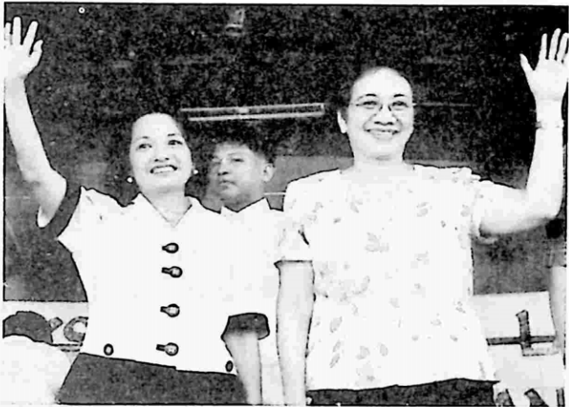
အမျိုးသမီး သမ္မတများ ဖြစ်ခဲ့ဖူးသည့် Arroyo နှင့် Corazon Aquino

ဖြစ်ခဲ့ပါတယ်။ သူ့ကို လွတ်လပ်ရေးရပြီးချိန် ဖိလစ်ပိုင်နိုင်ငံရဲ့ ပထမဆုံး သမ္မတလို့လည်း ဆိုနိုင်ပါတယ်။