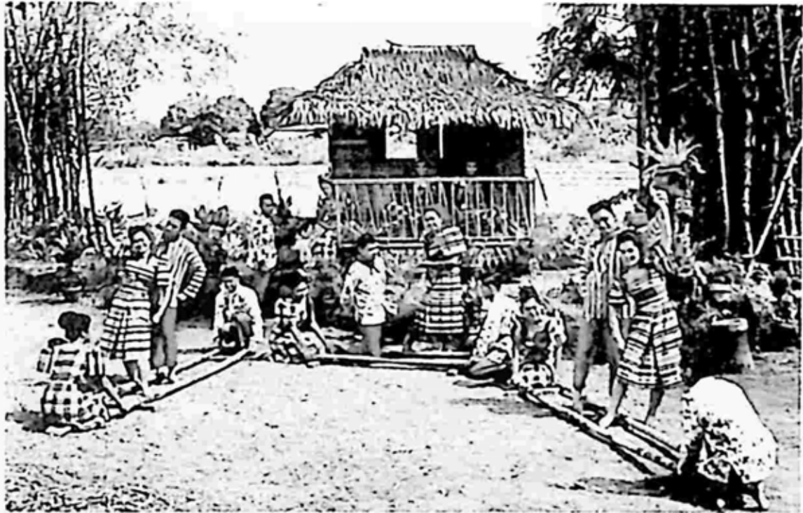
ဖိလစ်ပိုင်ရိုးရာ ဝါးညှပ်အကအား တွေ့ရစဉ်