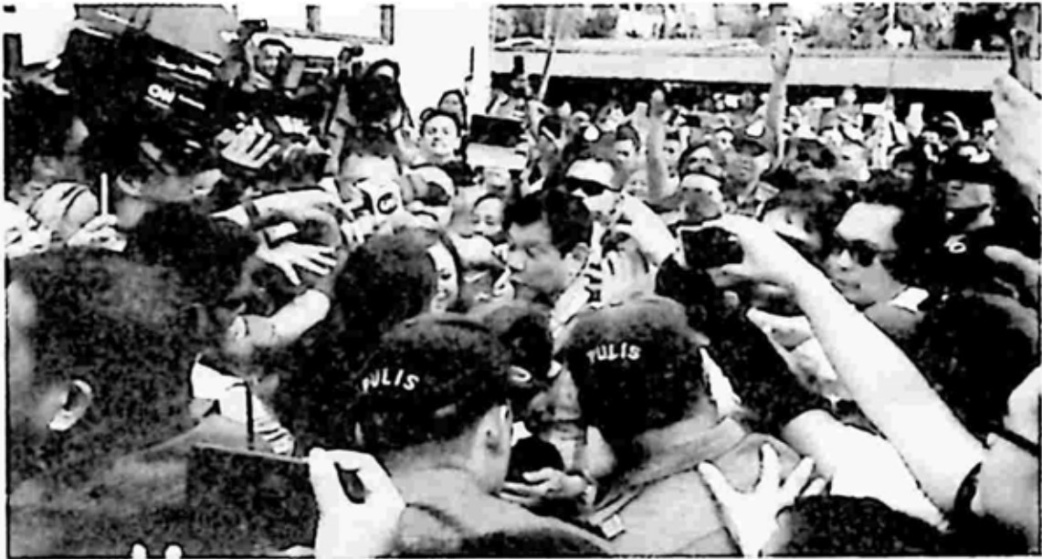
သမ္မတ ရွေးကောက်ပွဲ အနိုင်ရအပြီး ဒုတိယတေးနှင့် ပရိသတ်များ အောင်ပွဲခံစဉ်

သားသား ကိုင်တွယ်မယ်ဆိုတဲ့ မစ္စတာ ဒုတိယတေးရဲ့ ရွေးကောက်ပွဲအကြို မဲဆွယ်ကတိအပေါ် ဖိလစ်ပိုင်ပြည်သူ တွေအတော်များများက သဘော ကျခဲ့ကြပါတယ်။ ဒါပေမဲ့ ရာဇဝတ်ကောင်တွေ ထောင်ချီပြီး သတ်ပစ် မယ်ဆိုတဲ့ မစ္စတာဒုတိယတေးရဲ့အပြောဟာလည်း အငြင်းပွားဖွယ်ရာ၊ ဝေဖန်ဖွယ်ရာ ဖြစ်ခဲ့ပါတယ်။