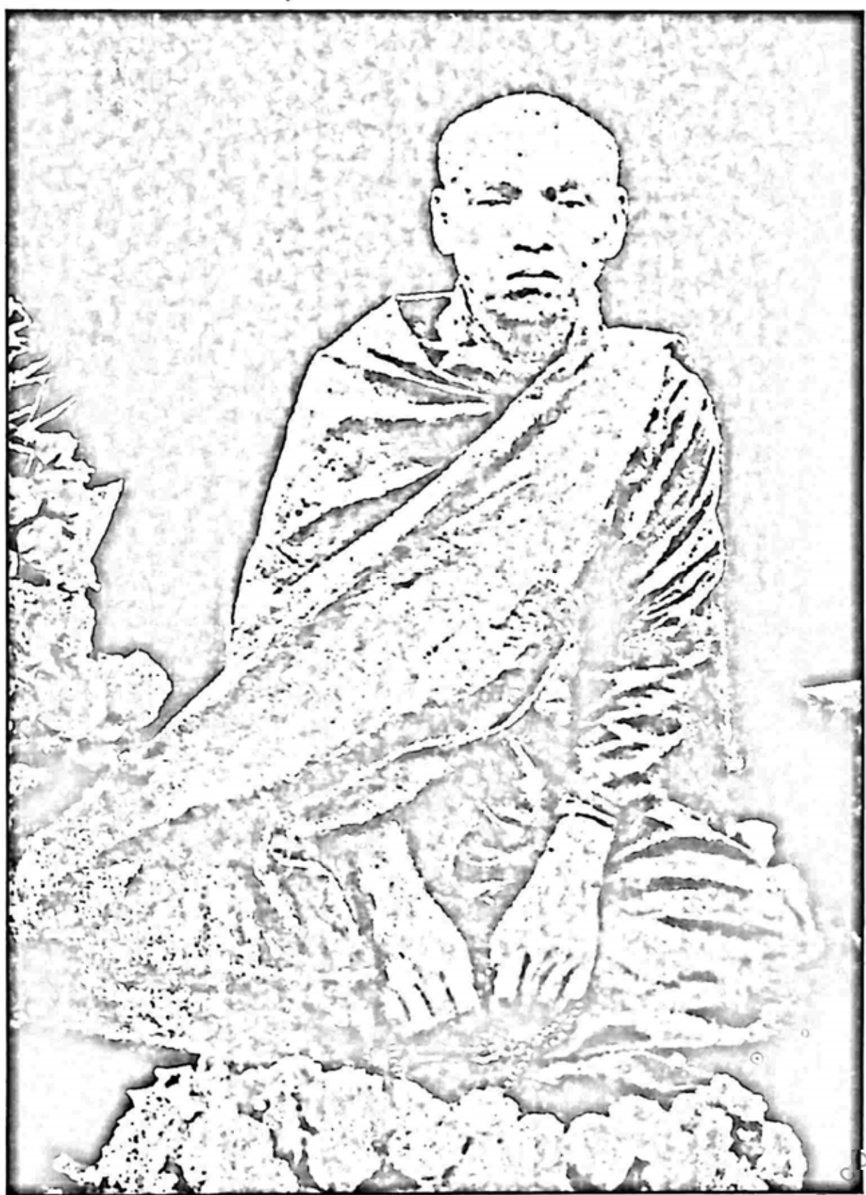
ကျေးဇူးရှင် လယ်တီဆရာတော်ဘုရားကြီး ပုံတော်