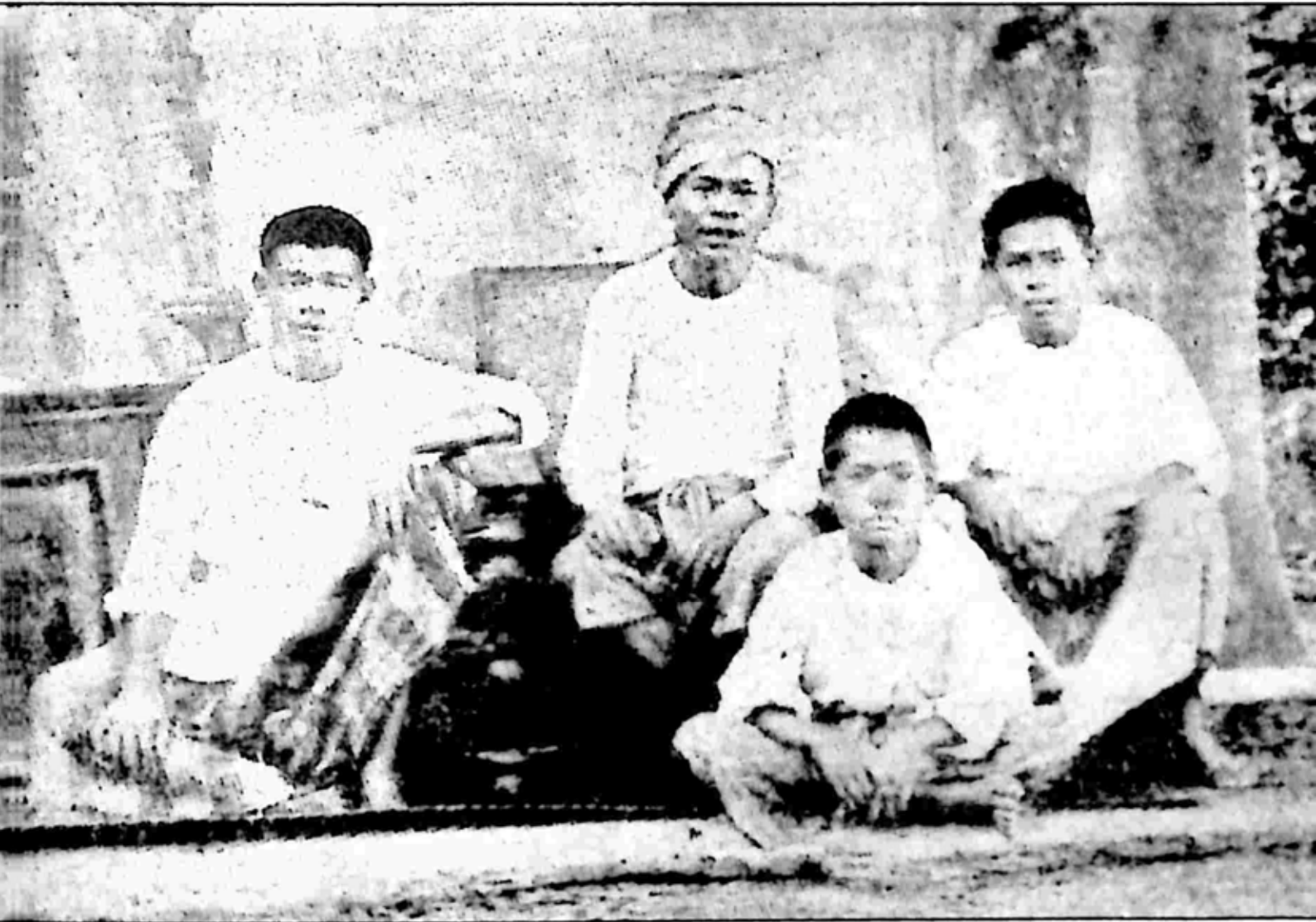
ဆရာချ်နှင့် သားများ