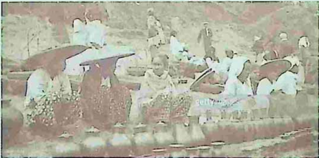
On the Irrawaddy, Burma, Myanmar, 1930.