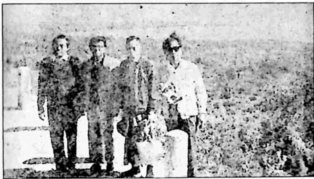
သိန္နီချိုင့်ဝှမ်း နောက်ခံထား၍