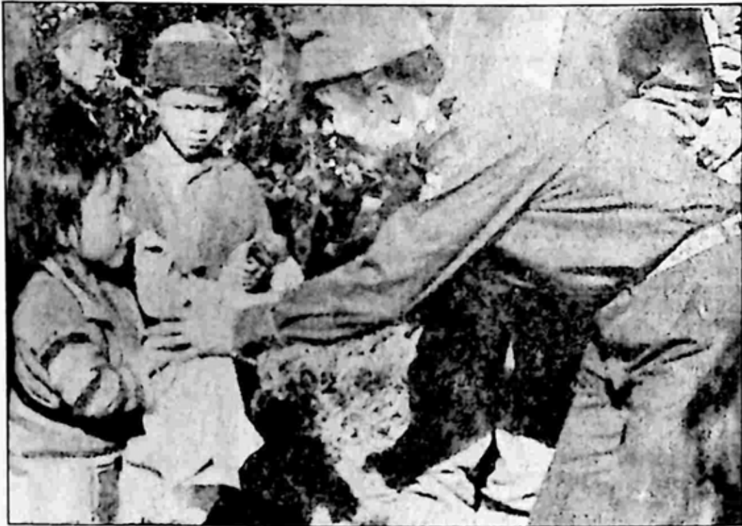
အရှေ့မြောက်တိုင်းတစ်ခုတွင် တွေ့မြင်နေကျရှုခင်းတစ်ခု