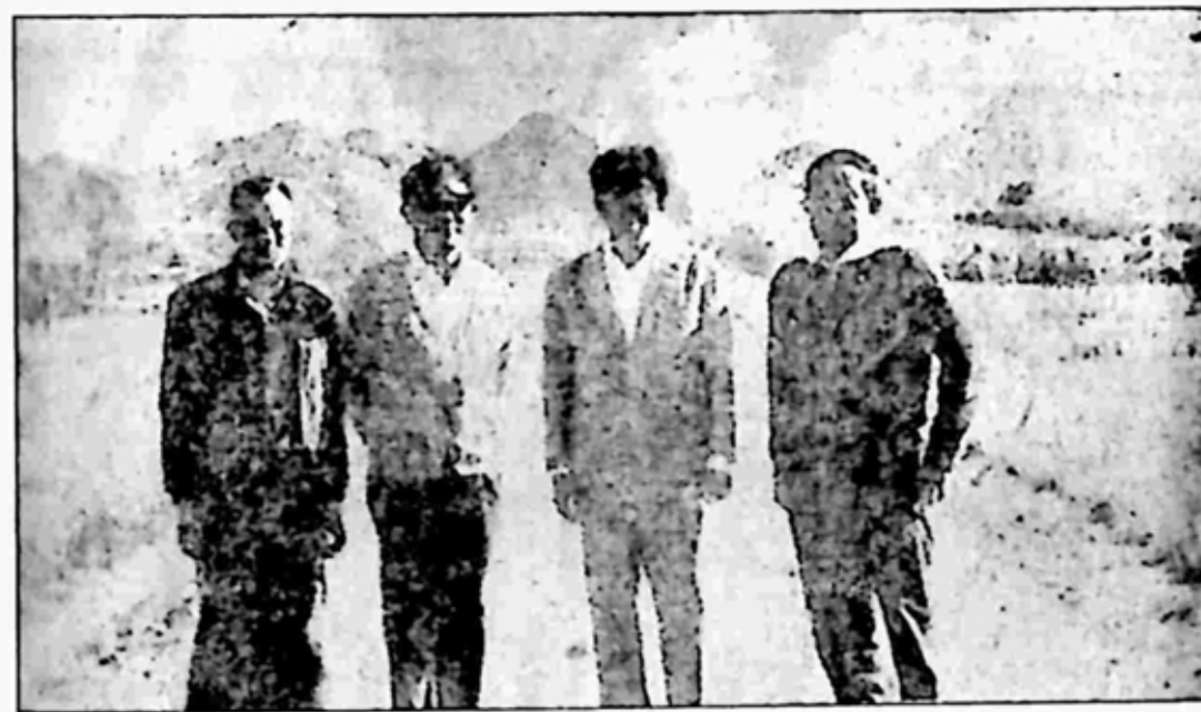
တောင်အလုံး ၃၀ အနီးတွင်

[ ဝိုးကျော်မြင့်၊ ထွန်းဝေ၊ သိန်းဖေမြင့်၊ ကမ္ဘောဇခင်လှိုင် ]