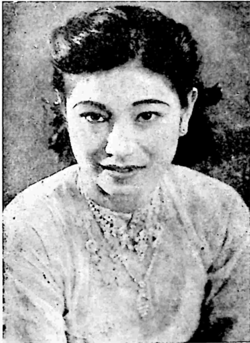
အတူး၏ ငယ်ကျမ်းဆွေ ကံဆိုးမကလေး (အသက်)