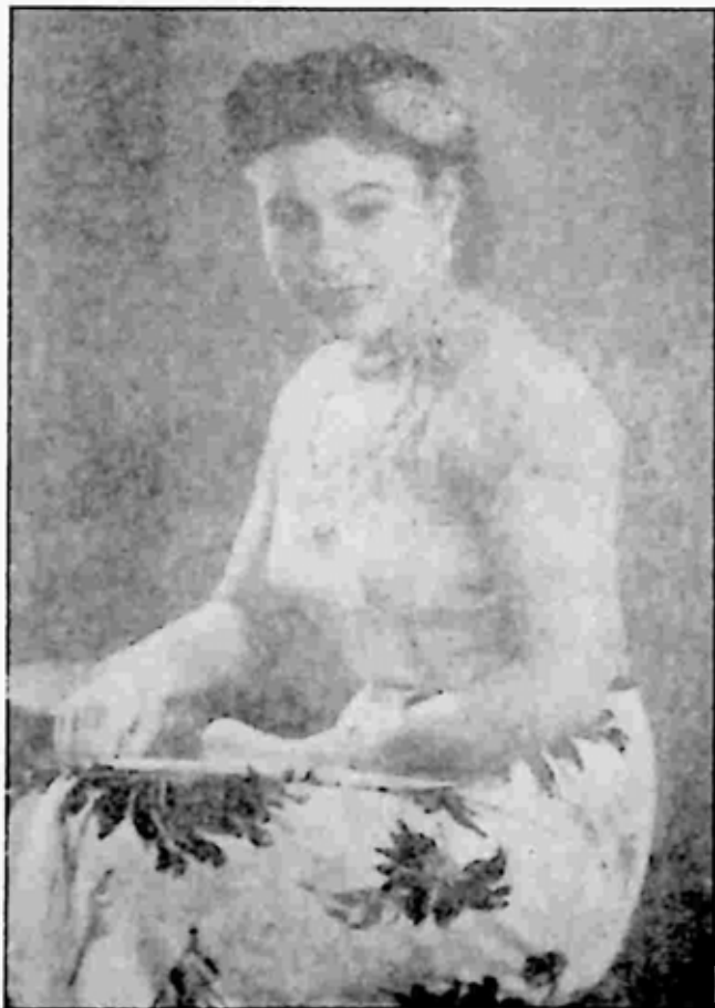
သဘောထားကြီးသူ ချစ်ကရုဏာရှင် (ဌေးဌေး)