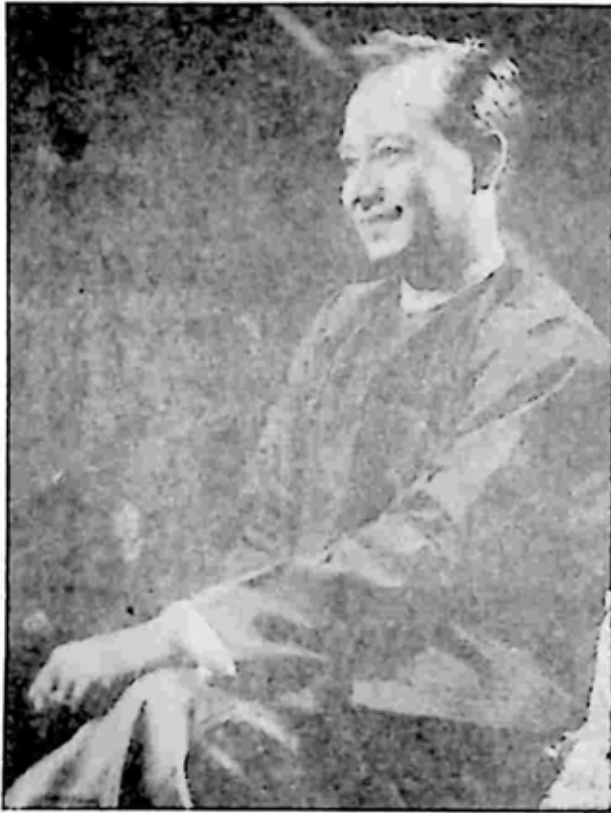
အချစ်ကံမွဲရှာသူ လူပျိုကြီး (ကိုခင်မောင်)