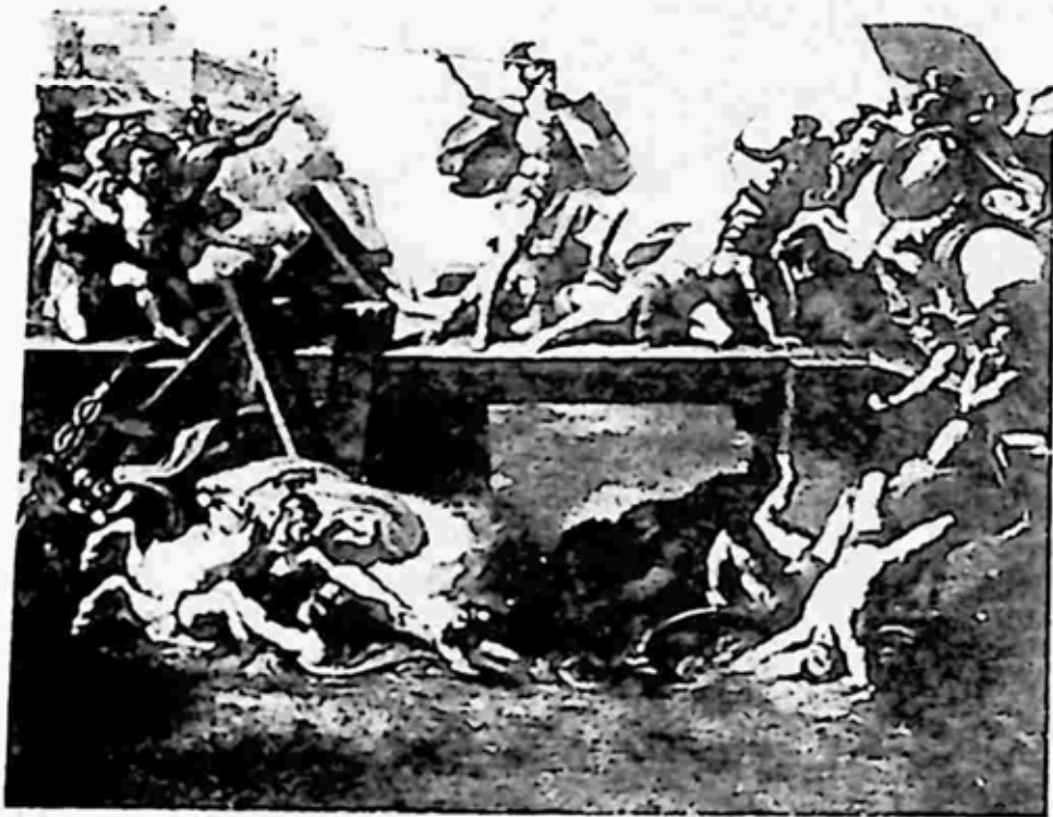
တံတားပေါ်မှ ကြံ့ကြံ့ခံနေခိုက်

ထိုသို့ ကြံရာမရ ဖြစ်နေကြစဉ် တံတားဘက်ရှိ မြို့ရိုးပေါက်၏ တံခါးမှူး ဟိုရေးရှပ်” သည် ပြေးထွက်လာပြီးသော် “သမ္မတမင်း မြန်နိုင်သမျှ မြန်အောင် တံတားကို ဖျက်ချပါ။ ကျွန်တော် တံတား