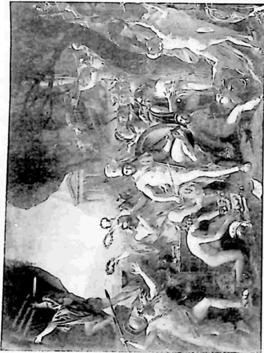
လီအွန်းနီဒက်တိုက်ပွဲ ထွက်ခါနီးအချိန်

ဟူ၍ လမ်းနှစ်ကြောင်းရှိသည်။ ထို့ကြောင့် ထိုမျှ အလုံးအရင်း အင်အား ကြီးမားလှသော ရေတပ်၊ ကုန်းတပ်ကြီးကို ခုခံမည်ဆိုလျှင် အကောင်း ဆုံးနည်းမှာ ဆယ်ချင်းရာချင်းလောက်သာ သွားနိုင်သော တောကြိုတောင် ကြား ချောက်ကမ်းပါးများမှ စောင့်၍ တိုက်ကြရန်ပင် ဖြစ်သည်။ အဘယ့်ကြောင့်ဟူမူ ဤအရပ်ဒေသများတွင် အလုံးအရင်းထက် စွမ်းရည်သတ္တိတို့က ပိုပြီး ခရီးရောက်နိုင်သောကြောင့်တည်း။