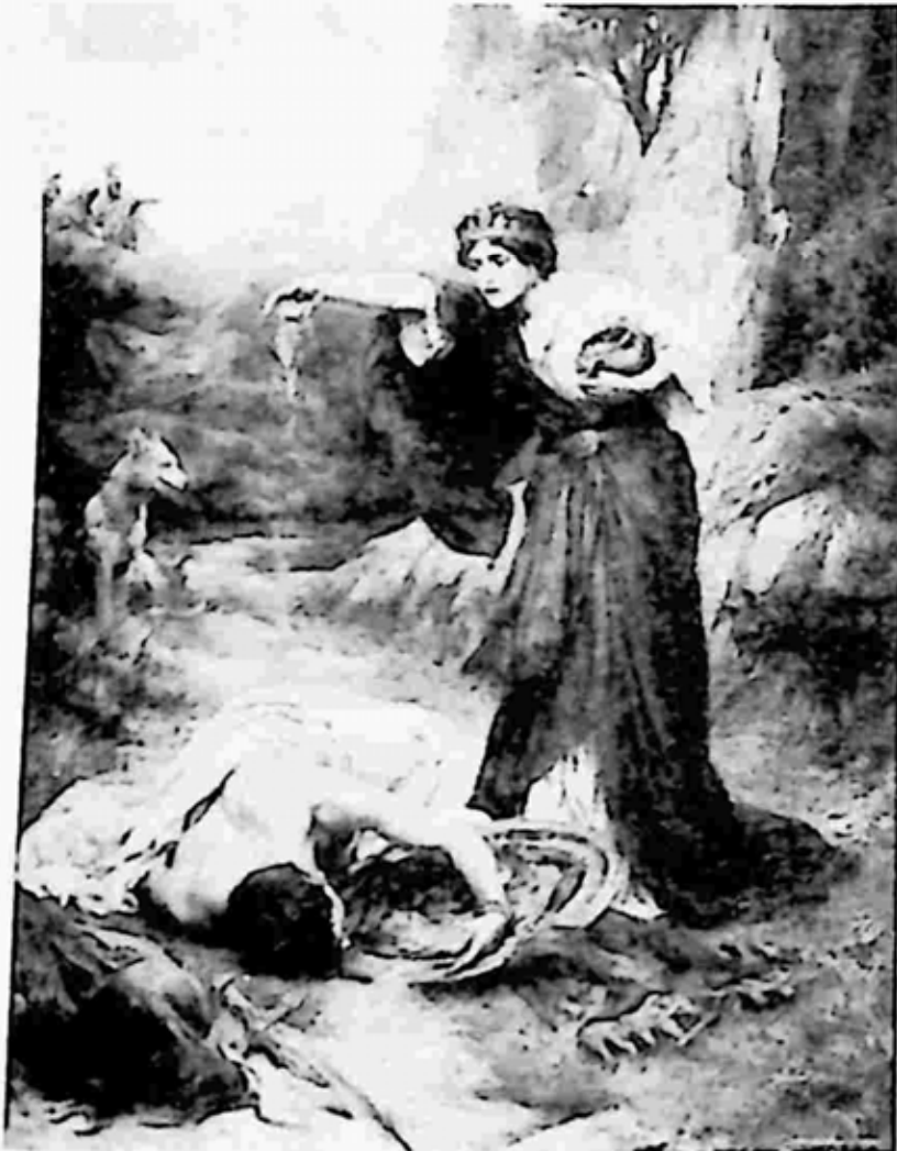
ကတိတည်သော အန်တစ်ဂိုနို

ဘုရင်က မည်သို့ပင် အမိန့်တော် ပြန်ထားသော်လည်း အာဇာ နည်တို့ မည်သည်ပေးပြီးသော ကတိကိုပယ်သည် ဟူ၍ မရှိချေ။