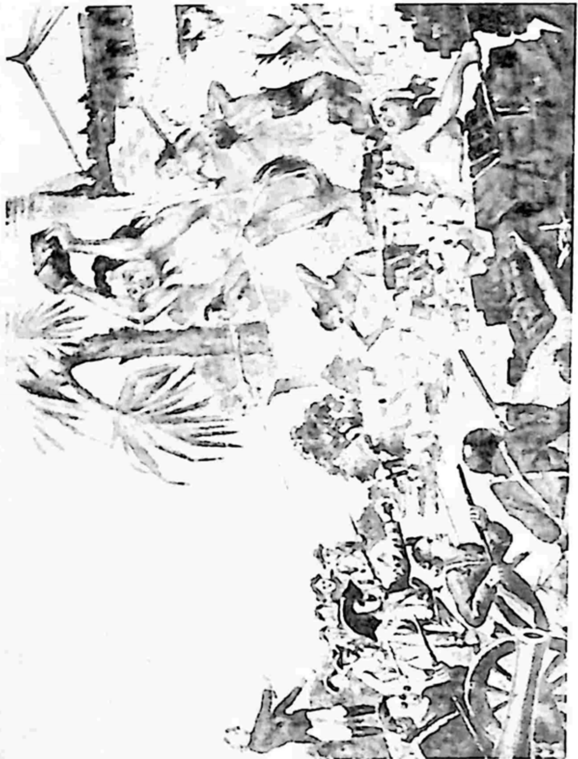
အပိုင်မခံ အရှုံးမပေးလိုသော ဗမာ့တနည်း။