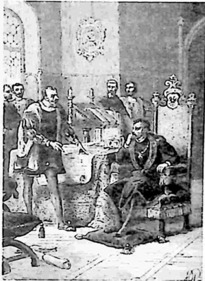
ပီဇာနိုးနှင့် ပဉ္စမချားဘုရင်

တော့ချေ။ သူတစ်ဖက်သား၏ ပစ္စည်းဥစ္စာကို အာသာငမ်းငမ်းတက် လိုချင်ကြသောကြောင့် စွန့်စားကြသည့် စိတ်ဓာတ်နှင့် သတ္တိတို့ကို သူခိုးစားပြုတွေ့ထဲတွင် မကြာခဏ တွေ့နိုင်ကြပေသည်။ စစ်အနိုင် ရကာ လုယက်ရသည်ကို သဘောကျ၍ စစ်ဝင်တိုက်ကြသော အောက် တန်းစားစစ်သားမျိုးထဲတွင်လည်း အဆိုပါ စိတ်ဓာတ်နှင့် သတ္တိမျိုးကို မကြာခဏ တွေ့နိုင်ကြလေသည်။