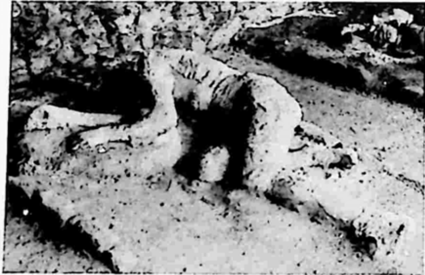
ပွန်ပေးအိမြို့ပျက်မှ တွေ့ရသော စစ်သား

ဗေးဆူဗီးယပ် ၂ မီးတောင်ကြီး ပေါက်ကွဲ၍ ပွန်ပေးအိ ၃ မြို့ကြီးကို မီးခိုးပြာချော်မြုပ်တို့သည် ကွက်လပ်မရှိ ဖုံးလွှမ်းလျက် ရှိလေပြီ။