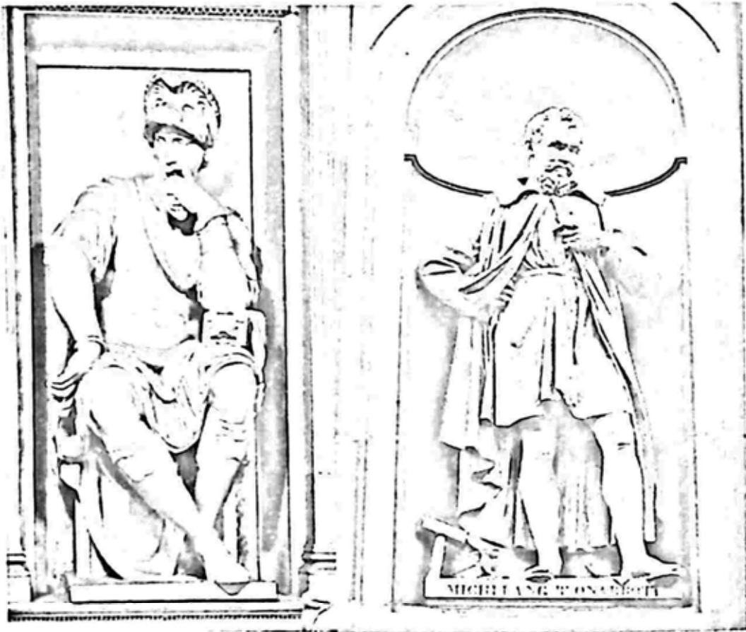
လော်ရင်ဇို မိဒီချီ(ဝဲ)နှင့် ဖလော်ရင့်မြို့တော်ရှိ မိုင်ကယ်၏ ရုပ်တု(ယာ)

မိုင်ကယ်သည် စူး၊ ဆောက် တန်ဆာပလာများကို ကောက်ယူကာ ကျောက်သားပေါ်မှာ တစ်ချက် ရိုက်ချလိုက်သည်။ သူနှင့် ကျောက်သား၊ တူ၊ ဆောက် အားလုံး တစုတပေါင်း တစ်သားတည်း ဖြစ်သွားသည်။