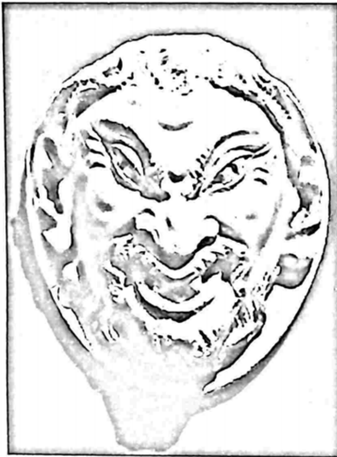
ဖွန်း နတ်ရုပ်တု