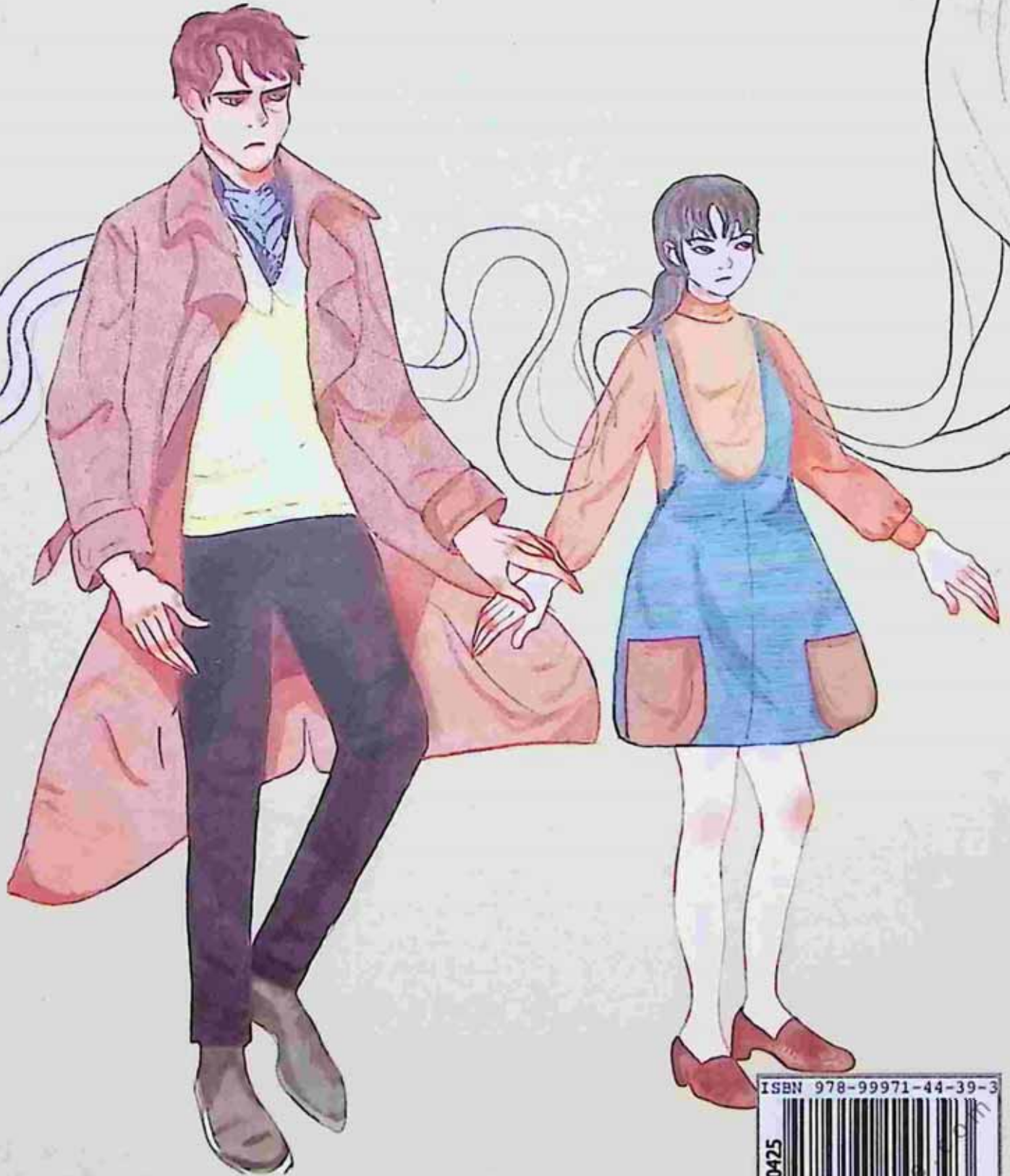
cover illustration: minmin thida

သူ့ဝတ္ထုများတွင် ကျွန်တော် အကြိမ်ကြိမ် ဖတ်ဖူးသည့် မြင်ကွင်းများ။ ပြုံးနေလိုက်မိ၏။