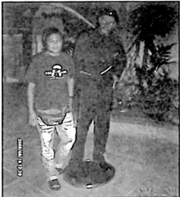
ကမ္ဘာကျော်မင်းသားကြီး ဆင်မြူရယ်ဂျက်ဆင် (ရုပ်တုနှင့် အမှတ်တရ)

လောက် ပေးရတယ် ဆိုပြီး သိရတာကြောင့် သူငယ်ချင်းတွေက အမှတ်တရ ရိုက်ပါလို့ ဝိုင်းတိုက်တွန်းပြီး ပိုက်ဆံ ပေးကြပေမယ့် သူများနဲ့ တွဲရိုက် နေချိန်ပဲ အမှတ်တရ မှတ်တမ်းတင် ရိုက်ခဲ့ပါတယ်။ အဲဒီလူအုပ်စုထဲက ထွက်လိုက်ပြီးတာနဲ့ ဆက်လျှောက် သွားတော့ ကမ္ဘာကျော် ရုပ်ရှင် သရုပ်ဆောင် ဒါရိုက်တာတွေရဲ့ ခြေရာ လက်ရာတွေ နေရာရောက် လို့ ရုပ်ရှင်ဒါရိုက်တာ မင်းသား၊ မိုက်ကယ်ကိန်း၊ ရှောင်ကွန်နရီ၊ ကျော်နီဒီ(ပ်)၊ မိုက်ကယ်ဒေါက် ကလပ်(စ်)တို့အပြင် ကမ္ဘာကျော် လူမည်းသရုပ်ဆောင် ဆင်မြူရယ်