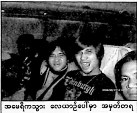
အမေရိကသွား လေယာဉ်ပေါ်မှာ အမှတ်တရ

ချက်ကို ဖြည့်ဆည်းဖို့ အခုလို နားကြပ်လေးတွေ ဝေပေးထားတော့ VCD သီချင်း ကျယ်ကျယ်လောင်လောင် ဖွင့်လို့ အိပ်မရတာတွေ၊ ရုပ်ရှင်တွေ အငြိမ့် VCD တွေရဲ့ အသံကို ကျယ်ကျယ်လောင်လောင် ဖွင့်တဲ့ ကားဆရာတွေ၊ အသံမကြားရမှာစိုးလို့ အသံကျယ်ခိုင်းတဲ့ စပီကာနဲ့ ထိုင်ခုံက ဆေးတဲ့ ခရီးသည်