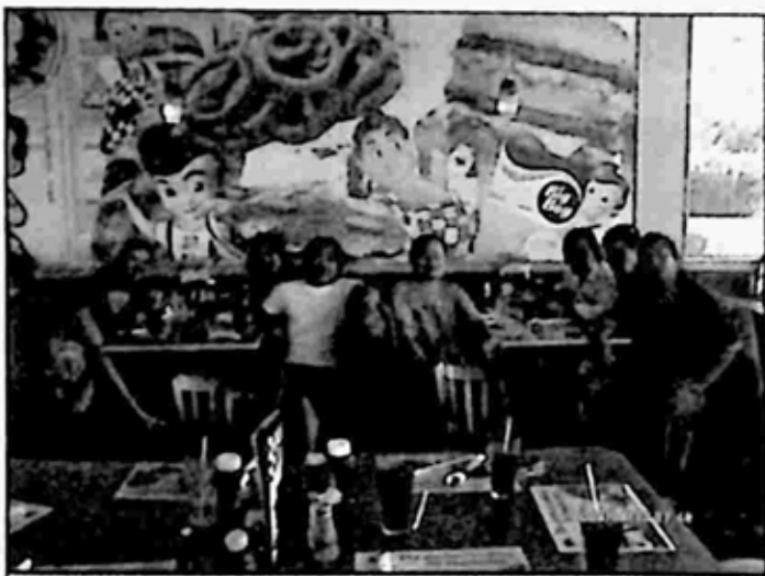
Lesvegas အသွားခရီး စားသောက်ဆိုင်တွင်

လက်မြောက်ခဲ့ရပါတယ်။ အပေါ့သွားတဲ့နေရာ ကန္တာရကလည်း လောပိတက ပို့တဲ့ လျှပ်စစ်တာဝါတိုင်ကြီးတွေလို တွေ့နေရလို့ လွမ်းစရာပါ။ သဲကန္တာရထဲက ချုံပုတ်တွေနဲ့လည်း အပျော်ဓာတ်ပုံ ရိုက်ကြပါသေးတယ်။ နေ့လယ်စာ စားဖို့ အချိန်ရောက်လာတော့ စားသောက်ဆိုင်တွေရှိတဲ့ လမ်းဘေးကို ထွက်ပြီး အမေရိကန် အစားအစာနဲ့ စပြီး တွေ့ရပါတော့တယ်။ အားလုံးလိုလိုက အမဲသားတွေနဲ့ မှာချိန်၊ ကျွန်တော်နဲ့ သင်္ဃန်းတော့ အမဲသား မစားကြလို့ ရှောင်တိမ်းမှာပေ မယ့် တကယ့်ကို အမေရိကန်နိုင်ငံက စားစရာ ကျွန်တော့်အတွက် နည်းပါးလွန်း တယ်။ ဒါကြောင့် ကြက်သားနဲ့ အိတ်လီခေါက်ဆွဲ မှာပြီး စားတော့ မြန်မာ ခေါက်ဆွဲအပေါ် ခရမ်းချဉ်သီးအချဉ်ရည်ပျစ်ပျစ် ဆမ်းပေးတဲ့ ခေါက်ဆွဲက ကျွန်တော့်အတွက် ဘာအရသာမှ မရှိခဲ့ပါဘူး။ ကြက်သားအပြားကြော်လေးနဲ့ စား၊ ကုတ်အချိုရည် တစ်ခါသောက်ဖို့ ခွက်ကြီးနဲ့ ဝယ်ပြီးရင် ကြိုက်သလောက် အဝသောက်။ ဆိုင်ထဲက ထွက်သွားရင်တောင် ခွက်ထဲ အပြည့်ထပ်ထည့်ပြီး ယူသွားလို့ရတဲ့ သူတို့ခလေးနဲ့ စားစရာ ဆိုသမျှ လူကောင်အကြီးကြီး အမေရိကန် ကြီးတွေအတွက် ပြုလုပ်ထားသလို ကျွန်တော်တို့လို လူကောင်သေးသေးတွေ၊ (ဟိုက ကောင်တွေထက် သေးတာ ပြောတာနော်) ဘယ်လိုမှ ကုန်အောင် မစားနိုင်ခဲ့ပါဘူး။ အဲဒီလို စားသောက်တဲ့ကိစ္စ ပြီးတာနဲ့ သဲကန္တာရထဲမှာ ခရီး ဆက်ရတော့ ကောင်းဘွိုင်ရပ်ရှင်ကားတွေထဲက မြင်ကွင်းမျိုး တွေ့ရတာ အံ့ဩ စရာပါ။ ဆူးပင်တွေနဲ့ ကန္တာရထဲမှာ ဟာလီဒေးဗစ်ဆင် (Harly Davidson) ဆိုင်ကယ်ကြီးတွေနဲ့ ကောင်းဘွိုင်ဦးထုပ်၊ ဖိနပ်နဲ့ အမေရိကန်တွေကိုလည်း