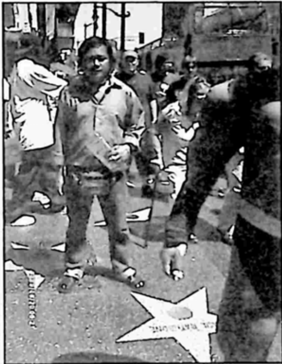
ကျွန်တော်နဲ့ Walk of Fame (အောင်မြင်မှုကြယ်ပွင့်များ)

အတူတူလာကြတဲ့ အခြား အနုပညာရှင် သူငယ်ချင်းတွေကတော့... အခုလို ဟောလိဝုဒ်ည မရောက်သေးချိန် ကျွန်တော်က စာရေးဖို့အတွက် အပင်ပန်းခံပြီး လိုက်ပို့ကြတဲ့ သူငယ်ချင်းတွေကိုလည်း ကျေးဇူးတင်စကား ထပ်ခါတလဲလဲ ပြောမိနေပါတယ်။ ရာသီဥတုကလည်း ရန်ကုန်လိုပဲ ဖြစ်နေလို့ တီရှပ်နဲ့ ဂျင်းဘောင်းဘီနဲ့ ပုံမှန်အတိုင်းပဲ ဝတ်မိတဲ့ ကိုယ့်အခြေအနေကို ဘေးကလူတွေ ကဲ့ရဲ့မလားလို့ သတိထားကြည့်မိတော့ ဘေးကလူတွေလည်း သူလို ကိုယ်လိုပဲ