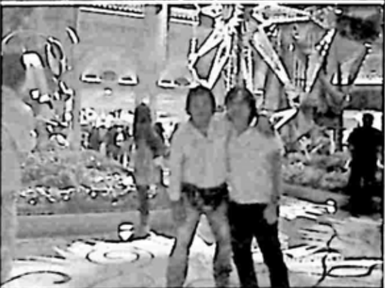
vegas ညတစ်ခွင် အမှတ်တရ