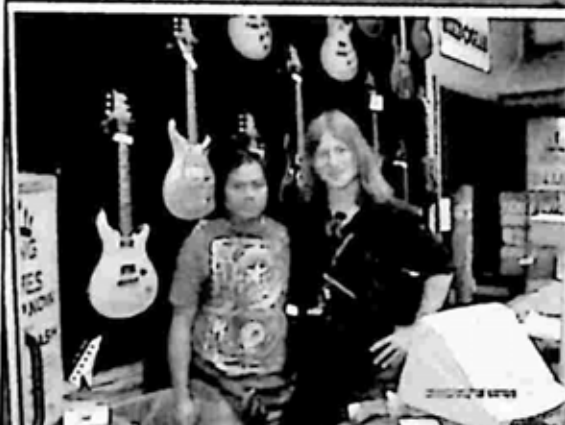
Guitar Centre ဆိုင်မှာ ဂစ်တာဝယ်စဉ် အမှတ်တရ