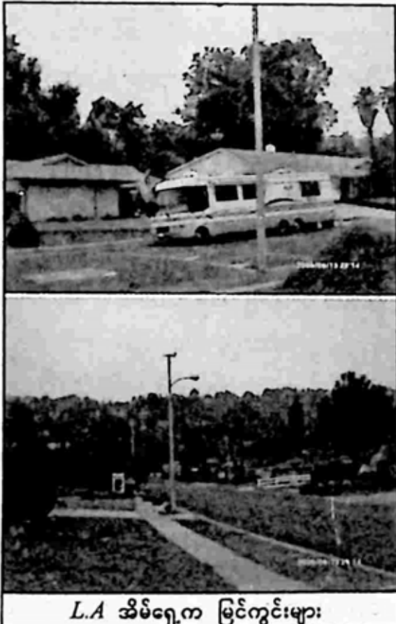
L.A အိမ်ရှေ့က မြင်ကွင်းများ

လည်း ဘယ်လိုမှန်း မသိတဲ့ အခြေ အနေနဲ့ အိပ်ရာက နိုးလာတော့ အိမ်ရှေ့ကို ထွက်ကြည့်လိုက်မှ ရာသီ ဥတုကလည်း အရမ်းမအေးဘဲ အနေ တော်လောက်၊ ရှေ့က လမ်းမကြီး မှာလည်း လူတစ်ယောက်မှ မရှိဘဲ ညာဘက် လမ်းဆုံးမှာ တံတားကြီး တစ်ခု (အမြန်လမ်းပါ) ဘယ်ဘက် မှာ လမ်းဆုံးရင် တောင်ကြီးတစ်ခု နဲ့ တောင်ပေါ်က အိမ်လေးတွေကို အစီအရီ တွေ့နေရပါတယ်။ အိမ်ရှေ့ က အိမ်မှာလည်း လူနေအိမ်နဲ့ ကား တွဲရက် (ရုပ်ရှင်ထဲမှာသာ မြင်ဖူးတဲ့) ကားအိမ်လေးတစ်စီးကိုလည်း တွေ့ရ ပြီး အမေရိကန် အလံကိုတော့