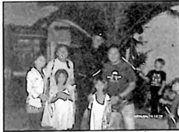
L.A မြို့ခံ သူငယ်ချင်းများနှင့် ဟောလိဝုဒ်ည အမှတ်တရ