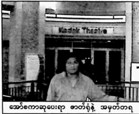
အော်စကာဆုပေးရာ ဓာတ်ရုံနဲ့ အမှတ်တရ

လျှောက်တော့ လက်ငှေ့အားကစား အကျော်အမော် မိုဟာမက်အလီ အထိမ်းအမှတ် ကြယ်ပွင့်က နံရံမှာ ကပ်ထားတာ တွေ့ရလို့ ထုံးစံအတိုင်း အတူတူ ဓာတ်ပုံရိုက်ခဲ့ရပါတော့တယ်။ အဲဒီနောက်မှာမှ တွေ့ပါပြီ မိုက်ကယ်ဂျက်ဆင် သက်ရှိလူပါ။ သူက မိုက်ကယ်ဂျက်ဆင်နဲ့ တူပြီး အင်္ကျီနီ၊ လက်မောင်းမှာလည်း လက်ပတ်အနက်နဲ့ ကန်းထရီးဦးထုပ် အနက်ဆောင်း၊ မျက်မှန်အနက် တပ်ထားပြီး ဓာတ်ပုံအရိုက်ခံနေပါတယ်။ ကိုဒတ်ခန်းမကြီးကတော့ ပိတ်ထားလို့ ဝင်ခွင့် မရတော့တာကြောင့် ခန်းမကြီးကို ဝင်တဲ့ လှေကားပေါ်တက်၊ ဓာတ်ပုံရိုက်ပြီးတာနဲ့ တစ်ဆက်တည်း ဆက်လျှောက်သွားပြီး ရှော့ပင်းမောလ်တွေ အရောင်း