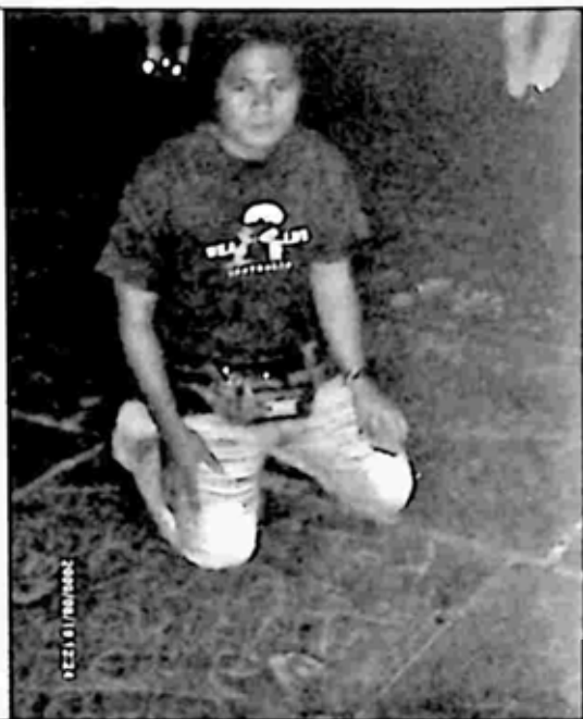
အောင်မြင်သူ ကမ္ဘာကျော်အနုပညာရှင်များ၏ လက်ဗွေများနှင့် ဟောလိဝုဒ်တွင်