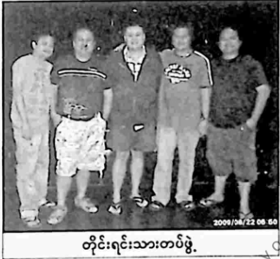
တိုင်းရင်းသားတပ်ဖွဲ့

ဒီလို စုံစုံညီညီ တိုင်းရင်းသား တပ်ဖွဲ့ကြီးနဲ့ U.S.A မှာ လာပြီး ဆိုကြ တီးကြမယ့် အစီအစဉ် မစခင် ဒီမနက်တော့ အဖွဲ့သား အားလုံး၊ အဆိုတော်အားလုံးကို လောင်းကစား မြို့တော် Las Vegas' မြို့ကို ဗဟုသုတအဖြစ် လိုက်ပြမယ်။ မနက် ၁၀ နာရီ