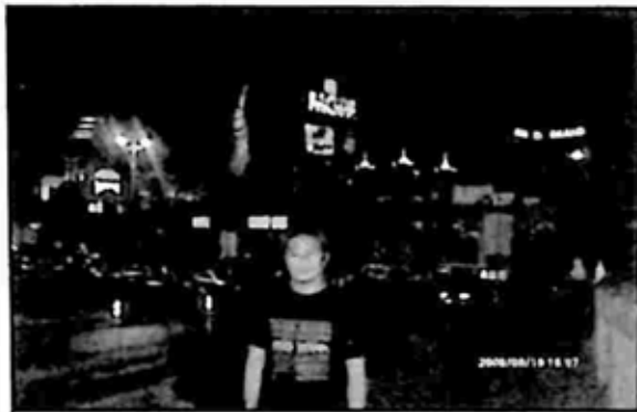
Lesvegas မြို့ရဲ့ ညအလှ