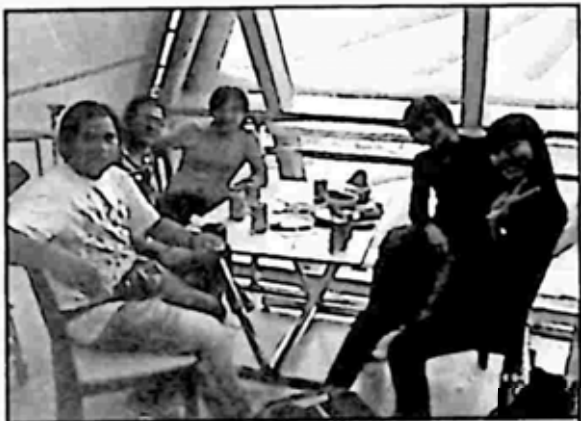
သုဝဏ္ဏဘူမိလေဆိပ် စားသောက်ဆိုင်တွင် အမှတ်တရ