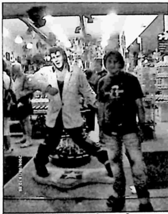
ပရက်စလေရုပ်တုနှင့် အမှတ်တရ

လျှောက်တော့ လက်ငှေ့အားကစား အကျော်အမော် မိုဟာမက်အလီ အထိမ်းအမှတ် ကြယ်ပွင့်က နံရံမှာ ကပ်ထားတာ တွေ့ရလို့ ထုံးစံအတိုင်း အတူတူ ဓာတ်ပုံရိုက်ခဲ့ရပါတော့တယ်။ အဲဒီနောက်မှာမှ တွေ့ပါပြီ မိုက်ကယ်ဂျက်ဆင် သက်ရှိလူပါ။ သူက မိုက်ကယ်ဂျက်ဆင်နဲ့ တူပြီး အင်္ကျီနီ၊ လက်မောင်းမှာလည်း လက်ပတ်အနက်နဲ့ ကန်းထရီးဦးထုပ် အနက်ဆောင်း၊ မျက်မှန်အနက် တပ်ထားပြီး ဓာတ်ပုံအရိုက်ခံနေပါတယ်။ ကိုဒတ်ခန်းမကြီးကတော့ ပိတ်ထားလို့ ဝင်ခွင့် မရတော့တာကြောင့် ခန်းမကြီးကို ဝင်တဲ့ လှေကားပေါ်တက်၊ ဓာတ်ပုံရိုက်ပြီးတာနဲ့ တစ်ဆက်တည်း ဆက်လျှောက်သွားပြီး ရှော့ပင်းမောလ်တွေ အရောင်း