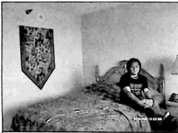
vegas က ဟိုတယ်ခန်းတွင် အမှတ်တရ

မဟုတ် မသိဘဲ ဂုဏ်ယူမိပါသေး တယ်) MGM ဟိုတယ်မှာဆိုရင် လည်း လောဘာတီရပ်တု အသေးစား ရော၊ ပဲရစ်မျှော်စင်ရော ပုံစံတူလေး တွေ ဆောက်ပြထားပြီး စိတ်ဝင်စား မှု ယူထားသလို ကမ္ဘာကျော် လက်ဆွဲ ပွဲကြီးတွေ ကျင်းပတဲ့ ဟိုတယ်ကြီး တွေနဲ့ အမှတ်တရ ဓာတ်ပုံရိုက်ခွင့် ရခဲ့လို့ ပျော်မဆုံး ဖြစ်ခဲ့ရပါတယ်။ ကျွန်တော်တို့အားလုံး မြို့ထဲ ဝင်ပြီး ချိန် တည်းခိုမယ့်အိမ်ဆီ သွားမယ် ဆိုပြီး ကားမောင်းတဲ့ မသိတာက အုတ်တံတိုင်း ကာရံထားတဲ့ FMI လို ခြံဝင်း အကျယ်ကြီးထဲ ဂိတ်စောင့် တွေကို ဖြတ်ပြီး ဝင်ခဲ့ပါတယ်။ ခြံဝင်း