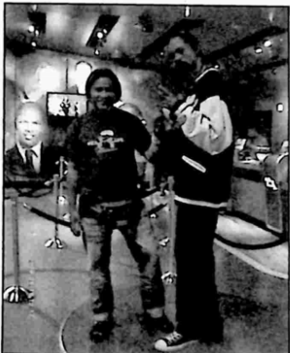
စနဒေါ့(ဟစ်ဟော့အဆိုတော် ဖယောင်းရုပ်တု) နှင့် အမှတ်တရ

မင်းသမီးနဲ့ ဖက်ပြီး ဓာတ်ပုံရိုက် ကြပါတယ်။ ကျွန်တော်တောင် အမှတ်တရ ဓာတ်ပုံရိုက်ခဲ့ပါသေး တယ်။ အဲဒီနောက် Rap(Hip Hop) အဆိုရှင် ကမ္ဘာကျော် စနဒေါ့ နဲ့လည်း တွဲရိုက်ဖြစ်ခဲ့ပါတယ်။ ဖယောင်းရုပ်နော်... လူအစစ် ထင်မနေကြနဲ့။ အဲဒီလမ်းမကြီးက မီးတွေ ထိန်လင်းနေပြီး ပလက် ဖောင်းတွေကလည်း ဖိတ်ဖိတ် တောက်အောင် ကြွေပြားတွေ ခင်း ထား၊ ကျောက်ပြားအချောတွေ ခင်းထားပြီး ပလက်ဖောင်း အကျယ် ကြီးတွေရဲ့ အလယ်မှာ အနီရောင်