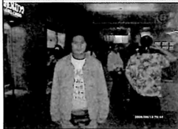
အမေရိက Lax လေဆိပ်မှာ အမှတ်တရ (လော့စ်အိန်ဂျလိစ်မြို့)