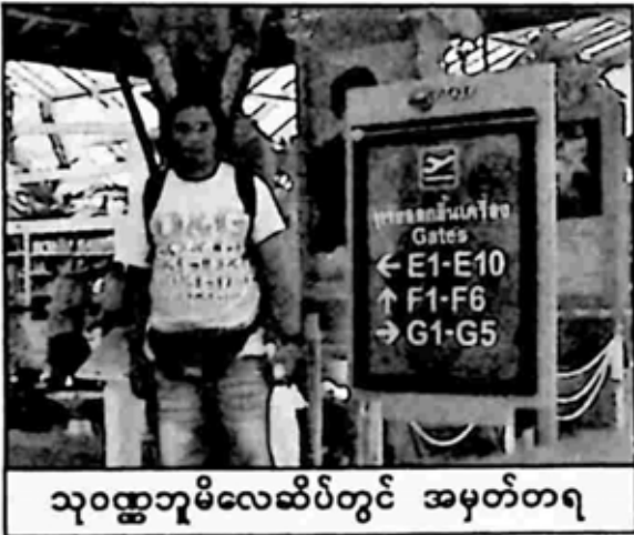
သုဝဏ္ဏဘူမိလေဆိပ်တွင် အမှတ်တရ

မဂ္ဂဇင်း၊ အခွန်လွတ် စာအုပ်ဆိုင် မှာ လိုက်ရှာပါတော့တယ်။ ထင်တဲ့ အတိုင်း တွေ့ပြီဆိုတာနဲ့ ကိုယ့် ဒေါ်လာငွေနဲ့ ပေးလို့ရသလား မေး၊ ပတ်စ်ပို့ပြုပြီး အဲဒီစာအုပ်ယူ ပိုငွေ ပြန်အမ်းတဲ့ ဘတ်ငွေ ယူပြီး အဆိုတော်တွေနဲ့ အဖွဲ့သားတွေ နောက် မြန်မြန်လိုက်ရပါတော့ တယ်။ စာအုပ်က ၁၅ ဒေါ်လာ