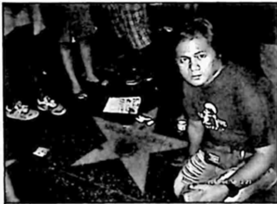
မိုက်ကယ်ဂျက်ဆင် အထိမ်းအမှတ် ကြယ်ပွင့်နှင့်

ဝတ်နေကြတာကြောင့် စိတ်သက်သာရာ ရမိပါတော့တယ်။ အဲဒီလမ်းပေါ်က ကြယ်ပွင့်တွေမှာ သာမန်လိုပဲ ဓာတ်ပုံရိုက်သူ တစ်ယောက်စ နှစ်ယောက်စ ရှိပေမယ့် လမ်းတစ်နေရာ ပလက်ဖောင်းပေါ်က နေရာကွက်ကွက်လေးမှာ လူတွေ ဝိုင်းအုံ့ပြီး ကြည့်နေတာကြောင့် ဘာ