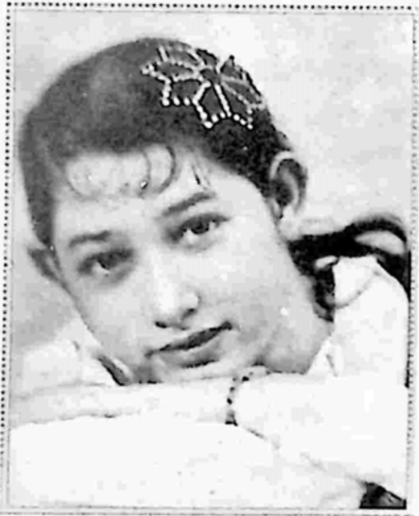
၁၃-နှစ်အရွယ် ခင်မကြီး