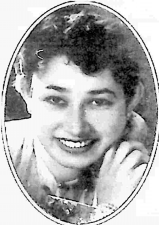
ခင်မကြီး

“သေလိုက်ပါတော့ကွာ၊ မင်းတော်တော်အူတဲ့ ဟာမလေးပဲ၊ အလုပ်တစ်ခု လုပ်တော့မယ်ဆိုရင် Location နေရာက အရေးကြီးတာကွ၊ ဘယ်နေရာမျိုးက အသွားအလာ စည်ကားသလဲ၊ ဘယ်လိုလူတန်းစား တွေရှိတဲ့ ပတ်ဝန်းကျင်လဲ၊ ကိုယ့်လုပ်ငန်းနဲ့ အပ်စပ်တဲ့ နေရာမျိုး ဖြစ်သလား၊ အရင်စဉ်းစားရတာ ရွေးရတာ၊ ငါက မင်း အဲဒီလို စိတ်ကူးထားပြီးသား နေရာရှိထားပြီးလို့ ခုလာပြီး ဆွေးနွေးနေတာ လို့ ထင်တာ”