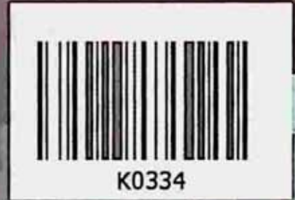
Illustration by JOSK