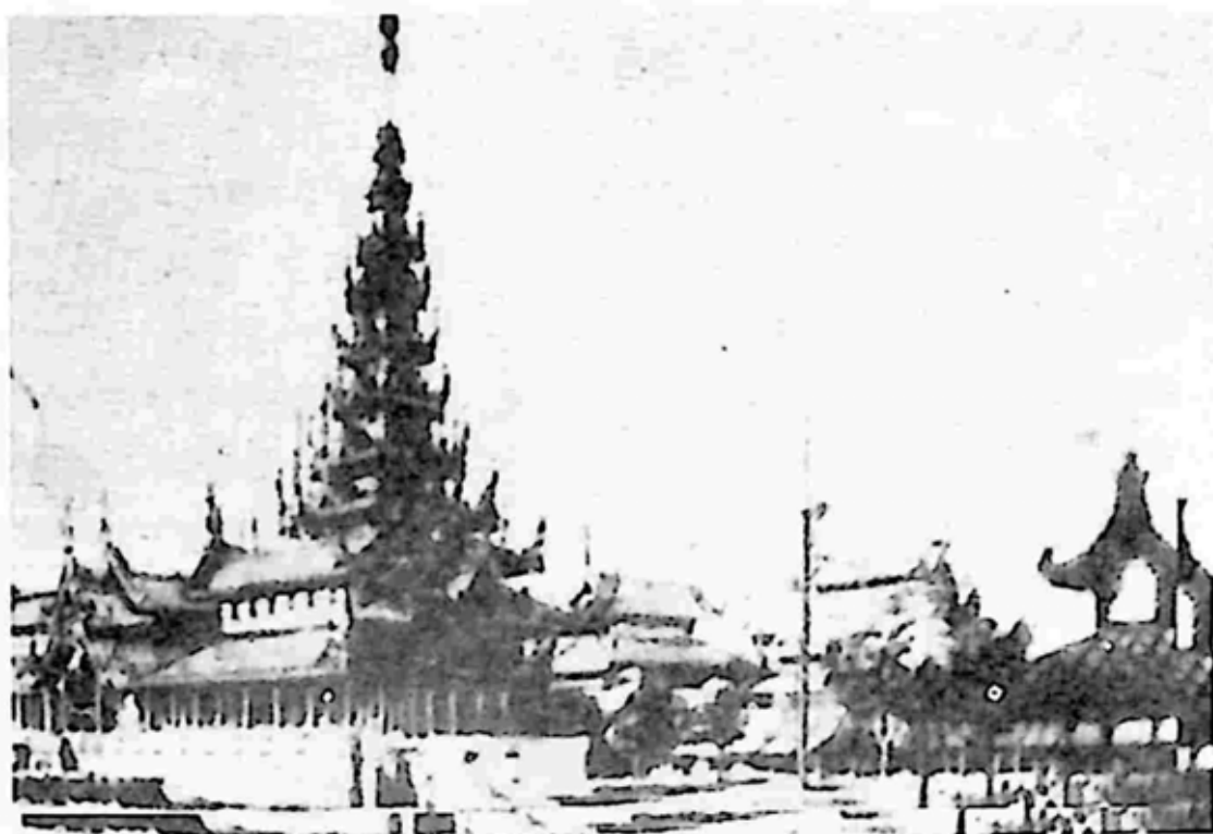
အမရပူရန်တော်