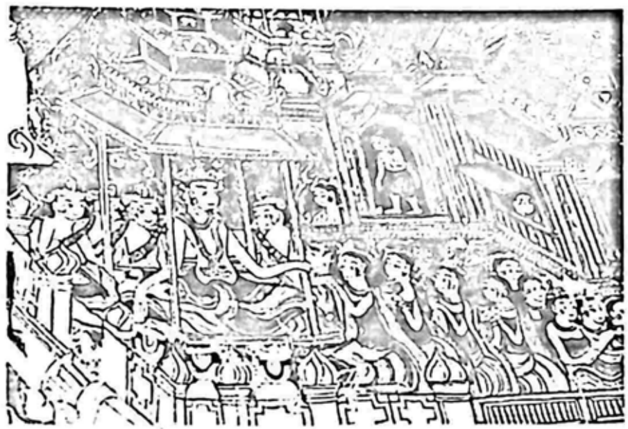
အင်းဝခေတ် ဆေးရေးပန်းချီမှ နန်းတွင်း အခမ်းအနား