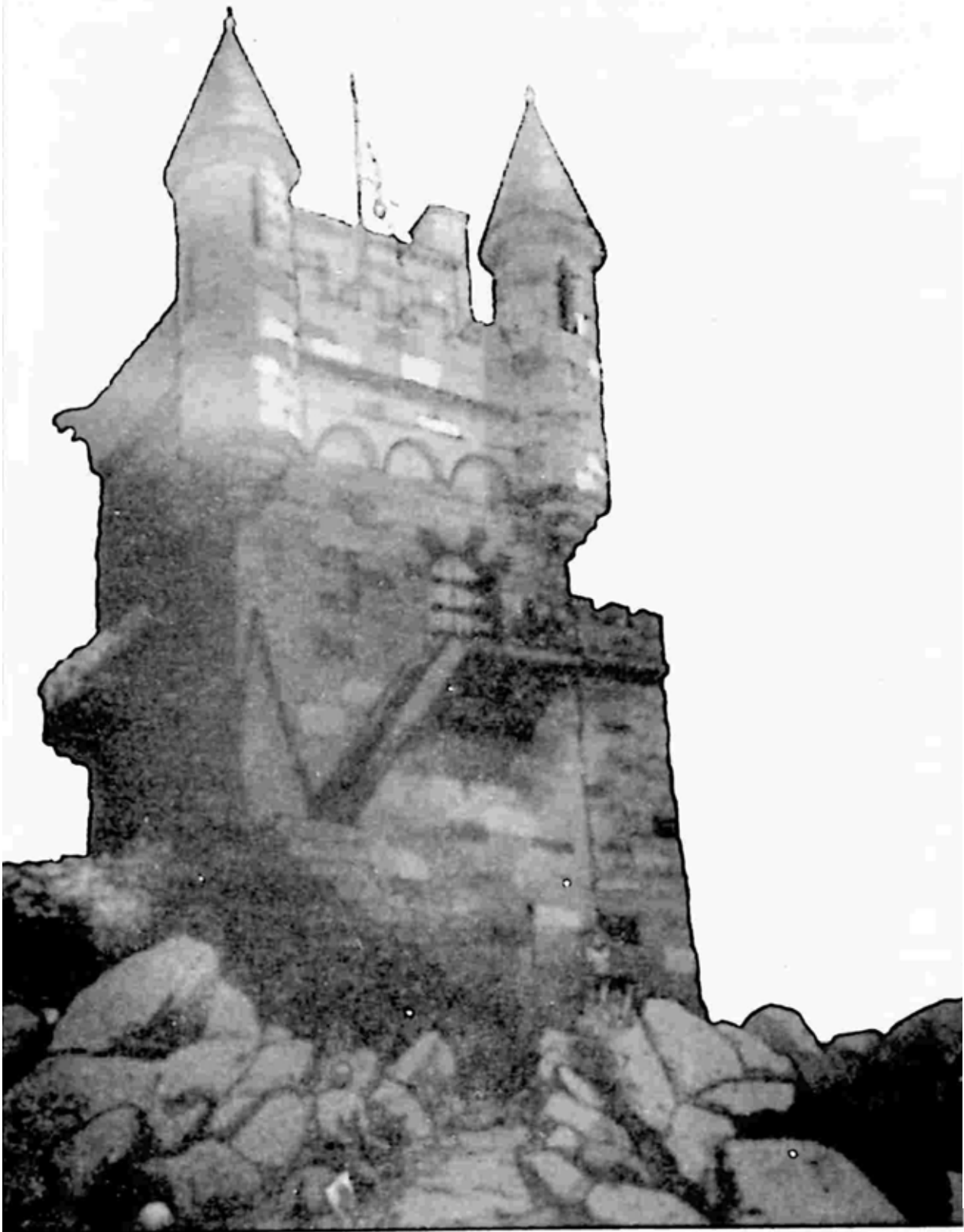
စတန်းဖက်စ် ရဲတိုက်