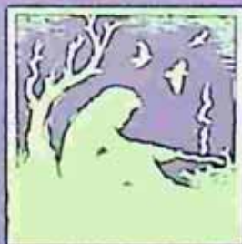
Cover Design: Maung Day