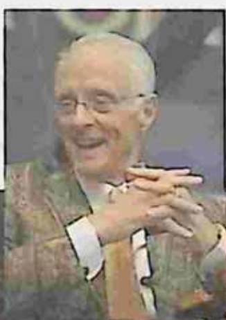
ROBIN COOK (American novelist)

ဤဝတ္ထု ပီစီဒါ သည် ရော်ဘင်ကွတ်ခ်၏ အခြား အခြားသော ဝတ္ထုများနှင့် ကွဲပြားခြားနား၏။ အမှန်တကယ် ရှိခဲ့သည်ကပ်ရောဂါ တစ်ခုဖြစ်သော အီဘိုလာကပ်ရောဂါကို အရင်းတည်ကာ အမေရိကန်ဆေးလောက တစ်ခုလုံးကို မွေနှောက်ချောက်ချားအောင် ဇာတ်အိမ်တည်ထားပြီး ကပ်ရောဂါဗေဒ (Epidemiology) ပညာရပ်၊ ပြည်သူ့ကျန်းမာရေးပညာရပ် (Public Health)၊ အမေရိကန်ပုဂ္ဂလိက ဆေးရုံဆေးခန်းများနှင့် ကြိုတင်ငွေပေး ကျန်းမာရေး အာမခံစနစ် (Pre-paid health insurance plan) တို့ကို အချိုးကျကျမွေနှောက်ကာ ရေးသားထား၏။ ဆေးပညာရပ်ကို ဈေးကွက်အတွင်း သွတ်သွင်းခြင်း (Commercialization of medicine) ၏ နောက်ဆက်တွဲဖြစ်ရပ်များအကြောင်းကို ဇောင်းပေး ရေးသားထားသည်ဆိုလျှင် မှားအံ့မထင်။